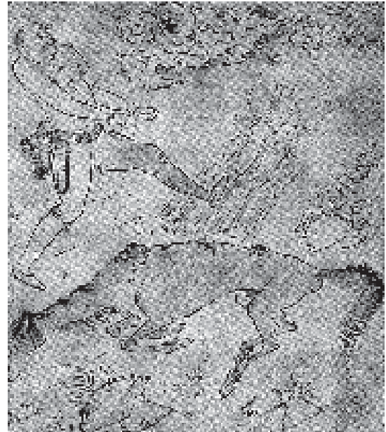
تصویر ۵. روستایی واسب نحیف، حدود ۱۰۰۰ ق.

رضا عباسی (آقارضا فرزند علی اصغر کاشی) در خانواده‌ای هنرمند متولد شد و همان‌گونه که در ایران قدیم مرسوم بود پیشه پدرش علی اصغر کاشانی یعنی نگارگری و نقاشی را در پیش گرفت. «میان پیشه‌وران، بنا به عادت جاری، حرفه‌ها موروثی بود. فوت‌وفن مشاغل را پسران از پدران یا از خویشان به ارث می‌بردند. فرزند به پدر خود در کار و حرفه یاری می‌داد و ضمناً شغل پدر را یاد می‌گرفت» (آژند، ۱۳۸۰: ۷). هرچند آقارضا در کنار پدر در برابر ابراهیم میرزا و شاه اسماعیل دوم و در کنار نگارگران برجسته‌ای چون میرزا علی و شیخ محمد و چند تن دیگر آموزش دید، ذوق و استعداد خاصی در او بود که باعث شد در همان دوران جوانی مورد توجه قرار گیرد و منزلت خاصی در میان هنرمندان یابد. بنابراین، «او در حالی که فرزند خانواده‌ای هنرمند و با استعداد و مورد عنایت بود و خودش نیز بهره‌مند از توانایی‌های زیادی بود، طبیعتاً به‌عنوان نابغه‌ای جوان به