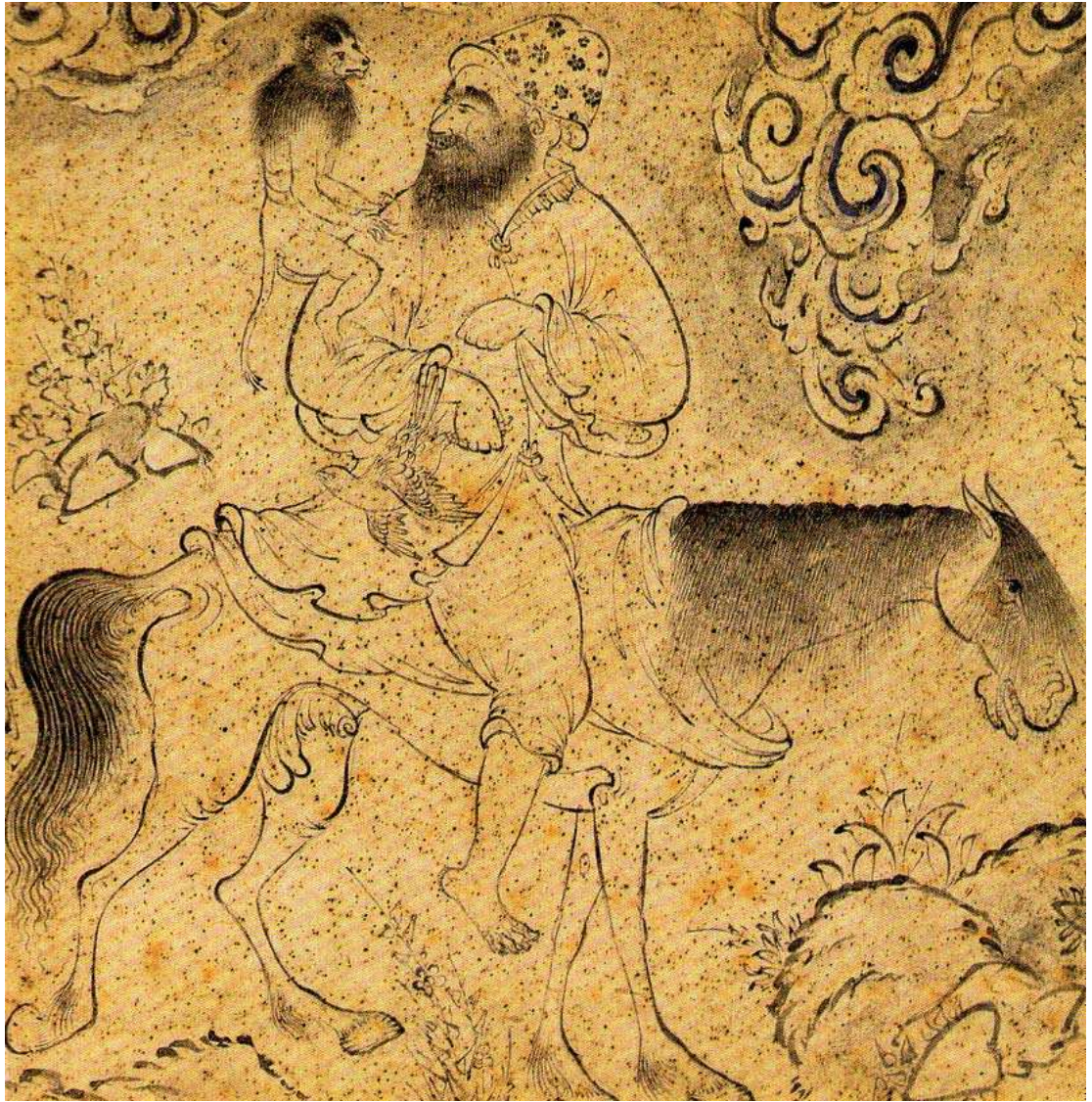
تصویر ۱. لوطی وانترش، حدود ۱۰۰۳ق.

بازتاب می‌یابد. رویکرد سوم، فلسفی جامعه‌شناختی و متأثر از نظریات ماکس شلر فیلسوف آلمانی است. شلر جامعه و معرفت را علت هم نمی‌داند، بلکه می‌کوشد نظریه عینی درباره معرفت ارائه دهد. «وی معرفت را تحت عنوان عوامل ایده‌ای که بصیرت محض، اما فاقد قدرت و نیرو، هستند معرفی می‌کند و در مقابل آن جامعه و شرایط اجتماعی را محدوده عوامل واقعی می‌نامد که نیروهای محضاند، بدون نور و بصیرت. هیچ‌یک از این دو حوزه به‌تنهایی نمی‌توانند تغییری در روند تاریخ به وجود آورند، بلکه از اتحاد این دو حوزه است که موتور تاریخ به حرکت درمی‌آید» (راوودراد، ۱۳۸۲: ۱۵).