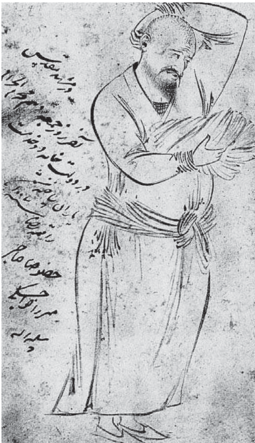
تصویر ۴. زائری از مشهد، ۱۰۰۶ ق.

تنوع در مضامین نگاره‌ها: «برای نخستین بار، هنرمندان توانستند آزادانه بدون سرپوش‌نهادن بر چهره متکدیان، لوطیان، کارگران و روسپیان جامعه ایران را با همه تنوع و چندگونگی‌اش به تصویر کشند. از این رو، نقاشی از صحنه‌های زندگی روزمره، چهره‌پردازی از درویشان و کودکان و تصویرپردازی از خیمه و خرگاه چادرنشینان به مجموعه مضامین هنرمند دوره صفوی افزوده شد» (کنبی، ۱۳۸۴: ۳۱). نتیجه این تغییر را می‌توان گسترش سطح مخاطبان هنر نگارگری و استقلال نسبی در انتخاب موضوع دانست که موجب تنوع موضوعات در کارهای انفرادی هنرمندان نگارگری چون رضا عباسی شد.