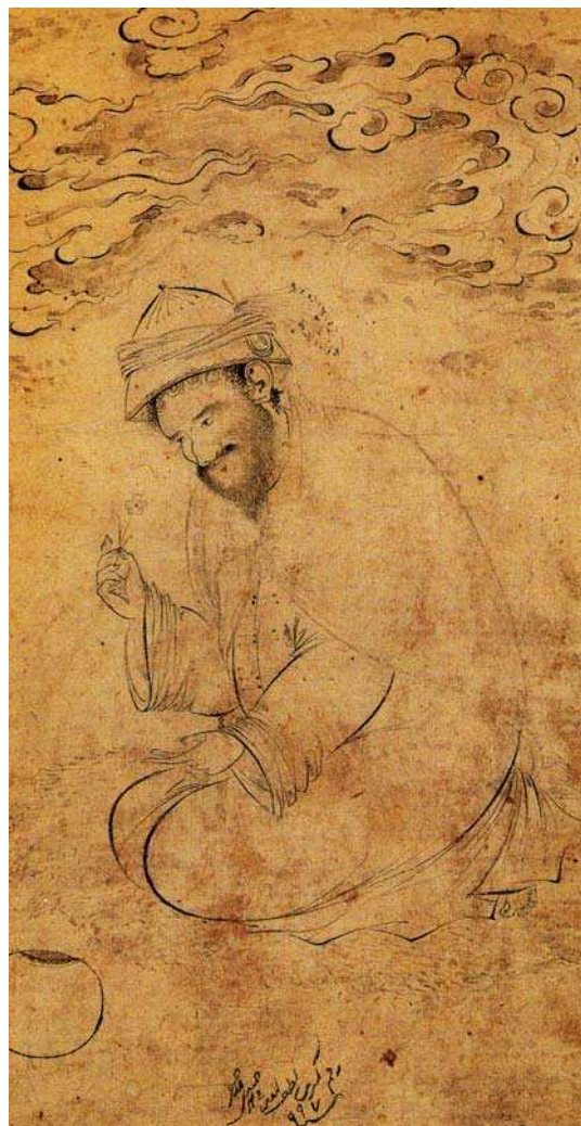
تصویر ۶. درویش نشسته با گلی در دست، ۹۹۷ق، ماخذ: همان، ۶۱.

او با برگشت به دربار مجدداً به تصویرگری نسخه‌های خطی روی می‌آورد، نسخه‌هایی همچون گلستان سعدی و مخزن‌الاسرار متعلق به این دوره است. «آثار دوران پایانی