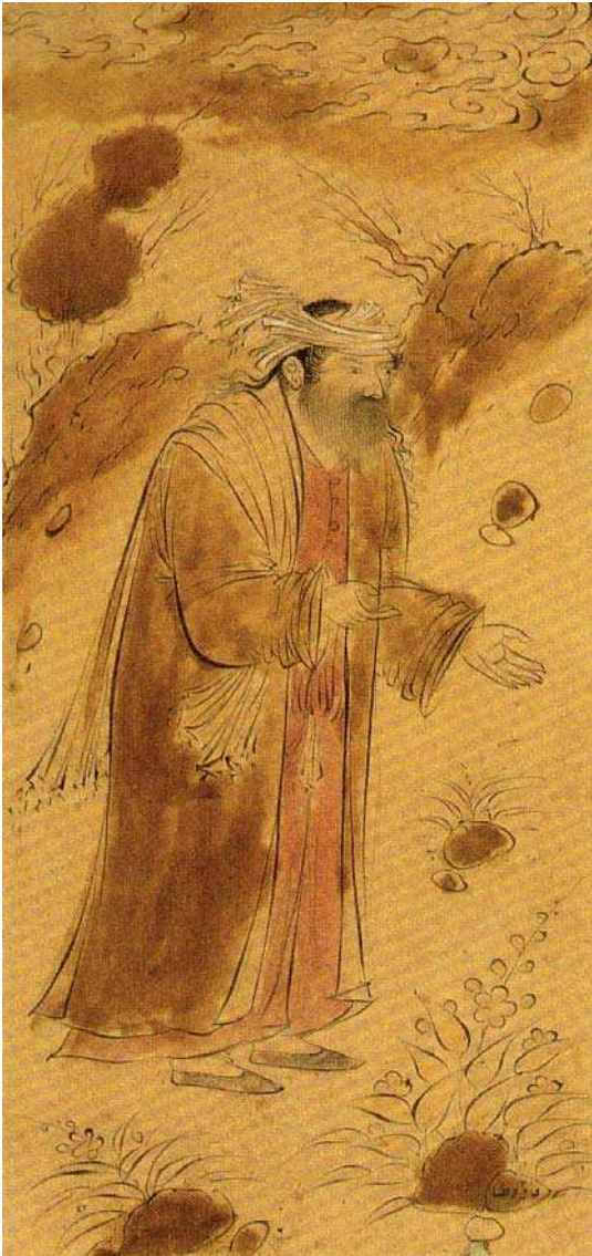
تصویر ۲. شیخ دربیابان یا شیخ در زمین بایر ۱۰۱۴-۱۰۱۲ ق. مأخذ: همان، ۷۹.

بر اساس کدامیک از رویکردهای جامعه‌شناسی بررسی کرد، می‌توان چند گزینه را در نظر گرفت. با توجه به نگاه آرمانی و فرازمینی که در هنر نگارگری ایران اصلی اساسی بوده است، شاید بتوان این هنر را قائم‌به‌ذات و در رویکرد اول جای داد.