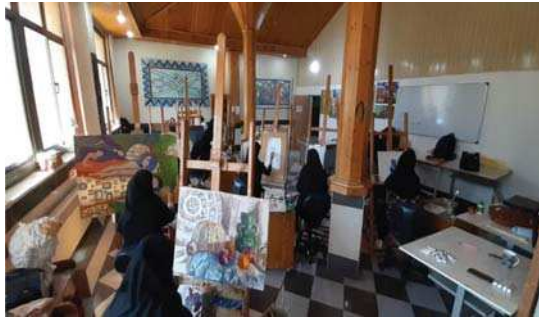
تصویر ۱. آتلیه نقاشی، دانشکده هنر، یکی از دانشگاه‌های استان گلستان