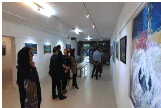
تصویر ۳. نمایشگاه نقاشی، یکی از گالری‌های استان گلستان

مشکل اقتصاد هنر در استان گلستان می‌باشند.