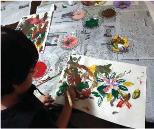
تصویر ۲. کارگاه هنر کودک والد، ۱۳۹۹، آموزشگاه هنرهای تجسمی، گرگان، مأخذ: همان

فقر قیمتی در فرایند تولید، ظرفیت بهره‌وری آن محدود می‌شود؛ سوم اینکه برای تعیین ارزش کار باید همکاری عوامل متعدد را در محاسبه آورد؛ چهارم انگیزه‌ی نوآوری مادی نیست. (Zorloni, 2013, 26)