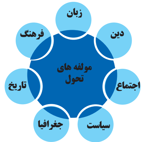
نمودار ۱. مؤلفه‌های تحول در بستر عواملی رخ می‌دهند که شرایط را برای تغییر آماده می‌سازند، مأخذ: نگارندگان

ارکان و الزامات تحول در فلزکاری دوره صفویه در یک بررسی کلی می‌توان دریافت در تمام تحولات هنری در دوره‌های مختلف در شرق و غرب، رویکردهای اجتماعی، مذهبی، سیاسی و اقتصادی دخالت داشته و به نحوی در دولت‌های مختلف مشترک هستند؛ اما با مطالعه شرایط دوره صفوی و میزان پیشرفت در تبلور هنرهای صناعی، به نظر می‌رسد که نقش تحولات این دوره نسبت به دوره‌های پسین و پیشین، از اهمیت بیشتری برخوردار است. در مورد اشیاء فلزی باید حضور هنرمندان و خاستگاه‌های اصلی کارگاه‌های هنر فلزکاری را در مطالعه تاریخ صفویه دنبال کرد؛ هرچند در مورد زندگی شخصی و امضای هنرمندان فلزکار به‌طور خاص، اطلاعات مکتوب کمی در دسترس است؛ بنابراین به نظر می‌رسد هنرهای صناعی در دوره صفویه با مؤلفه‌هایی همچون وضعیت اصناف و اوضاع اجتماعی-مذهبی جامعه در ارتباط مستقیم بودند. طبقات مختلف جامعه از بازار تا مسجد و سقاخانه