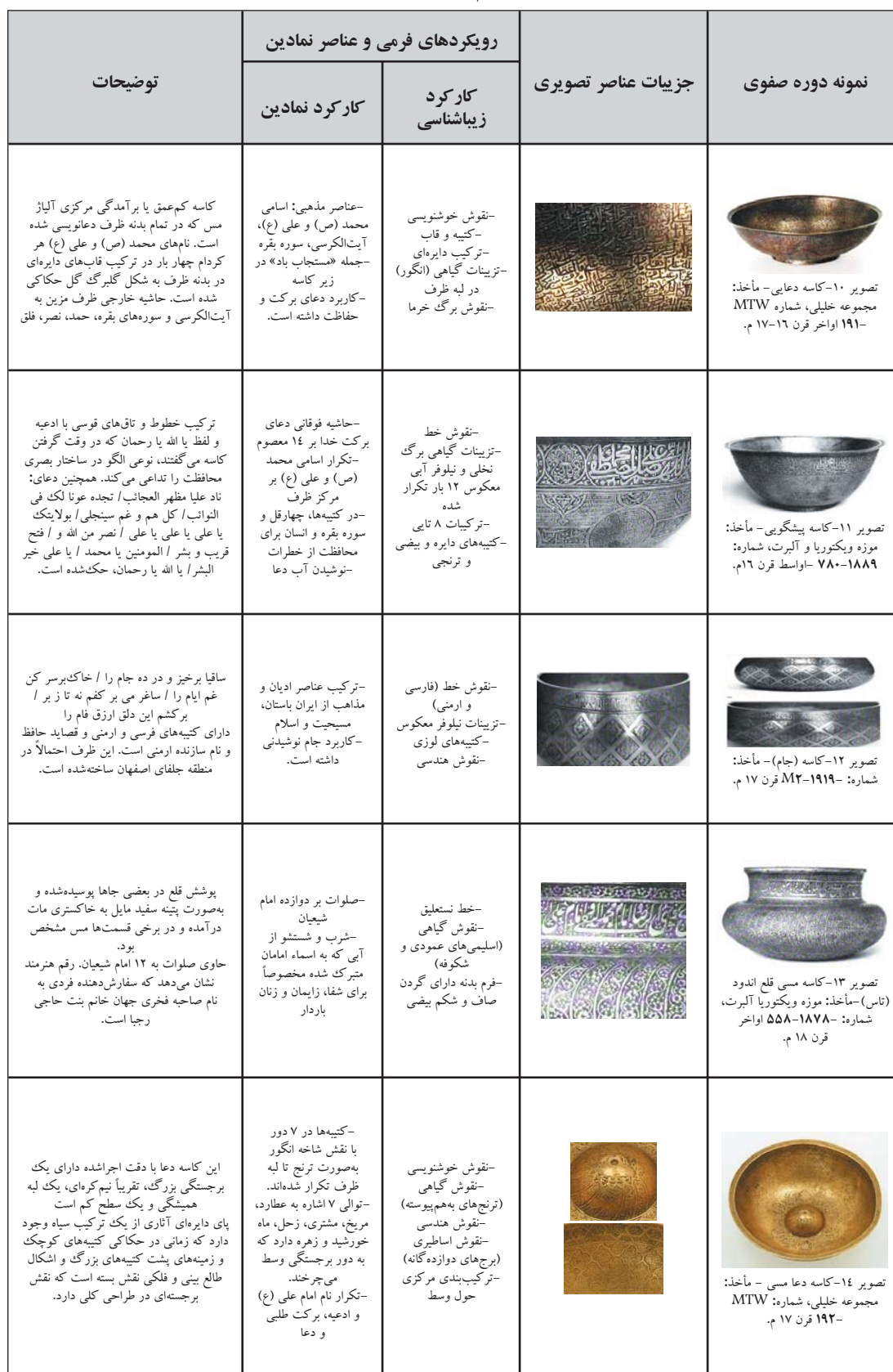
جدول ۵. خوانش مؤلفه‌های تصویری و نمادین در کاسه‌ها و جام‌های دوره صفویه، مأخذ: همان