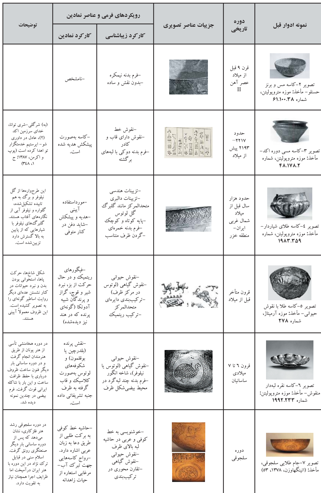
جدول ۴. مروری بر خوانش مؤلفه‌های تصویری و نمادین در کاسه‌ها و جام‌های تاریخی، مأخذ: همان