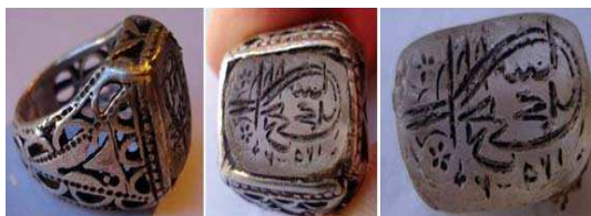
تصویر ۱۳. مهر انگشتی، ۱۲۹۲ هجری، جنس: نقره و عقیق سفید، انگشتی ریخته گری و مشبک کاری شده است. بر روی مهر عبارت «الراجی شاه محمد» به خط طغرا حکاکی شده است، مجموعه خصوصی

کشور ایران گذاشت. اصناف گسترده تر شد و به این علت نیاز به مهر و مهر انگشتی افزایش یافت. اقشار جامعه اعم از اشراف، اعیان، ملاکین و روحانیان گرفته تا تجار، آهنگر و بزاز و... به علت تحولات در سیستم اداری و اجتماعی و کارکرد کثیر مهر انگشتی برای فعالیت های اجتماعی و سیاسی و... صاحب مهر شدند. حتی بعضی از افراد به علت موقعیت و فعالیت های مختلف اجتماعی چندین مهر داشتند. بدین ترتیب، مهر یکی از ضروریات هر فردی به شمار می رفت. پولاک در این باره می نویسد: «مهر همه جا به جای امضا که مرسوم نیست به کار می رود و آن را با استفاده از نوعی جوهر به زیر اسناد می زنند و بدین طریق به اسناد قوت قانونی می بخشند. هرگاه مهر کسی مفقود شود وی اعلام می کند که از این پس از مهر دیگری استفاده خواهد کرد» (پولاک، ۱۳۶۸: ۲۰-۳۱۹).