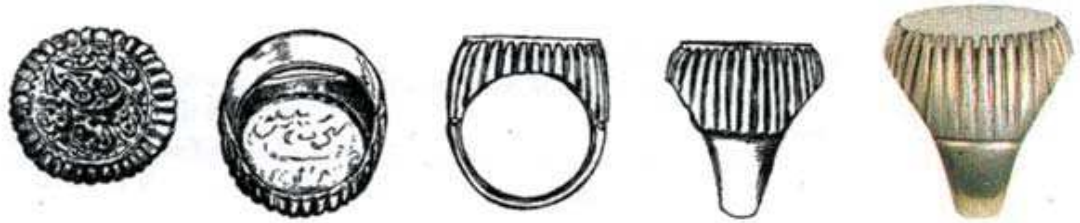
تصویر ۱۰. مهر انگشتری، ایران، ۱۳۲۲ هجری، نقره و عقیق سفید، مهر دایره شکل آن به سبک مهرهای تیموری است و حامل حکاکی «الهی به حق حسین شهید رضا مرتضی را مکن نا امید» ارتفاع: ۲۷، پهنا: ۲۴، پهنا پایه نگین: ۲۴ م.م. ماخذ: Wenzel, 1993: 17