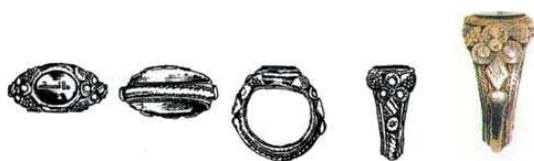
تصویر ۱۴. مهر انگشتی، ایران، ابتدای قرن ۱۳ هجری، نقره و سنگ عقیق سیاه، بر روی مهر سنگ کتیبه ای به سبک قدما مشتمل بر «علی الله» حک شده و مانند خود انگشتی مربوط به قرن ۱۳ هجری است. ارتفاع: ۲۹، پهنا: ۲۸، پهنای پایه نگین: ۱۵ م.م، ماخذ: همان ۱۶۹