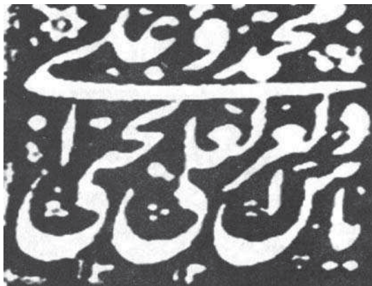
تصویر ۱۹. اثر مهر انگشتری بر روی سند با سجع: یا ذالعرش العلی نجی بمحمد و علی (۱۳۱۲) (احتشامی، ۱۳۸۵: ۷۸-۸۹)