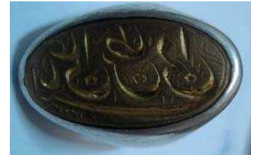
تصویر ۲۳. ذکر «یا علی بن ابی طالب» ۱(۲)۲۳ بر نگین انگشتر، مجموعه خصوصی ویسی