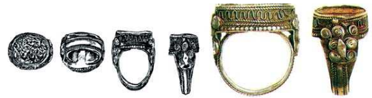
تصویر ۱۵. مهر انگشتر، ایران، ۱۲۴۹ هجری، نقره و سنگ عقیق گلگون، مهر بیضی شکل انگشتر روی یک سینی از ورقه نقره قرار دارد. بر روی سنگ عبارت «عبدالله الراجی محمد باقر الحسینی ۱۲۴۹» یعنی بنده امیدوار... حک شده است. ارتفاع: ۲۹/۵، پهنا: ۲۷/۵، پهنای پایه نگین: ۱۸/۵، م، ماخذ: همان، ۱۶۹