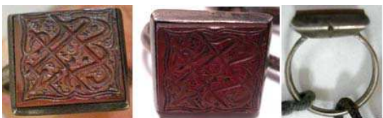
تصویر ۲. مهر انگشتری، قاجار، جنس: نقره و سنگ عقیق، در یک طرف نگین دان علامتی وجود دارد که نشان دهنده جهت استفاده صحیح از مهر انگشتری است. مهر آن به شکل مربع است که با خط ثلث بر آن عبارت «یا حسین ابن علی (ع)» حک شده است. مجموعه کاخ گلستان

دیگر آثار مورد بررسی توسط مشاهدات عینی نویسنده از مجموعه داران شخصی جمع آوری شده است.