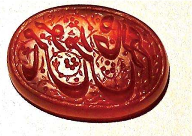
تصویر ۱۷. قسمتی از دعای جوشن کبیر بر نگین انگشتر، مجموعه خصوصی دکتر محفوظی

مهرهای سلطنتی را به گردن آویخته بود و فرامین شاه را به آن‌ها مهور می‌کرد.