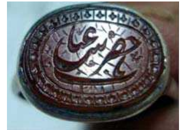
تصویر ۲۴. ذکر «یا حضرت عباس» بر نگین انگشتر، مجموعه خصوصی ویسی

ذکر دیگر قسمتی از دعای جوشن کبیر است با متن «یا مَنْ هُوَ مَنْ رَجَاهُ كَرِيم» (تصویر ۱۷). دعای جوشن کبیر مخصوص شیعیان است که در شب‌های مخصوصی از جمله شب‌های پرفضیلت قدر خواندن آن سفارش شده است. خواص بی‌شماری برای این دعا ذکر کرده‌اند از جمله