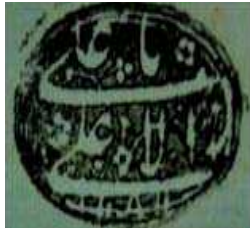
تصویر ۲۵. اثر مهر انگشتی بر روی اسناد قدیمی از راست به چپ: یا عباسعلی... محمد رسول الله علی ولی الله، یا علی الاعلی