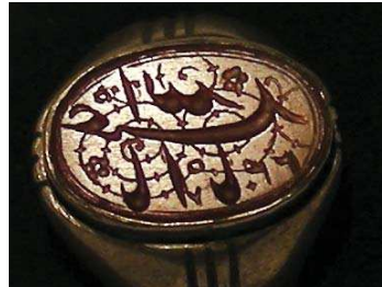
تصویر ۲۶. ذکر «یا ابا عبدالله ۲۴۷» بر نگین انگشتر، مجموعه خصوصی ویسی