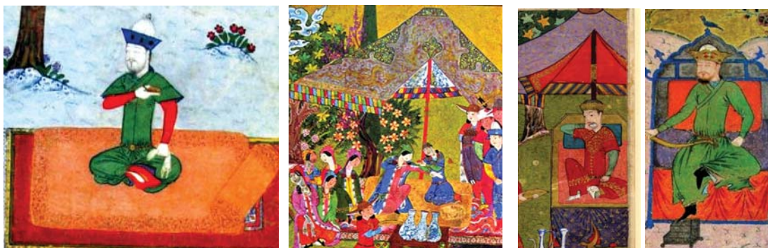
تصاویر ۲۵ و ۲۶ و ۲۸ و ۲۷ از راست به چپ: نگاره ۷. مأخذ: آژنده، ۱۳۸۷: ۲۶۹ و نگاره ۸. مأخذ: شایسته‌فر، ۱۳۷۹: ۶ و نگاره ۱۱. مأخذ: تنهایی، ۱۳۸۷: ۱۵۱ - نگاره ۵. مأخذ: آژنده، ۱۳۸۷: ۲۶۶

عارف بزرگ قرن هفتم و هشتم بود که در تبریز به تخت نشست. پس از او توسط یکی از نوادگانش به نام اسماعیل شهر قزوین به عنوان پایتخت قرار داده شده و پس از او شاه عباس پایتخت را از قزوین به اصفهان منتقل کرد (پیرنیا، ۱۳۸۷: ۲۷۳) از آثار مهم این دوره به فرمان شاه می‌توان به خیابان چهارباغ اشاره کرد. خیابان چهارباغ در منطقه پرجمعیتی از شهر با حالت تفرجگاهی و گردشگری بوده که در آن ۴ نهر آب (ویلبر، ۱۳۸۷: ۱۱۲) و اطراف آن باغات سلطنتی وجود دارد (پیرنیا، ۱۳۸۷: ۲۷۶).