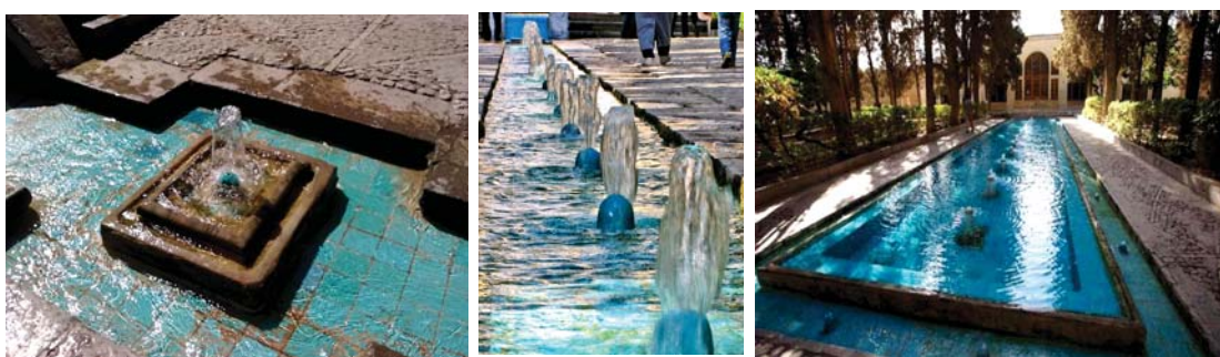
تصاویر ۱۳ و ۱۴ و ۱۵. نظام آب در باغ فین کاشان.