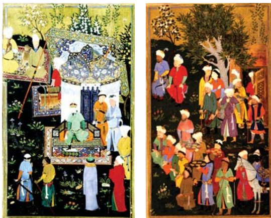
تصاویر ۱ و ۲. تیمورلنگ در یکی از باغ‌های سلطنتی از ظفرنامه علی یزدی، مأخذ: TIMUR GRANTING, 2014-ULUC, 2014

روش تحقیق در این مقاله به صورت توصیفی-تحلیلی و شیوه جمع‌آوری اطلاعات استناد به منابع کتابخانه‌ای و روش تجزیه تحلیل کیفی بوده است. انتخاب تصاویر نیز بر اساس موضوع مورد بررسی باغ ایرانی است. این مقاله در سه بخش تنظیم گشته است: در بخش آغازین نگارگری مکتب شیراز در دوره‌های مختلف و دلایل اوج شکوفایی آن بررسی شده است و در بخش بعدی با استناد به منابع