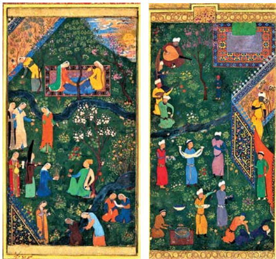
تصاویر ۸ و ۹. باغ حسین بایقرا، کار بهزاد. مأخذ: ویلبر، ۱۳۸۷: ۷۳ و ۷۳

مکتب نگارگری شیراز به تعبیر، ام المکاتب ایران در قلمرو کتاب آرایبی است. گرچه به خاطر فرهیختگی و طراحی طیف رنگی به پای مکاتب تبریز و هرات و اصفهان نرسید ولی از حیث تداوم و استمرار و تجربه بدان‌ها پیشی گرفت. سر چشمه‌های این مکتب در ایران پیش از اسلام ریشه بسته است و بعد از اسلام نشانه‌های آن در تصویرگری