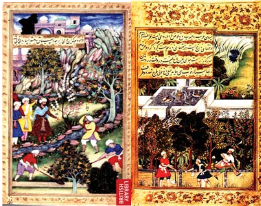
تصاویر ۳ و ۴ و ۵ و ۶. باغ وفا. مأخذ تصاویر ۳، ۴: MUGHALGARDEN, 2012 مأخذ تصویر ۵: SACREDPLACE, 2013 مأخذ تصویر ۶: BAGH-I-VAFA, 2014.