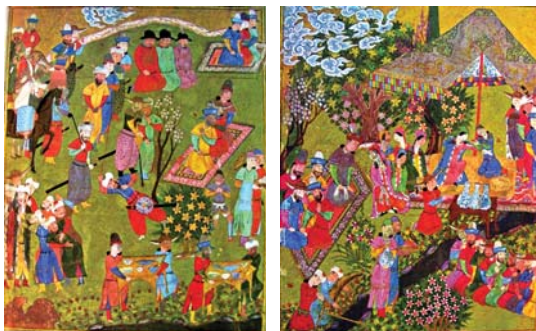
تصاویر ۳۱ و ۳۲. از راست به چپ: نگاره‌های ۱۱ و ۱۲.

سایر عناصر مصنوع و تزئینی: در بررسی عناصر مصنوع و تزئینی می‌تواند به آلاچیق‌ها، نرده‌ها، نقوش فرش و چادرها و تخت‌ها و صفاها و پیاده‌روها اشاره کرد (بهبهانی، ۱۳۸۱: ۹۵). استفاده از نقوش گیاهی و اسلیمی در طراحی بناهای کوشک و استفاده از آلاچیق‌های منقوش به طرح‌های گیاهی و به کارگیری چادرها و فرش‌هایی با طرح گل گواه بر وجود عناصر تزئینی در باغ است. در نگاره ۱۳ کتیبه‌های عربی نیز در بالای سردر عمارت دیده می‌شود. مقیاس کتیبه و نرده به عنوان عناصر تزئینی در نگاره ۶ (تصویر ۳۰) و هم‌چنین مقیاس عناصر معماری