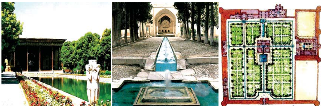
تصاویر ۱۰ و ۱۱ و ۱۲. از راست به چپ پلان باغ فین، تصویر باغ فین، عمارت چهل ستون.