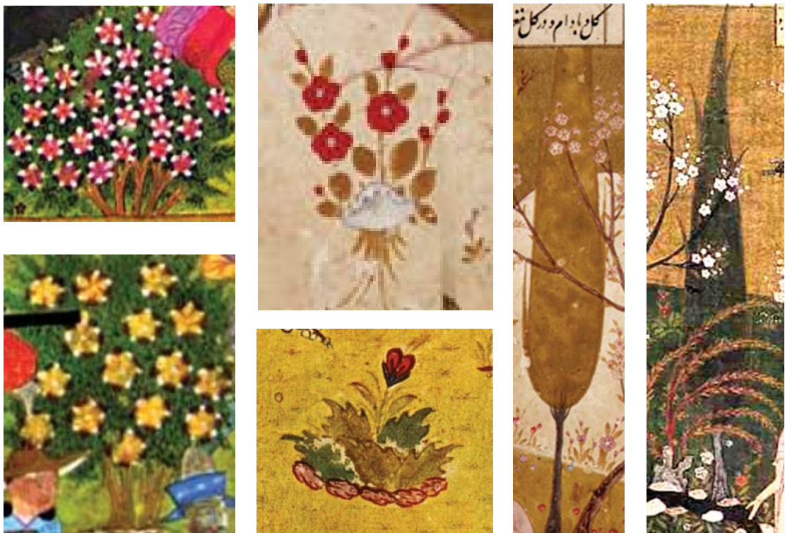
تصویر ۱۹ و ۲۰ و ۲۱ و ۲۲ و ۲۳ و ۲۴ از راست به چپ: گل‌های نگاره ۱. مأخذ: PERSIAN PAINTING, 2014 و نگاره‌های ۲ و ۲. مأخذ: شایسته فر، ۱۳۷۹: ۳۹ و نگاره ۹. مأخذ: همان: ۷۳ و نگاره‌های ۱۱ و ۱۲. مأخذ: تنهایی، ۱۳۸۷: ۱۰۱ و ۱۴۹

محصور با دیوارهای چوبی که کوشک در آن است و خندقی آکنده از آب، دور آن و حیوانات در آن قرار دارد (ویلبر، ۱۳۸۷: ۶۲-۶۴؛ تصویر ۷).