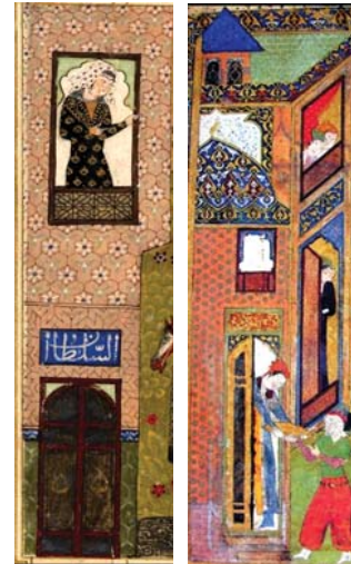
تصاویر ۲۹ و ۳۰. عمارت کوشک و اندرونی، از راست به چپ: نگاره‌های ۱۳. و نگاره ۶.

گیاهان و نظام کاشت: گیاهان در باغ ایرانی با اهداف مختلف کاشته می‌شود که می‌توان به استفاده از محصول، تزیین باغ، ایجاد سایه، تأکید بر محور اصلی، چشم انداز و