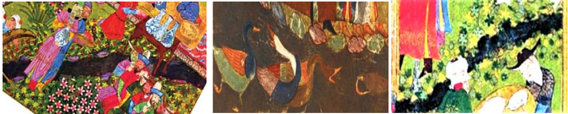
تصاویر ۱۶ و ۱۷ و ۱۸ از راست به چپ: نهرهای مربوط به نگاره ۶. مأخذ: آژند، ۱۳۸۷: ۲۶۷ و نگاره ۹. مأخذ: شایسته فر، ۱۳۷۹: ۷۳ و نگاره ۱۱. مأخذ: تنهایی، ۱۳۸۷: ۱۰۱