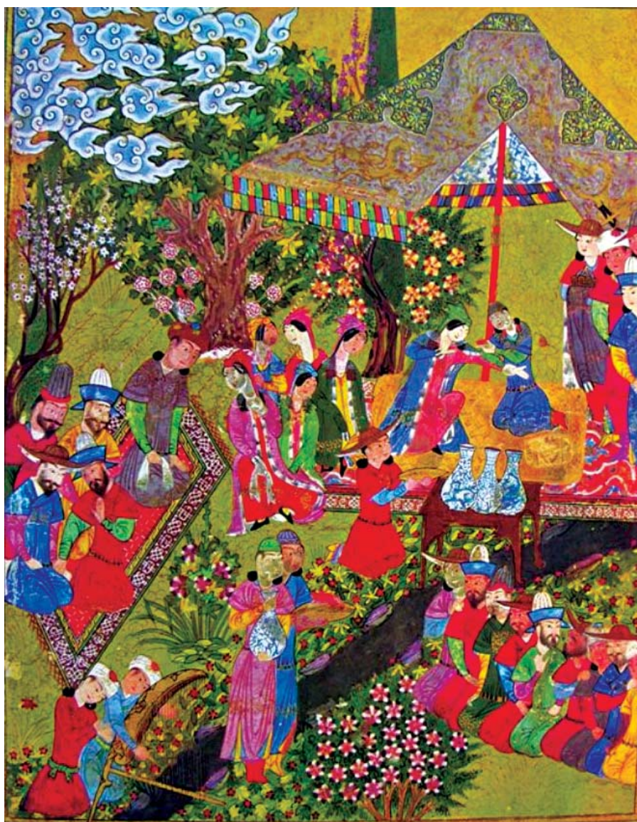
شاهنامه شیراز، سرلوح ۲ برگی ضیافت در گلگشت، مأخذ: تنهایی (۱۳۸۷:۱۰۱)