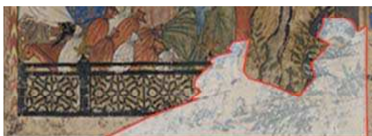
تصویر ۱. آمدن انوشیروان نزد بزرگمهر، شاهنامه بزرگ، نگارخانه فریر واشنگتن دی.سی