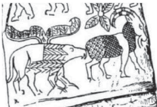
تصویر ۳. نقشمایه گریفین به دست آمده در حفريات جبل التعريف، مصر.