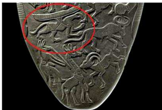
تصویر ۲. نقشمایه گریفین به دست آمده در حفريان نخب، مصر، مأخذ: URL9

(Moortgate, 1940: 126). پرسش بسیار مهم در رابطه با گریفین در واقع در باب واقعی یا افسانه‌ای بودن این موجود است، (جابر انصاری، ۱۳۸۷: ۱۰۰). آدرین مایر ۲ ، احتمال وجود جانوری با ویژگی‌های فیزیکی گریفین را ممکن می‌داند. بخشی از مطالعات او بر کشفیات زیست‌شناسانه مبتنی است و ضمناً تلاش دارد تا بر اساس این مطالعات، اسطوره‌های یونان و رم را توضیح دهد (همان: ۱۰۰). او در این رابطه کتابی به رشته تحریر در آورده است. فصل اول کتاب به گریفین اختصاص دارد. مایر در این فصل یک نوع دایناسور کوچک شاخ‌دار به نام Protoceratops ۳ را معرفی می‌کند که از نظر او با گریفین ارتباط و شباهت‌های فیزیکی دارد. این دایناسور از راسته شاخ‌چهرگان است و مایر این ویژگی را با فرم شاخ‌مانندی که بر روی سر گریفین‌های غربی اضافه شده، مرتبط می‌کند. اگرچه این نوع دایناسور بالدار نیست اما مایر اضافه کردن تخیلی بال‌ها را به Protoceratops نتیجه فرآیند اساطیری شدن آن و تولد نقش‌مایه گریفین می‌داند (Mayor, 2000: 17).