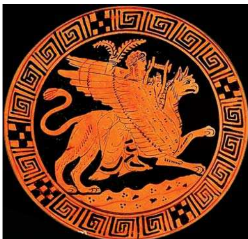
تصویر ۱۹. تصویر آپولو سوار بر پشت گریفین، نقاشی سرخ‌گون بر روی سفال، قرن پنجم قبل از میلاد، یونان