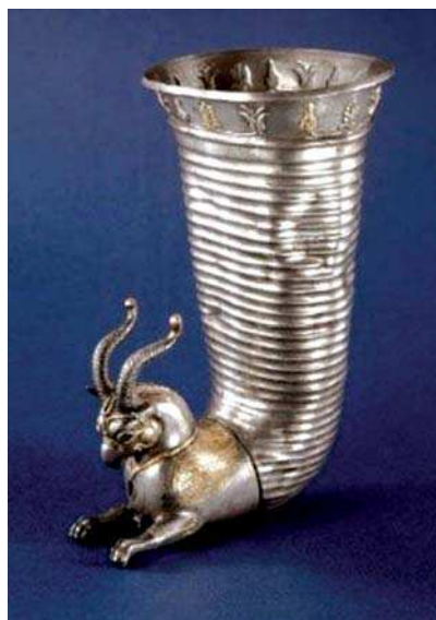
تصویر ۸. ریتون با پیکره انتهایی به شکل گریفین، دوره هخامنشی

۲۴۳) اما از دوره اشکانی گربه وحشی جایگزین شیر می‌شود و حتی شیوه‌های بازنمایی آن تغییر می‌یابد. در دوره ساسانی شدت تغییرات بسیار بیشتر است و شکل گریفین از ترکیب انواع متنوع گربه‌سان‌ها و یا حیوانات درنده‌ای با دم بسیاری از پرندگان ساخته شده است. شکل و فرم گریفین در یونان تنوع و تغییر شکل حاکم بر تصویر گریفین در ایران را در نمونه‌های یونانی نمی‌توان مشاهده نمود. نمونه‌های میسنی با نمونه‌های یونانی تفاوت چندانی را از لحاظ شکل و ساختار نشان نمی‌دهند، در حالی‌که در ایران نقش‌مایه گریفین نه تنها به مرور دچار تغییرات بسیاری در اجزاء و شیوه نمایش می‌شود بلکه نقوش جدیدی مثل سیمرخ نیز از آن متولد می‌شوند. به نظر می‌رسد هنرمندان یونانی این موجود را تنها به عنوان حیوانی اساطیری پذیرفته، مجذوب ترکیب رازآلود آن شده‌اند. ترکیب‌های این موجود در اغلب موارد یک حیوان گربه‌سان را با سر عقاب نمایش می‌دهند که زبانی بلند و کشیده دارد. این زبان بلند جز در چند نمونه محدود مربوط به دوره اشکانی، در ایران دیده نشده و احتمالاً به تأثیرات هنر هلنی بر هنر اشکانی مرتبط است. به همین ترتیب استفاده از شاخ، آن‌طور که در ایران متداول است در نمونه‌های یونانی هرگز مورد توجه قرار نگرفته است.