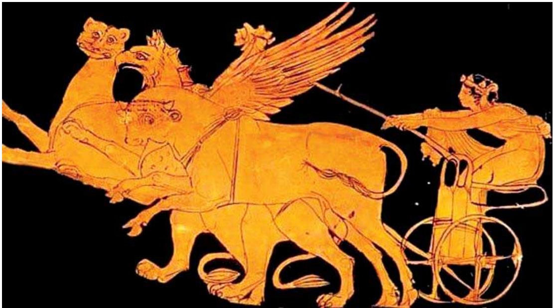
تصویر ۲۰. نقاشی گریفین به شیوه سرخ‌گون بروی سفال، گریفین ارا به دیونیسیوس رامی کشد، قرن پنجم قبل از میلاد، یونان

بازنمایی گریفین متنوع هستند و بر اساس مطالعه حاضر، گریفین در هشت الگوی ثابت و متفاوت بازنمایی شده است که عبارتند از: