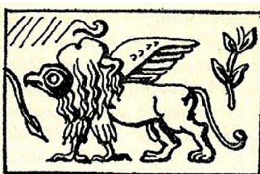
تصویره قدیمی‌ترین نمونه گریفین عیلامی

«سیمرغ» نیز دیده می‌شوند. در حقیقت، در اغلب موارد به جز دم بلند و پرپشت شبیه به دم طاووس نمی‌توان وجه تمایز دیگری میان نقش شیر دال‌ها و سیمرغ‌های ساسانی قائل شد (تصاویر ۱۲ - ۱۰).