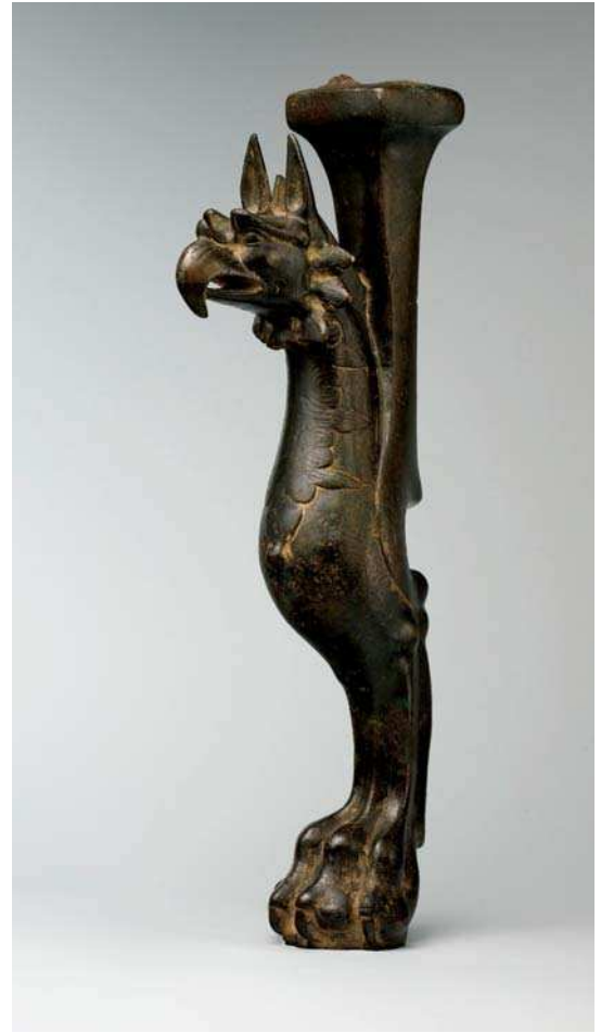
تصویر ۱۰. پایه تخت به شکل گریفین، دوره ساسانی، مأخذ: Pope, 1958: pl. 15

گریفین در صفت‌هایی چون پادشاهی و سلطنت، محافظت و نگهداری با نمادها و مفاهیم مرتبط با عقاب ارتباط می‌یابد. "عقاب نماد همه ایزدان آسمان، خورشید نیمروزی، اصل روحانی، معراج، رهایی از بند، پیروزی، سلطنت، اقتدار و رفعت است." (هال، ۱۳۸۳: ۲۳۵-۲۳۱). عقاب در ایران نماد کهنی است و در ایلام مظهر - این شوشیناک - خدای حامی شوش بود. عقاب در دوران باستان، سمبل قدرت و فرّ پادشاهی بوده است. هخامنشیان عقاب را نشانه اقتدار و توانایی و مظهر جلال و عظمت می‌دانستند و پرواز این پرنده بزرگ و قوی را به فال نیک می‌گرفتند (صراف، ۱۳۸۷: ۶۳-۵۲). این صفت‌ها را بایستی به نقش‌مایه گریفین نیز متعلق دانست چراکه بر روی مهرهای ایلامی و هخامنشی گریفین به همراه پادشاه و در مضمون‌های ویژه او (جنگ، نیایش، مهار حیوانات) همراه با پادشاه یا ناظر بر اعمال پادشاه است. (Schmidh, 1957: 110-125) ترکیب دائمی عقاب در نقش‌مایه گریفین حتی پس از دوره