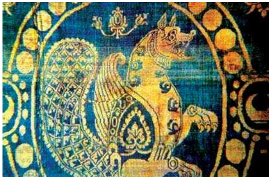
تصویر ۱۲. نقش پارچه به شکل گریفین و یا سیمرخ، دوره ساسانی، مأخذ: Pope, 1958: pl. 256