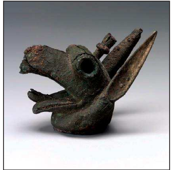
تصویر ۱۶. سردیس فلزی گریفین حدود قرن هفتم ق.م، یونان.

بود» (همان: ۵۷). استفاده از شاخ به عنوان نشان الوهیت از دیرباز در ایران و بین‌النهرین متداول بوده است. مجموعه نیروهای نسبت داده شده به گریفین همچون نیروی حمایت‌کننده و نگهبان، در کنار صفت‌هایی مانند قدرتمندی، وفاداری، نجابت و شرافت را نبایستی تنها ویژگی‌های این موجود دانست. در برخی اسطوره‌ها و روایت‌ها، نیروهای شر را نیز به این حیوان نسبت داده‌اند. به طور مثال در حماسه بابلی انوما الیش ۱ . در این اسطوره مردوک ۲ (خدای پهلوان) با دیوان پیر (تیامات ۳ ) مبارزه می‌کند. جانوران خیالی شبیه به گریفین در جنگ میان مردوک و تیامت حضور دارند. در برخی نقوش به دست آمده و مربوط به این حماسه، صحنه جنگ مردوک با جانوری که نیمی شیر و نیمی عقاب است، نشان داده شده است (مک کال، ۱۳۸۶: ۹۱).