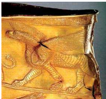
تصویره. نقشمایه گریفین بر روی بخشی از جام مارلیک. مأخذ: نگهبان، ۱۳۷۸: ۹۸.