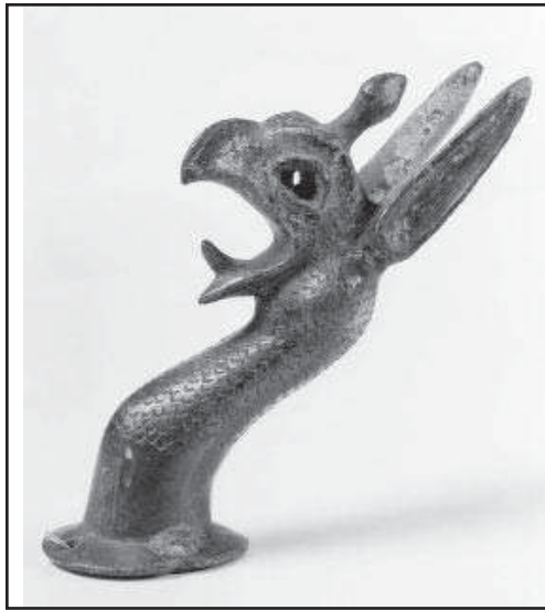
تصویر ۱۷. سردیس فلزی گریفین حدود قرن هفتم ق.م، یونان.