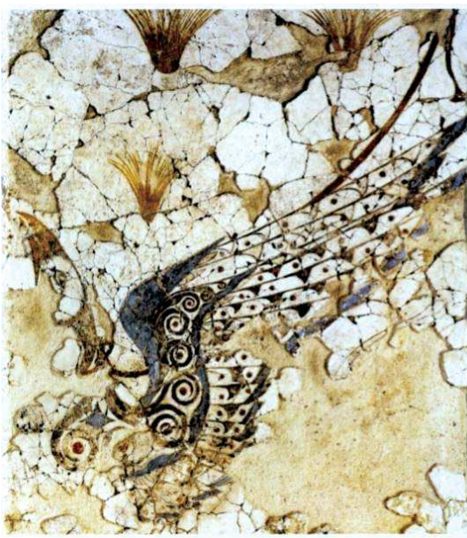
تصویر ۱۳. تصویر بال گریفین که بر روی دیوار یک کاخ در میسن نقاشی شده است.

به همان اندازه که مفاهیم نمادین مرتبط با عقاب، در حیوان گریفین تجلی می‌کند، شیر نیز، سطح وسیعی از مفاهیم نمادین را به این حیوان می‌دهد. شیر در ایران با نماد خورشید ارتباط دارد. صفات این حیوان به قدری اهمیت داشته که بدون هیچ تردیدی آن را نماینده کامل خدای خورشید و پادشاه به کار برده‌اند، (جایز، ۱۳۸۰: ۷۸-۷۵). در بندهش شیر در گروه "گرگ‌سردگان" در کنار جانورانی مانند ببر و پلنگ قرار می‌گیرد که به آن‌ها کوتاه‌تاز می‌گویند (بندهش، ۱۳۹۷: ۱۰۰). در طول زمان انواع گربه‌سانان همچون گربه وحشی و ببر جایگزین شیر در نقش‌مایه گریفین می‌شوند.