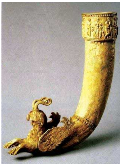
تصویر ۹. ریتون با پیکره انتهایی به شکل گریفین، دوره اشکانی