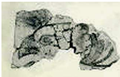
تصویر ۱۴. نقاشی سریک گریفین در نقاشی‌های دیواری دوره میسنی