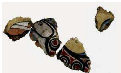
تصویر ۱۵. بخش‌هایی از یک نقاشی فرسک با نقش گریفین، دوره میسنی. مأخذ: Morgan, 2010: 320