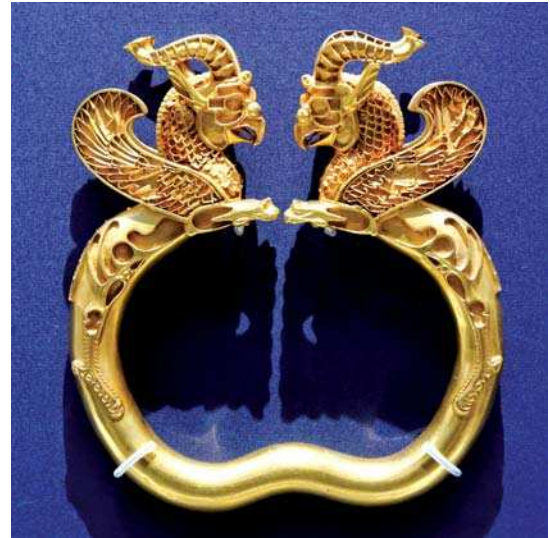
تصویر ۶. بازوبند طلا با تزیین گریفین، دوره هخامنشی، مأخذ: Pope, 1958: pl. 182

آن‌ها محسوب می‌شدند. یک نمونه از این ظرف‌ها از یک مقبره در سالامیس ۱ قبرس به دست آمده است (Osborn, 1998: 42-48). به مرور زمان طی قرن هفتم و پس از آن، نفوذ هنر شرقی و نقش‌مایه‌های این سنت در هنر یونان بیشتر شد. این تأثیر بر نقش‌مایه گریفین به صورت استفاده از این نقش‌مایه بر روی سفال‌های شرق یونان و نیز سفال‌های کرنتی نمود پیدا می‌کند. در مواردی حتی بر روی جواهرات نیز از این نقش‌مایه استفاده شده است (ibid: 65). بر روی سفالینه‌های یونانی که در شیوه‌های سرخ‌گون و سیاه‌گون تزیین شده‌اند، نقش‌مایه گریفین بسیار استفاده شده است (تصاویر ۲۰-۱۹). ارتباط گریفین با آپولو و نیز آتنا و دیونیسوس سبب شده تا این موجود اسطوره‌ای را در کنار نقش این خدایان بر روی سفالینه‌ها نقاشی کنند. گریفین به‌عنوان یکی از گرداندگان ارابه دیونیسوس و یا آپولو نمود پیدا می‌کند. آپولو را می‌توان سوار بر پشت گریفین مشاهده نمود و سپر آتنا نیز با نقش‌مایه گریفین تزیین شده است. جنگ گریفین با موجودات دیگر و یا حمله او به حیواناتی مثل اسب نیز از جمله مضامین مورد توجه بر روی این سفال‌ها محسوب می‌شود (تصاویر ۲۰-۱۹).