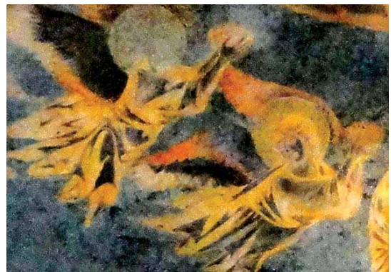
تصویر ۱۰. «بدر آویختن مسیح (ع)»، (فرسکو)، باسیلیکای فوقانی دیرسان فرانسیسکو، سیمابونه، نیمه قرن ۱۳ م

دینی - به خصوص وقایع زندگانی حضرت محمد (ص) - مورد توجه ویژه‌ای قرار گرفت و در عهد شاهرخ میرزا، معراج‌نامه پرآوازه تیموری در مکتب هرات به تصویر کشیده شد. کمیت حیرت انگیز مجالس نسخه مزبور با ساختار یکسان در ترکیب متقارن عوامل بصری، بدون تردید در زمره یکی از شاهکارهای هنر جهان اسلام است. از جلوه‌های درخشان معراج‌نگاری می‌توان به نسخه‌های خطی دوران آل جلابر به بعد - به ویژه در عهد صفویان - به دیوان‌های مصور شاعرانی همچون نظامی، امیرخسرو دهلوی، جامی و در کتاب‌های مصور مانند قصص الانبیا، فالنامه و معراج‌نامه اشاره کرد (شین دشتگل، ۱۳۸۹: ۷۰). در دوره‌های مختلف توجه به جلوه‌های خاص و ترسیم جزئیات تصویری، سبب تنوع هرچه بیشتر نقاشی معراج پیامبر (ص) متناسب با محیط جدید کتاب آرایه اعصار مختلف و سلیقه حامیان واقع شد.