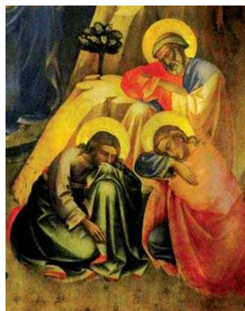
تصویر ۶. بخشی از تصویر ۲، مأخذ: www.scalararchives.it