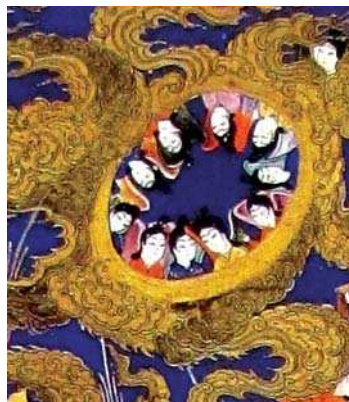
تصویر ۱۵. بخشی از تصویر ۱۱.

جبرئیل و سایر فرشتگان، براق و آسمان است. البته نحوه حضور این عناصر بر حسب هر فراز داستان بنا بر روایات مختلف تغییر می‌کنند و پر رنگ تر و کم رنگ می‌شوند. از سایر عناصر تصویری می‌توان به حضور یاران پیامبران، ابر، هاله تقدس، زمان وقوع ماجرا و غیره اشاره نمود. نمایش حضرت محمد (ص) و عیسی (ع) در این آثار به گونه‌ای است که بیانگر مقام معنوی آنها است و هنرمندان برای تاکید بر مقام و جایگاه والای این دو بزرگوار، آنها را نسبت به سایرین بزرگ تر و بر فراز ابرها و در میان فرشتگان ترسیم نموده‌اند. چنانکه در اکثر نگاره‌های ایرانی و مسیحی با این موضوع، تصویر مرکزی، پیامبر (ص) یا مسیح (ع) است که در کانون توجه مخاطبان واقع شده است. البته در نقاشی‌های مسیحی بنا بر روایات مختلف از اناجیل مسیحی نحوه عروج حضرت (ع) متفاوت است. اکثر نگاره‌های مسیحی صحنه عروج عیسی (ع) را در فضای باز: