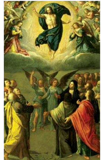
تصویر ۲۴. «عروج مسیح (ع)»، جیرولامو موزیانو، نیمه اول قرن ۱۶، مأخذ: www.progettocultura.intesasanpaolo.com

۱. وسیکا پیسکیس (عیسی مسیح، ماهی مسیح و ماندورلا). این نماد تاریخی غیر معمولی دارد. امروزه به اعضای مذهب مسیحی دلالت دارد. در مسیحیان اولیه از این نماد استفاده می‌کردند و معنای لغوی آن در یونانی، به معنای ماهی است. «عیسی مسیح، پسر خدا یا نجات دهنده» آنها این اصطلاح رمزی را در مسیحیت برای عیسی بکار می‌بردند، زیرا وی قادر است در ژرفای فناپذیری بدون گناه باقی بماند، همانطور که ماهی می‌توانست در اعماق دریا زندگی کند و زنده بماند (پایگاه فرهنگ تصویری نمادهای مذهبی) این نماد جزو نمادهای فیثاغورثی محسوب می‌شود.