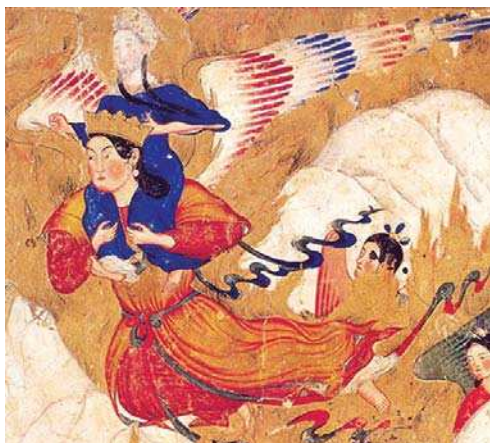
تصویر ۷. «حضرت محمد (ص) بر دوش جبرئیل بر فراز کوه‌های عجیب»، معراجنامه احمد موسی، قرن ۱۴م، مأخذ: کتابخانه توپقاپی سرای استانبول

مطالعه تطبیقی نگاره‌های معراج حضرت محمد (ص) و نقاشی‌های عروج حضرت عیسی (ع)