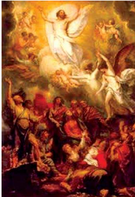
تصویر ۲۲. «عروج مسیح (ع)»، بنجامین وست، نیمه دوم قرن ۱۸ و اوایل ۱۹ م.