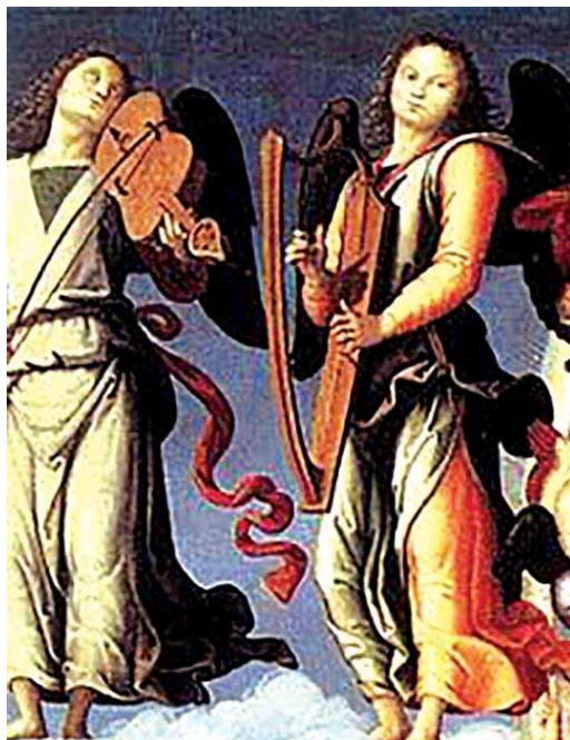
تصویر ۲۰. «عروج مسیح (ع)»، (فرسکو)، پیتر و پروجینو، نیمه اول قرن ۱۵م.