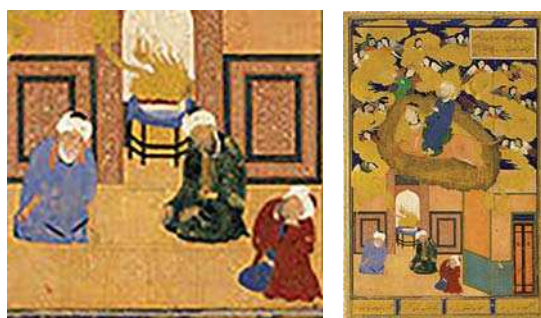
تصویر ۵، «معراج پیامبر (ص)»، بوستان سعدی، نیمه اول قرن ۱۶م، مأخذ: موزه متروپولیتن.

ج ۳، ص ۲۰۷؛ ج ۵؛ ۱۳۲). بر اساس روایات اسلامی، در شب عروج عیسی (ع) در مقابل یارانش از زاویه خانه به طرف آسمان بالا می‌رود و ناپدید می‌شود (قمی، ۱۴۱۲ق، ج ۱؛ طباطبایی، ۱۴۱۷ق، ج ۳: ۲۱۸) و پس از چند روز برمی‌گردد (نویری، ۱۳۶۵، ج ۹: ۳۲۷-۳۲۶) و بین زمین و آسمان قبض روح می‌شود، بعد به آسمان می‌رود و دوباره روحش به بدنش باز می‌گردد (مجلسی، ۱۳۶۲، ج ۱۴: ۳۳۹-۳۳۸) و برخی معتقدند در حال دویدن باد او را به آسمان می‌برد (رازی، ۱۳۸۱، ج ۴: ۳۵۴).