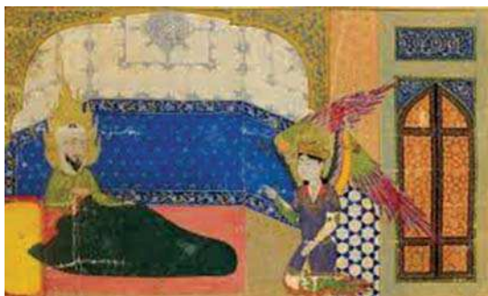
تصویر ۱. «ظهور جبرئیل در خوابگاه پیامبر (ص)». معراجنامه میرحیدر، نیمه اول قرن ۱۵ م.

این پژوهش بر اساس ماهیت و روش از نوع توصیفی تحلیلی و با رویکرد تطبیقی و با استفاده از مطالعات کتابخانه‌ای و مشاهده آثار بوده است. در ابتدا با مراجعه به متون نحوه عروج حضرت محمد (ص) و عیسی (ع) بررسی شده، سپس بر اساس اهداف پژوهش تصاویر انتخابی مشابه از این دو سبک نگارگری ایرانی و نقاشی مسیحی با مضمون معراج از لحاظ عناصر تصویری (پیکره پیامبر (ص)، عیسی (ع)، فرشتگان، براق، آسمان، ابر، هاله تقدس) و ساختاری (نحوه نمایش موقعیت این پیامبران در تصویر و نسبت به سایرین) مورد مطالعه قرار