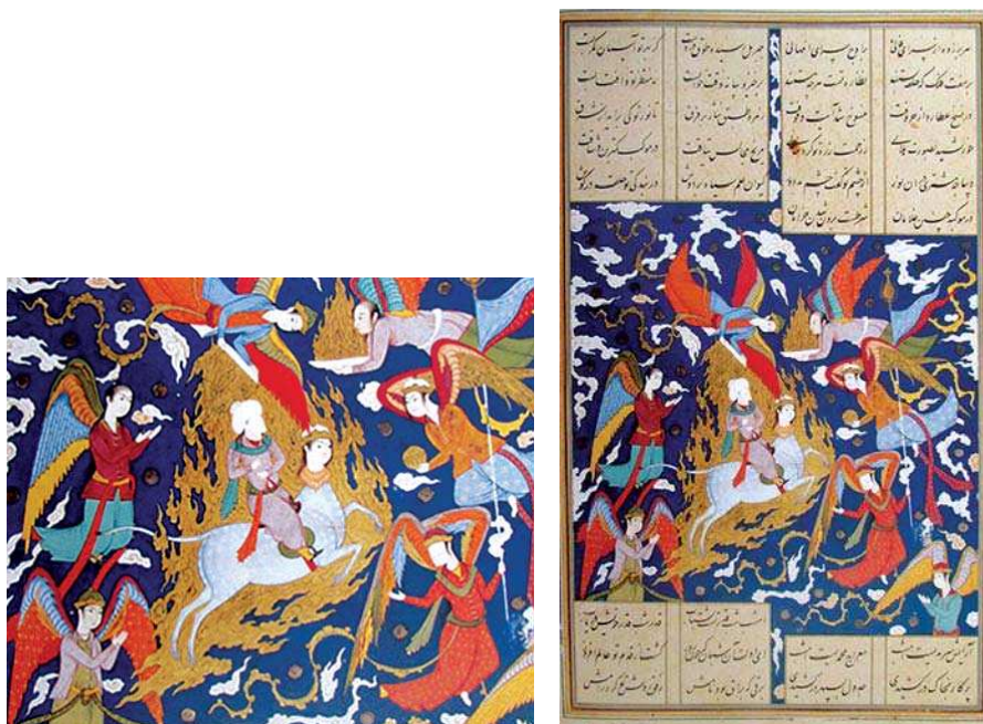
تصویر ۲۳. «معراج پیامبر (ص)»، شرف‌نامه نظامی، اوایل قرن ۱۷ م، مأخذ: کتابخانه ملی فرانسه.

فرشتگان در گروه‌های چندتایی یا انفرادی گرداگرد پیامبر ترسیم شده‌اند و مشغول تماشای وی هستند. شاخصه مشترک و مهم این دو نگاره، که نسبت به سایر نگاره‌های معراج حضرت محمد (ص) و عیسی (ع) وجود دارد، نمایش فرشتگانی است که در پشت پنجره‌ای در آسمان با هم جمع شده‌اند و نظاره‌گر عروج این رسولان الهی هستند. احتمالاً ترسیم پنجره‌ای بر آسمان، مبین ورود حضرت رسول (ص) به آسمان اول است که فرشتگان زیادی با چهره‌های شاداب به استقبال ایشان آمده‌اند (طباطبایی، ۱۴۱۷ق، ج ۱۹).