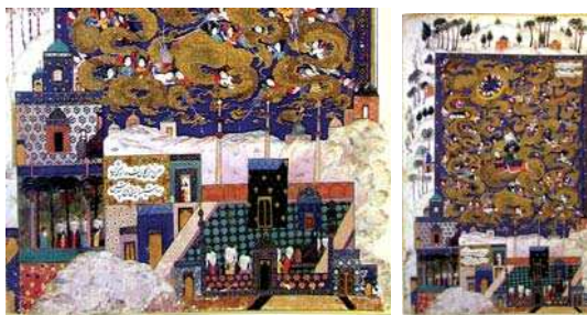
تصویر ۱۱. «معراج پیامبر (ص)»، مخزن الاسرار نظامی، اوایل قرن ۱۶م، مأخذ: مجموعه کی‌یر.