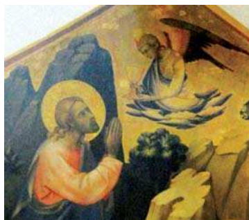
تصویر ۴، بخشی از تصویر ۲، مأخذ: همان.