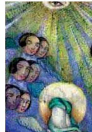
تصویر ۱۷. «معراج پیامبر (ص)»، خسرو و شیرین دشتی، قرن ۱۸م، مأخذ: کتابخانه مجلس.