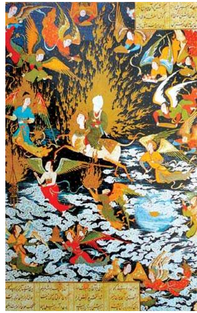
تصویر ۲۱. «معراج پیامبر (ص)»، هفت پیکر نظامی، نیمه قرن ۱۶ م.

پایینی توسط شخصیت اصلی صورت گرفته است و حضرت محمد (ص) و عیسی (ع) در کادر بالایی و در مرکز تصویر به نمایش درآمده اند (تصاویر ۱۱ و ۱۲). در هر دو اثر، نحوه قرار گرفتن عروج کننده نسبت به افرادی که در پیش زمینه آنها نشان داده شده اند، از ترکیب مثلثی شکل تبعیت کرده و «این نوع ترکیب بندی به بهترین وجه به بیان بصری شأن و مرتبه والاتر شخصیت اصلی می پردازد.» (جوانی، ۱۳۹۲: ۶۳) از سایر خصوصیات مشترک این دو نگاره به نمایی از شهر در آنها می توان اشاره کرد. در نگاره معراج، پیامبر (ص) سوار بر براق در میان خیل فرشتگان و ابرهای پیچان و گسترده بر فراز شهر مکه به نمایش درآمده است و طرح ساده ای از کعبه و مناره ها و صحن مسجدالحرام با کاشی کاری های ظریف و رنگارنگ که زائری در آنجا وجود دارند، مشاهده می گردد. علاوه بر این در پس زمینه نگاره و گرداگرد صحنه عروج پیامبر (ص)، ترسیم خانه های ساده با گنبد های کوچک در میان صخره های روشن با درختان کاج و نخل به محل و مسیر عبور حضرت (ص) از مسجدالحرام و بیابان ها را نشان می دهد. همچنان که در نگاره عروج عیسی (ع) بر فراز کوه زیتون، نمایش منظره ای از شهر در پس زمینه آن، مبین مبدا سفر آسمانی ایشان است.