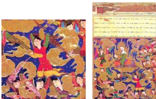
تصویر ۹. «پیامبر (ص) سوار بر براق در راه اورشلیم»، معراجنامه میرحیدر، نیمه اول قرن ۱۵م، مأخذ: کتابخانه ملی پاریس.