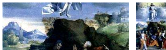
تصویر ۱۳. «عروج عیسی (ع)»، بندتوتی سی، نیمه اول قرن ۱۶م.