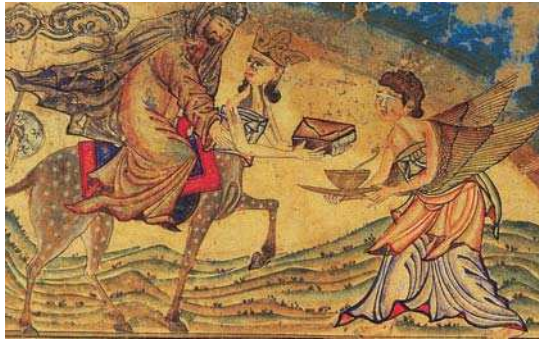
تصویر ۳. «معراج پیامبر (ص)». جامع التواریخ رشیدی، اوایل قرن ۱۴م

به این تفکر و داشته است که چگونه می‌تواند پیش از مرگ به دنیای خدایان راه یابد و اسرار و رموز آن را کشف نماید. این آرمان موجب شد تا در هر منطقه و در میان هر قوم و قبیله‌ای از جمله کیش هندو، یونانی و مزدایی مجموعه‌ای از باورها و آیین‌ها برای عروج به عوالم ماورائی بنیان گذاشته شود و انسان به واسطه این آیین‌ها، خود را در دنیای خدایان سهیم بداند» (دهقان، ۱۳۹۰: ۹۲). عروج و ملاقات‌های هفتگانه زردشت با اهورامزدا و امشاسپندان، عروج گشتاسپ، عروج کرتیر- وزیر شهیر دوره ساسانی - و عروج ارداویراف نمونه‌هایی از این اندیشه در کیش ایرانی هستند (تفضلی، ۱۳۷۶: ۳۴) در ادیان الهی نیز عقیده به عروج به ماوراء ماده یا معراج وجود داشته است؛ ولیکن درباره جزئیات و چگونگی آن در میان آنها اختلاف نظر است. برخی نشان دادن ملکوت آسمان‌ها و زمین به حضرت ابراهیم (ع) و میقات موسی (ع) با پروردگار را معراج ایشان دانسته‌اند. در عهد عتیق و جدید نیز سفر روحانی برخی از پیامبران بنی اسرائیل مانند سفرهای ایلیا، حزقیل، اشعیا به آسمان و یا سفر روحانی پولس رسول به آسمان سوم و یا عروج ادریس در یهودیت جزو معراج‌ها آمده است (رضایی، ۱۳۹۱: ۱۴۱)، اما هیچ یک از اینها مشابه معراج پیامبر (ص) و عروج عیسی (ع) نمی‌باشد، چرا که معراج آنها صرفاً به یک سفر روحانی خلاصه نمی‌شود، بلکه بر اساس آیات و روایات عروج این دو بزرگوار عروج جسمانی و روحانی تواما است. به نظر کوپر، معراج «مظهر استعلاء، عبور از موانع و رسیدن به سطح هستی‌شناسانه جدید و برتری جستن از قلمرو انسانی صرف، راهی به سوی وجود حقیقی و هستی مطلق، یگانگی مجدد، اتحاد جان با الوهیت، صعود جان، گذر از زمین به آسمان، از تاریکی به روشنایی و آزادی است.» (کوپر، ۱۳۸۰: ۳۵۳)