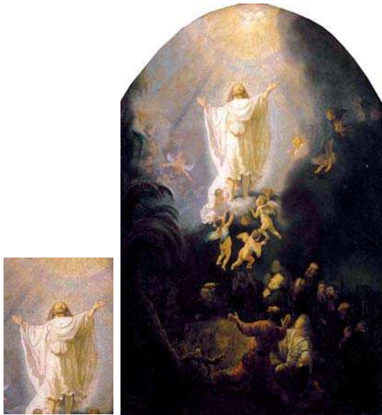
تصویر ۱۸. «عروج عیسی (ع)»، رامبرانت، نیمه اول قرن ۱۷م