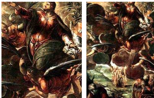
تصویر ۸. «عروج مسیح (ع) بر دوش فرشتگان» تینتورتو (یاکوپو روسنتی)، قرن ۱۶م، مأخذ: www.stream.org

بالاترین شکل خود در ادوار تیموری و صفوی نایل گشت (ریاضی، ۱۳۷۵: ۲۲۰). در این دوران‌ها هنر و مذهب در ایران به صورت نزدیکی با هم مرتبط شده و کتاب آریایی نسخ مذهبی افزایش می‌یابد. اما نشانه‌های نگارگری دینی از اوایل قرن هفتم هجری با وجود مخالفت بعضی از علمای دین پدیدار شد و نقاشان به ترسیم برخی از صحنه‌های دینی فراخوانده شدند و این فراخوانی، هنرمندان را به نقش کردن چهره پیامبر (ص) ترغیب ساخت (عکاشه، ۱۳۸۰: ۱۰۷). از قدیمی‌ترین نسخه‌هایی که به مصورسازی معراج پیامبر (ص) پرداخته است به نسخه جامع التواریخ رشیدی می‌توان اشاره کرد. پس از آن تصویرگری معراجنامه‌ها منظوم و منثور ساخته شده از عهد ایلخانیان مورد توجه و حمایت شاهان واقع شد. نگاره‌های احمد موسی (نقاش برجسته دوران ابوسعید ایلخانی) با توجه به جهت‌گیری مذهبی و کیفیت معنوی در ترکیبات بدیع نگاره‌های او، نقطه اوج پیشرفتی است که به طور یقین باورهای دینی مسلمانان را به طرز شایسته‌ای به تصویر کشیده است. در زمان تیموریان نیز، گرایش به سمت تصویرگری مضامین