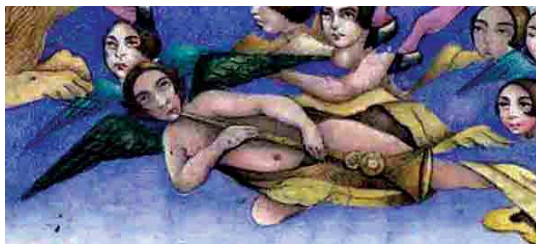
تصویر ۱۹. بخشی از تصویر ۱۷.

در آسمان‌ها و یا باغ جستیمانی و بر فراز کوه زیتون و در حضور جمعیت و فرشتگان به نمایش گذاشته‌اند ۱ . نگاره‌های معراج نیز سیر شبانه حضرت (ص) را در آسمان‌ها و در جمع فرشتگان به تصویر کشیده‌اند، ولیکن در برخی موارد که مربوط به بخش اول معراج - سیر از مسجدالحرام به مسجدالقصی - است، پس زمینه‌ای از شهر مکه و کوه‌های اطراف مشاهده می‌شود.