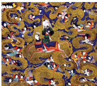
تصویر ۱۲. بخشی از تصویر ۱۱، مأخذ: www.harvardichthus.org