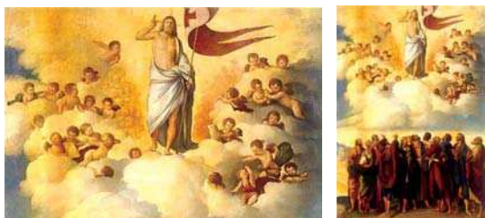
تصویر ۱۴. «عروج عیسی (ع)»، دوسو دوسی، نیمه اول قرن ۱۶م، مأخذ: www.bigli.com .