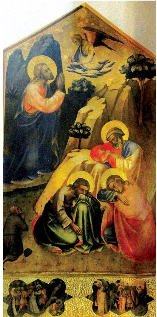
تصویر ۲. «آلام مسیح در باغ جستیمانی»، (تمپرا روی بوم چوبی)، لرنزو ماناکو، قرن ۱۴م

معراج پیامبر (ص) از مفاهیم بنیادین فرهنگ اسلامی