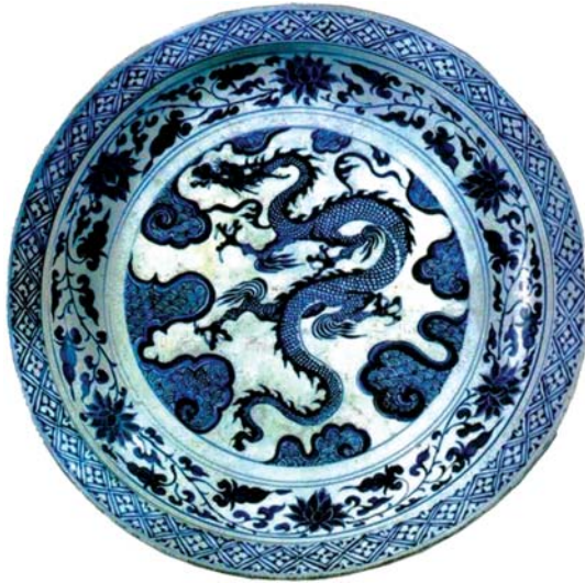
تصویر ۲۰- بشقاب آبی- سفید با نقش اژدهای سه پنجه واقع در موزه ملی ایران، ماخذ: نفیسی، ۱۳۸۴