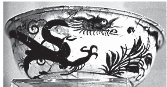
تصویر ۱۰- کاسه خمیر شیشه دوره تیموری با طرح اژدها، ماخذ: موزه برلین

در کنار این عوامل از آن جا که تیموریان از تبار