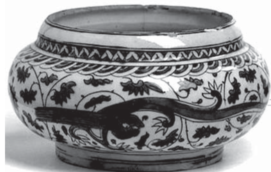
تصویر ۱۲- کوزه دهان گشاد آبی- سفید با طرح‌های تزئینی گل، اژدها، شاخ و برگ‌های طوماری، ماخذ: موزه ویکتوریا و آلبرت