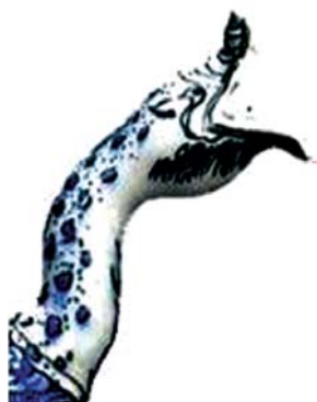
تصویر ۱۶- بخشی از تصویر ۱۵

بزرگ در گرداگرد قطب شمالی دایره البروج تصور شده است. (بیرونی، ۱۳۶۲، ۹۱) نکته جالب این است که بنا بر اسطوره‌های کشورهای مختلف مشرق زمین از جمله ایران، به هنگام خورشیدگرفتگی یا ماه‌گرفتگی، خورشید یا ماه به کام اژدهای فلکی می‌رود (بریور، ۱۳۶۵، ۱۶-۱۷) و بنا به همین اعتقاد در گذشته در ایران، هنگام خورشیدگرفتگی یا ماه‌گرفتگی بر بام خانه‌ها روی طشت می‌زده‌اند تا اژدها، خورشید یا ماه را آزاد کند. (نظامی، ۱۳۷۴، ۲۰۰)