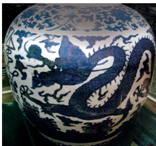
تصویر ۱۸- گلدان آبی- سفید با نقش تزئینی اژدهای بزرگ پنج پنجه در زمینه ابرهای چینی واقع در چینی‌خانه شیخ صفی در اردبیل، ماخذ: نگارنده

از سوی دیگر کاربرد آن توسط هنرمندان ایرانی می‌تواند جنبه‌های نمادین داشته باشد که از ویژگی‌های اصلی هنر اسلامی به شمار می‌رود. از جمله این جنبه‌های نمادین می‌توان به ارتباط این نقش با مفاهیم نجومی اشاره کرد. می‌دانیم که اژدها اسامی دیگر ثعبان یا تنین از صورت‌های فلکی در نیم کره شمالی آسمان است که در مجاورت صورت‌های فلکی دُب اکبر، دُب اصغر، قیفاووس، شلیاق، زرافه، عوّا و جاثی قرار گرفته و به صورت ماری