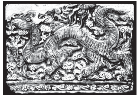
تصویر-۶- کاشی زرین فام با طرح اژدها

نمونه دیگر بشقابی با تزئینات نقش کنده از نوع معروف به ظروف آق کند و متعلق به سده‌های چهار تا پنج هجری است که در موزه طاروق رجب کویت نگه داری می‌شود. نقش تزئینی کف داخلی ظرف دارای سه بازوی مار مانند، مشابه اختاپوس است که انتهای هر یک از این بازوهای حلقه زده به شکل سه چشم درآمده است. (تصویر ۳) این نقش را نیز می‌توان نمودی از اژدهای سه سر دانست که در اساطیر ایران باستان از آن یاد شده است. می‌دانیم برخی از نمونه‌های اژدها در اعتقادات ایرانیان باستان دارای چند (دو، سه، پنج، شش، دوازده و حتی صد) سر بوده‌اند. به ویژه احتمال ارتباط این نمونه خاص با وجود سه سر با اساطیر ایران باستان بسیار زیاد است. زیرا برخی از ایران شناسان سه سر بودن موجود اهورایی یا اهریمنی را