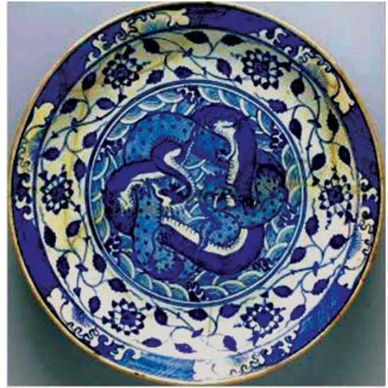
تصویر ۱۳- بشقاب بزرگ آبی- سفید با نقوش دو اژدهای درهم پیچیده

اژدهای ماری شکل ایرانی کاملاً متفاوت است و هیچ شکی در اژدها بودن آن‌ها نمی‌توان داشت. نکته دیگر تفاوت در ابعاد و اندام اژدهای پنج و چهارپنجه با نوع سه پنجه آن است، زیرا همان طور که قبلاً اشاره شد اژدهای پنج پنجه مختص امپراتور، چهار پنجه مختص شاهزادگان درجه یک و اژدهای سه پنجه مختص شاهزادگان درجه دو چینی بوده است. به همین دلیل اژدهای پنج و چهار پنجه با اندام ابعاد بزرگ تری طراحی شده‌اند.