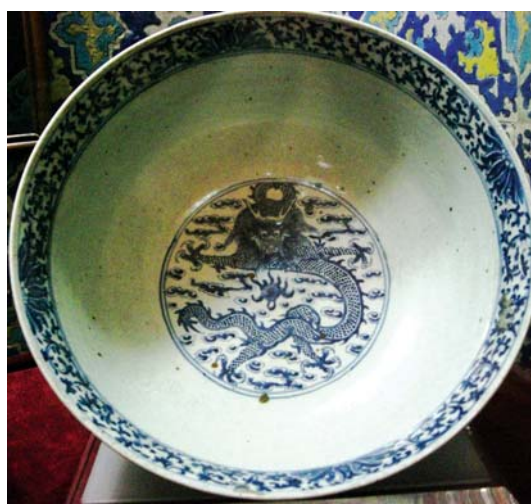
تصویر ۱۷- کاسه آبی- سفید با نقش یک اژدهای چینی چهار پنجه در زمینه ابرهای چینی واقع در چینی‌خانه شیخ صفی در اردبیل، ماخذ: نگارنده