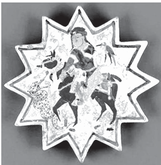
تصویر ۴- کاشی با تصویر نبرد رستم و اژدها در فریر گالری واشنگتن