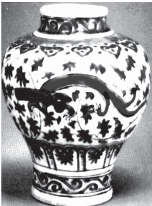
تصویر ۱۱- خمره آبی سفید با نقش اژدها و تزئینات گل و گیاه متعلق به دوره صفوی در موزه هنر توکیو

با توجه به این‌که تعدادی از این ظروف دارای نشان دو تن از سلاطین سلسله مینگ به نام‌های چیاچینگ ۲ (۱۵۶۶-۱۵۲۲ م) و وان-لی ۴ (۱۵۷۲-۱۵۶۷ م) است و از سوی دیگر هنگامی که شاه‌عباس موقوفه خود آستانه اردبیل را بنا نهاد، مصادف با دوران حکومت وان‌لی بود، احتمالاً این