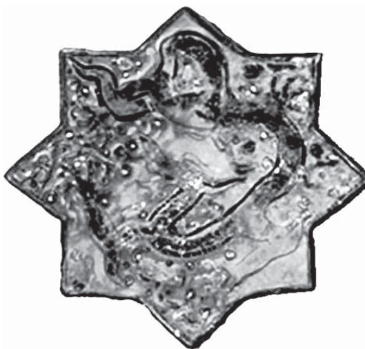
تصویر ۷- کاشی هشت‌پر با نقش اژدها

برادرزاده هلاکوخان یعنی آباقاخان (۶۸۰-۶۶۳ ه.ق) به عنوان قصر تابستانی انتخاب شده بود. کاشی‌های ایلخانی در تخت سلیمان دارای تنوع زیادی است که از مهم‌ترین آن‌ها می‌توان به کاشی‌های زرین فام کتیبه دار و کاشی برجسته‌های زمینه لاجوردی و فیروزه‌ای زرانود اشاره کرد که در تزئین دیوار کاخ‌ها به کار رفته است. نمونه‌هایی از کاشی‌های زرین فام مربوط به محوطه تخت سلیمان با نقش تزئینی اژدها در موزه‌ها و مجموعه‌های مختلف از جمله در مجموعه ناصر خلیلی (تصویر ۵)، مجموعه دیوید دانمارک (تصویر ۶)، موزه ویکتوریا و آلبرت لندن و موزه هنر اسلامی برلین نگه داری می‌شوند. در تمام این قطعات، نقش اژدهایی با بدن فلس دار بلند و به شکل مار با چهار پا، هریک دارای چهارچنگال با سری برگشته به عقب درحالی که از دهانش آتش خارج می‌شود، مشاهده می‌گردد.