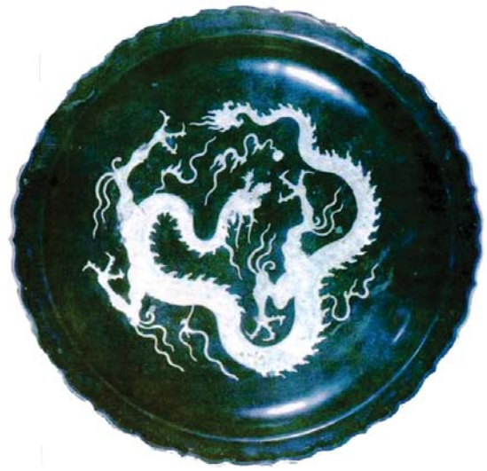
تصویر ۱۹- بشقاب لب کنگره ای با نقش اژدهای سه پنجه واقع در موزه ملی ایران، ماخذ: نفیسی، ۱۳۸۴

با نوع چینی آن می‌توان به طراحی انتزاعی، عدم وجود شعله‌های آتش، وجود نقطه یا خال‌های فراوان بر روی پوست اشاره کرد که می‌تواند در راستای انطباق با مفهوم اژدها در اساطیر و ادبیات ایران باشد.