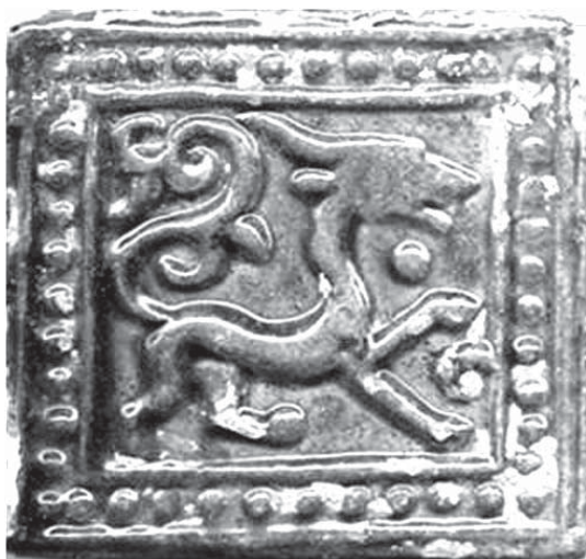
تصویر ۸- کاشی چهارگوش با تزئین قالبی از نقش اژدها، موزه ملی ایران