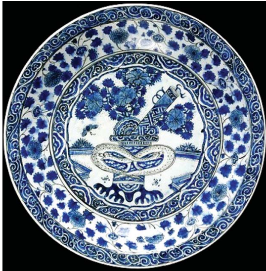
تصویر ۱۴- بشقاب آبی- سفید با نقوش تزئینی درگیری دو اژدها، ماخذ: موزه ویکتوریا و آلبرت