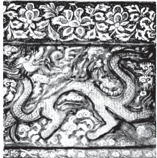
تصویر-۵- کاشی زرین فام با نقش اژدها در مجموعه ناصر خلیلی، ماخذ: Khalili, 2005

نقش اژدها در این جا مشابه اژدهای چینی دارای تنه‌ای باریک و در قالب ماری بزرگ البته فاقد پا و چنگال به همراه پوزه‌ای دراز طراحی شده است. نقش مذکور را می‌توان از نظر مضمون ایرانی و به دلیل مشخصات ترسیم، تاحدودی تحت تاثیر فرهنگ چین دانست؛ زیرا ترکان سلجوقی قبل از ورود به ایران، در سرزمین‌های آسیای مرکزی و در مجاورت کشور چین به سر می‌بردند. باتوجه به همین سابقه مجاورت و تماس، به عقیده بعضی از متخصصان در این عصر، اشکال و روش‌های فنی و تزئینات مختلف به تقلید یا الهام از محصولات چینی دوره سونگ پدید آمده است. (رفیعی، ۱۳۷۷، ۸۳) البته طی این دوره حضور فراوان صنعتگران چینی در برخی از شهرهای ایران از جمله شهر سمرقند (Bretschneider, 1888, 78) نیز تایید شده است.