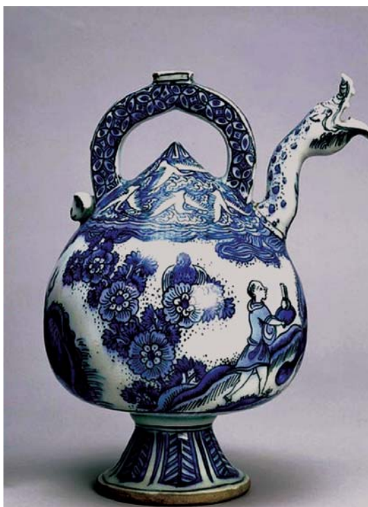
تصویر ۱۵- قوری آبی-سفید صفوی، ماخذ: موزه ویکتوریا و آلبرت

از دیگر جنبه‌های نمادین می‌توان به تجلی مفاهیم عرفان اسلامی همچون نفس آزمند اماره و صفات رذیله ای مانند شهوت و غضب و گاهی هم عالم مادی در قالب این نقش اشاره نمود. (سجادی، ۱۳۷۰، ۸۱) طراحی نسبتاً خشن و زشت نقش اژدها طی این ادوار احتمال این جنبه نمادین را افزایش می‌دهد زیرا بنا بر یک سنت قدیمی، انسان ارزش‌گذار از سپیده دم تاریخ آن چه را نامقدس می‌پنداشته با زشت‌ترین صورت‌ها تصویر کرده است. (محمدی، ۱۳۸۴، ۱۰۴) نکته دیگر تنوع شکلی اژدها در این دوران است که شامل حیوان چهارپای شاخ دار با نیش و چنگال، مار بزرگ