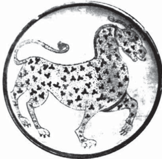
تصویر ۲- کاسه با لعاب سفید مات و نقش کنده در موزه آشمولین آکسفورد، ماخذ: ویلسن آلن، ۱۳۸۷