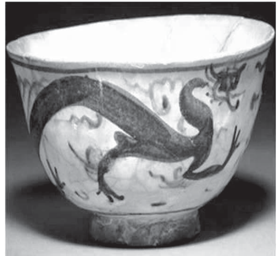
تصویر ۹- کاسه سفالی دوره تیموری با نقش اژدها

باتوجه به آنچه گفته شد درمی‌یابیم نقش اژدها بیش‌تر بر روی ظروف آبی-سفید صادراتی این دوره مشاهده می‌گردد. از جمله نمونه‌های این ظروف می‌توان به خمره‌ای با نقش اژدها و تزئینات گل و گیاه آبی در زیر