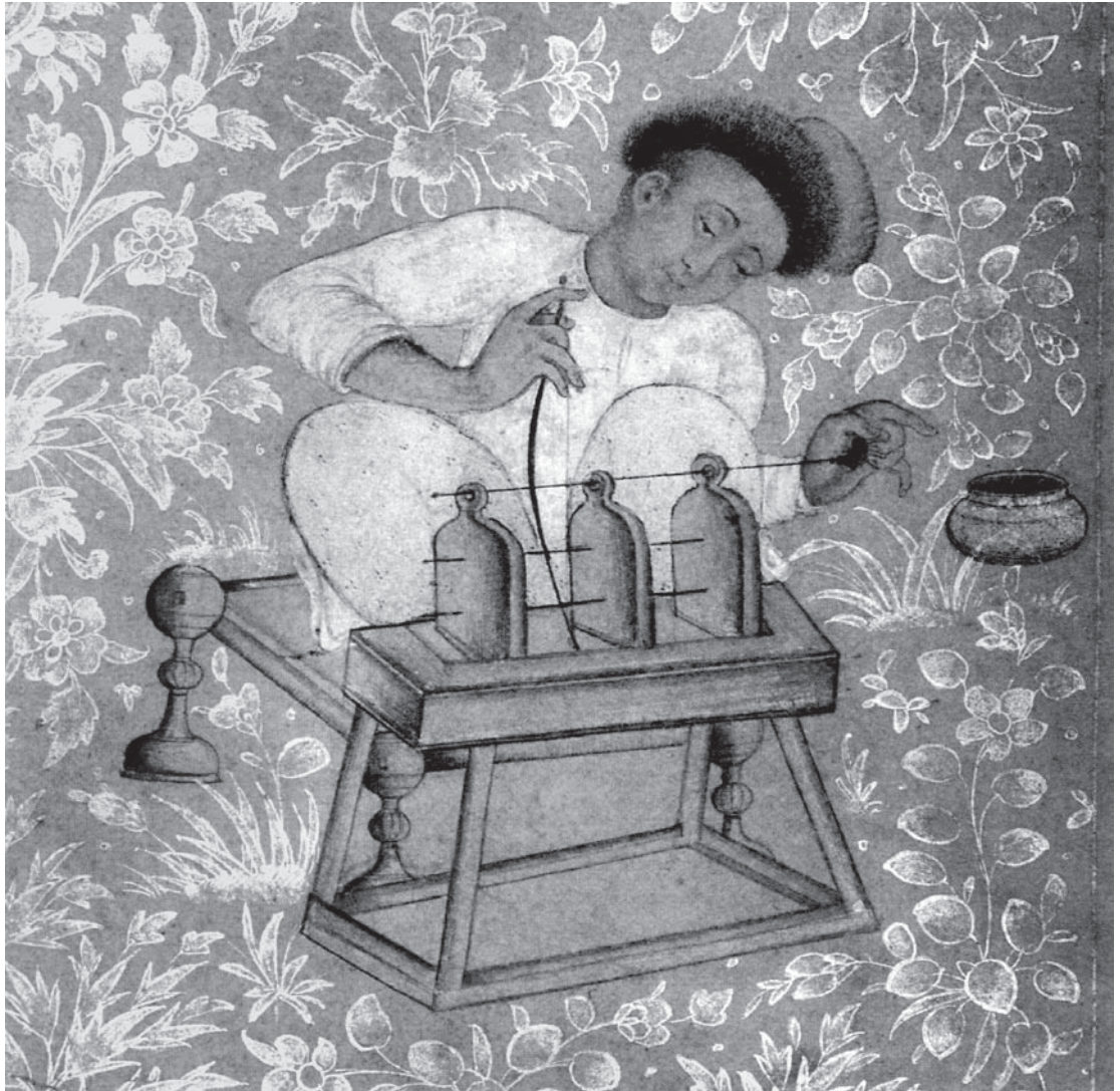
تصویر الف- برگی از یک مرقع به نام جهانگیرشاه گورکانی که در آن شیوه کار با دستگاه حکاکی سنگ‌های قیمتی و نیمه قیمتی نشان داده شده است. ۱۶۲۰، موزه فرهنگ‌های آسیایی، آفریقایی و آمریکایی پراگ، ماخذ: Porter, 2011, 188