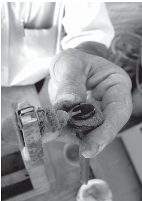
تصویر ۱۰ - چگونگی تماس نگین و تیغه الماسه در حکاکی با دستگاه عقیق‌کن