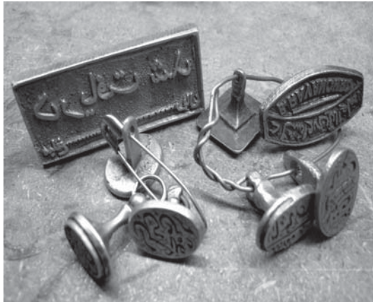
تصویر ۴ - چند نمونه از مُهرهای برنجی عهد قاجار و پهلوی اول، بدنه این مُهرها را غالباً یک تکه می‌ریختند و به شیوه کنده یا برجسته حکاکی می‌کردند، مجموعه خاندان حمیدی حکاک شیرازی، ماخذ: نگارندگان