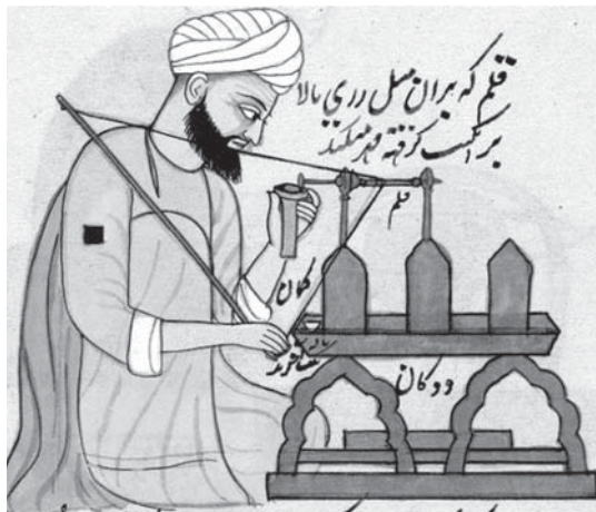
تصویر اب- برگی از نقاشی که یک حکاک کشمیری را در حال حکاکی کردن با دستگاه مخصوص حکاکی سنگ‌های قیمتی و نیمه قیمتی نشان می‌دهد، ماخذ: Gallop and Porter, 2010, 5

بوده است مساحت این صفحه نیز بسته به میزان متن و نوشتار مُهر، ضخامت قلم و سلیقه حکاکان در ترکیب، در نوسان بوده است. اما معمولاً الگویی واحد برای مُهرهای عمومی با اندازه‌های سه تا پنج سانتی‌متر- حداکثر هفت سانتی‌متر- از درازا در نظر گرفته‌اند و آن گاه تعدادی از آن را تکثیر و در اختیار حکاکان قرار می‌داده‌اند. از طرفی متن و اندازه قلم ترکیب در این مُهرها با گنجایش صفحه مُهر نسبت داشت و تغییر در آن نیز به اختیار حکاک بود. برای مُهرهای خاص، عکس این ماجرا صادق است. به این معنا که حکاکان ابتدا حدود متن و ترکیب را مشخص می‌کردند و طبق آن، سفارش قالب می‌دادند. ریخته‌گری خام مُهرهای برنجی را گاه در کارگاه‌های زیورسازی انجام می‌دادند. این کار به سفارش حکاکان اما به دست استادکاران جواهرساز به‌انجام می‌رسید، هرچند ممکن بود حکاک خودش نیز این کار را انجام دهد. (تصویر ۴)