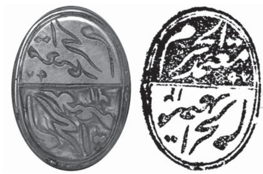
تصویر ۶- اصل و اثر مُهر بیضی شکل عقیق با سجع: «معمدالحرم ۱۲۹۲ ق»، این مُهر را به شیوه گود و برجسته حکاکی کرده‌اند و سجع آن تکرار شده است

توضیح شاردن مربوط به پرداخت نگین‌ها و مُهر انگشتی‌هاست در حالی که رحمتی بن عطاء الله در این مورد از پرداخت و اصلاح مُهرهای فلزی سخن گفته است. در دوره قاجار و پهلوی نیز مهم‌ترین شیوه حکاکی به همین