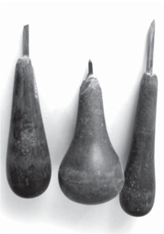
تصویر ۵- قلم فولادین برای حکاکی مُهرهای برنجی (فلزی)، قدمت قاجاریه، مجموعه خاندان حمیدی حکاک شیرازی، ماخذ: نگارندگان

۴- نگین‌های مجزا که نقش مُهر اسم را ایفا می‌کند و دسته و قابی متمایز از انگشتی دارد.