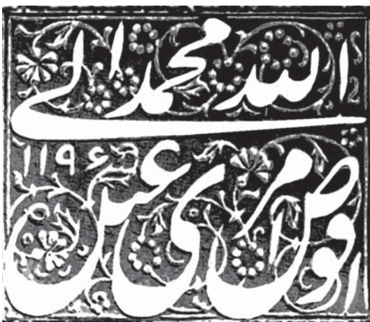
تصویر ۲- (بالا) اصل و اثر مُهر چهارگوش عقیق با سجع: «لا اله الا الله ملك الحق المبين، عبده ابوالقاسم، ۱۲۷۴ ق»، (پایین) اصل و اثر مُهر چهارگوش برنجی محمدشاه قاجار با سجع: «افوض امری الی الله، عبده محمد، ۱۱۹۶ ق»، ماخذ: جدی، ۱۳۹۰، شماره ۵۸۲۸

گاهی آن‌ها را از هرگونه آمادگی پیشین بی‌نیاز می‌ساخت و معمولاً در بداهه خود، هم زمان هم ترکیب را می‌نوشتند و هم در واقع آن را حک می‌کردند. شیوه دوم نیز خاص مُهرهای سفارشی بوده است. ایزار حکاکان مُهرهای برنجی در حکاکی به شیوه گودکن، از چند قلم ساده فولادی و یک گیره دستی تشکیل می‌شد. گیره معمولاً تکه چوبی به قطر پنج تا هشت سانتی‌متر و بلندی بیست سانتی‌متر بود. خراطی بدنه چوب که از ساقه درختان کم‌زور با تراکم بافت زیاد تهیه می‌شد، گیره را برای کنترل در یک دست آسان می‌کرد. در محور عمود بر دواپر چوب گیره - از یک سر آن و مخالف با راه چوب - شکافی سطحی ایجاد می‌کردند تا محفظه گیرنده مُهر باشد. علت اصلی این تمهیدات برای ساخت گیره ای مناسب با طول عمر و کارایی بیش‌تر و مفیدتر بوده است. ۱ دسته مُهر خام برنجی را کاملاً در شکاف گیره قرار می‌دادند تا سطح رویین گیره و فضای پشت مُهر بر هم مماس شود. سپس با استفاده از کش یا لاستیک، مُهر و گیرنده مُهر را محکم می‌بستند. پیش‌تر سطحی را نیز که با فضای پشت مُهر درگیر بود، کمی پرداخت می‌کردند تا تنگنای چرخشی و عدم انعطاف دست