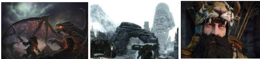
تصویر ۳. بازی رستم (مصری، ۲۰۲۱) (Mosri, 2021) (Figure 3. The Iranian Game Rostam) Figure 3. The Iranian Game Rostam (Mosri, 2021)

و احساسی ایجاد می‌کند و صداها و صداهای محیطی و دیالوگ‌ها نیز به غنای تجربه بازی کمک می‌کنند. بازی به بررسی مضامینی همچون شجاعت، فداکاری و هویت ملی می‌پردازد که نه تنها بازیکن را سرگرم می‌کند، بلکه او را به تفکر درباره فرهنگ و تاریخ خود ترغیب می‌نماید. تقابل میان رستم به عنوان قهرمان و دشمنانش به وضوح در بازی نمایان است. رستم نماد شجاعت و وفاداری است، در حالی که ضدقهرمان‌ها نمایانگر ضعف‌ها و خیانت هستند. این تقابل‌ها تنش داستانی را افزایش داده و به بازیکن فرصتی برای بررسی مفاهیم اخلاقی می‌دهند. بازی به طور نمادین به تقابل نور و تاریکی پرداخته و محیط‌های روشن و شاداب در کنار مکان‌های تاریک، احساسات متناقضی مانند امید و ناامیدی را در بازیکن ایجاد می‌کند. تداخل میان رویدادهای تاریخی و اسطوره‌ای، بازیکن را با سوالاتی درباره مرز بین این دو مواجه می‌کند. تضاد بین تقدیر و اراده انسانی نیز در بازی مشهود است، زیرا شخصیت‌ها با چالش‌هایی روبرو می‌شوند که آن‌ها را به انتخاب‌های سخت وادار می‌کند. بازی هنرمندانه مرز بین اسطوره و واقعیت را محو کرده و سوالاتی درباره حقیقت و افسانه ایجاد می‌کند. زیبایی‌شناسی تقابل‌های اسطوره‌ای در "رستم: افسانه جنگ" تجربه‌ای عمیق و معنادار خلق کرده است. این تقابل‌ها داستان را جذاب‌تر کرده و به بازیکن امکان می‌دهد به مسائل انسانی و فرهنگی بپردازد.