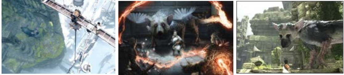
تصویر ۲. بازی آخرین نگهبان (Japan Studio GenDesign, 2016) Figure 2. The Last Guardian (Japan Studio GenDesign, 2016)