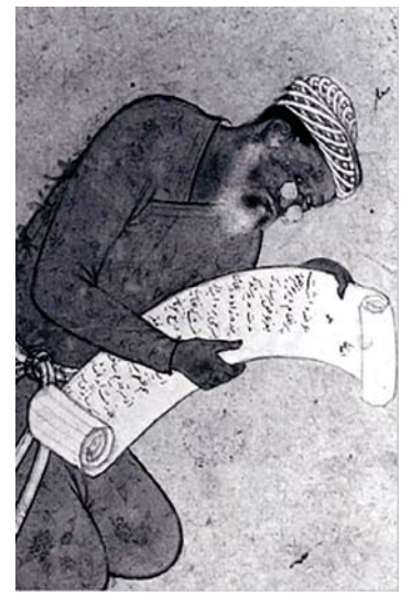
تصویر ۷. تک‌چهره پدر پیر میر مصور، میر سید علی، حدود ۹۸۰ قمری، دربار اکبر شاه، مأخذ: خزایی، ۱۳۹۸: ۱۱۲

از اجزای اثر در معنایی دیگر، ذهن متفکر را از عالم محسوس به عالم معقول می‌رساند» (اردلان و بختیار، ۱۳۹۰: ۶۶). زیبایی نگاره‌ها پایان‌ناپذیر هستند و هر چه در تعریف و تفسیر آن بکشیم باز هم کم است. داستان تصاویر در نگارگری، حکایاتی نه بر پایه تخیل محض و نه بر پایه امور کاملاً واقعی است، بلکه میانی بین این دو است. این دوگانگی واقعیتهای قائم به ذات در آن به وجود آورده، از عناصر فرض واقع و خیال تشکیل شده است. خیال محض نیست که در مواجهه با آن به عالم تخیلات رفته و هرگونه تفسیری از آن حاصل شود. تصاویر در نگارگری تکوین نیافته که به آن دسترسی حاصل شود.