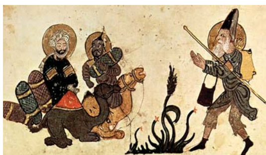
تصویر ۳. ابوزید در سفر حج، مکتب بغداد، قرن سیزدهم میلادی، کتابخانه ملی پاریس، مأخذ: https://negareha.art/baqdada-school