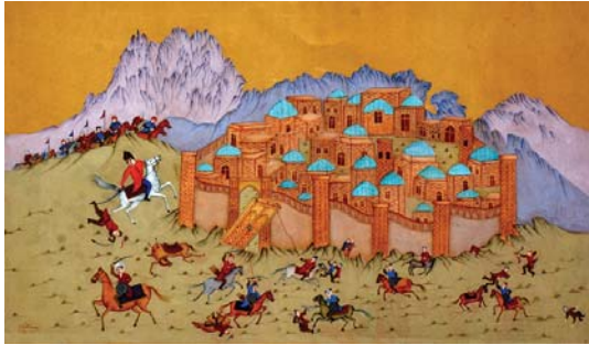
تصویر ۱۳. حمله چنگیز به شهر قلقله، نیلاب نوایی، ۴۰×۳۰ س، ۱۳۹۶، کابل