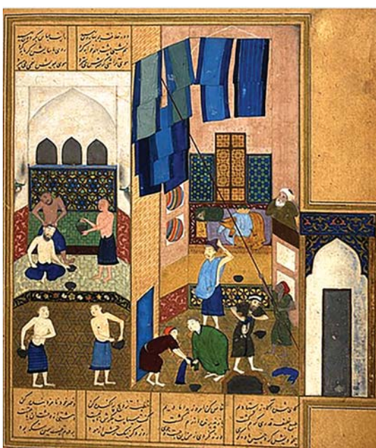
تصویر ۶. هارون الرشید در گرمابه، رقم کمال‌الدین بهزاد، مکتب هرات، مأخذ: رمضان زاده، جلوه هنر