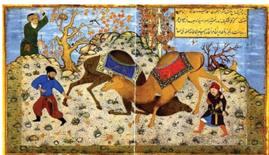
تصویر ۵. نزاع شتران، رقم کمال‌الدین بهزاد، صفحه‌ای از مرقع گلشن، حدود ۹۳۸ ه‍.ق/ ۱۵۲۰ م، مأخذ: مجابی و فنایی، ۱۳۸۹: ۱۴۴

تأثیر سنت‌های تصویری نگارگری قدیم ایران بر نگارگری معاصر افغانستان با تأکید بر آثار کمال‌الدین بهزاد ۹۱-۱۱۱/حسنعلی پورمنده، علی اصغر فهیمی‌فر، علی اصغر شیرازی، حمیده انصاری