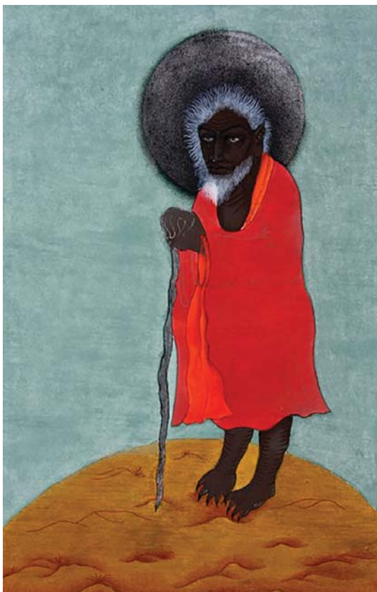
تصویر ۱. شیطان، حمیرا مستور، ۲۰×۳۰ س، گواش و آبرنگ، ۱۳۸۸، کابل، مأخذ: مرکز هنری فرهنگی فیروزکوه.

تأثیر سنت‌های تصویری نگارگری قدیم ایران بر نگارگری معاصر افغانستان با تأکید بر آثار کمال‌الدین بهزاد/۹۱-۱۱۱/حسنعلی پورمنده علی اصغر فهیمی فر، علی اصغر شیرازی، حمیده انصاری