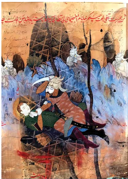
تصویر ۱۱. رستم و سهراب، خادم علی، دهه نود، مأخذ: سایت هنرمند.

از احساس عمیقی است که به زندگی داشته است» (تجویدی، ۱۳۴۵: ۸ و ۹). چنین است که نوعی رئالیسم را در کارهای او با نشان دادن صحنه‌های عادی مانند استحمام، ساختن بنا، موعظه و غیره می‌بینیم. در ترسیم بناها و منظره‌ها، به حد اعجاز رسیده بود. «در آثار بهزاد، پیکره‌ها صرفاً ظاهر انسانی ندارند و چهره آن‌ها آشکارا با یکدیگر فرق دارد» (بلر و بلوم، ۱۳۸۱: ۸۰، برند، ۱۳۸۶: ۲۲۲) و به روایتی دیگر، انسان‌ها از آزادی و حرکت بیشتری برخوردارند؛ ایستا و ساکن نیستند بلکه فعال و پرتحرک هستند. حالات مختلف در چهره مانند غم و اندوه و یا شادی و سرزندگی هویداست. اهمیت به ارزش و عملکرد مفید انسان در اقبال مختلف جامعه و قرارگیری او در تناسب منطقی‌اش با دیگر اجزای تصویر توسط ترکیب‌بندی جادویی‌اش، خیلی گویا و روشن نشان داده شده است. «ترکیب بی‌بدیل در آثار وی با قرارگیری پیکره‌ها معمولاً به صورت مدور با کمک نقشمایه‌هایی همچون حیوانات، گل‌بوته، درخت، ابر و از همه مهم‌تر نقش و عنصر معماری در جهت قوت بخشی بیشتر، با پشتوانه دانش زیبایی‌شناختی وی؛ یگانه و بی‌همتا هستند. بهزاد ساختار نقاشی را به گونه‌ای ترکیب‌بندی کرد که توانست چهره‌ای جدیدی به آن ببخشد و صحنه‌ای غنی از تصاویر اجزای ساختمان‌ها خلق کند که این مسئله فقط از طریق به‌کارگیری اسلوب هندسی