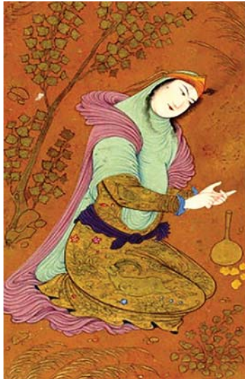
تصویر ۹. مرقع شمارش زن با انگشتانش، صفحه‌ای از یکی از نسخ خطی هفت‌اورنگ جامی، قبل از سال ۱۲۰۰ ش، مأخذ: دفتر ثبت و بایگانی ملی کابل-افغانستان