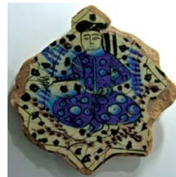
تصویر ۵ ب. کاشی زیرلعابی، قبادآباد ترکیه، اوایل قرن ۷ هجری، محل نگهداری: موزه کاراتای قونیه، مأخذ: www.pbsa.com