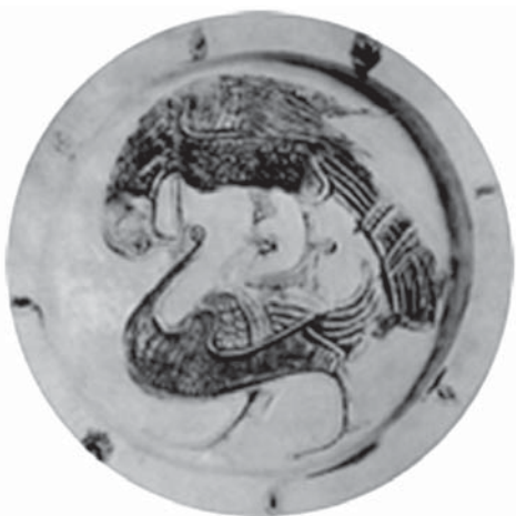
تصویر ۱۱. بشقاب حکاکی شده چندرنگ (لقابی)، احتمالاً قرن ۵ هجری، محل نگهداری: موزه متروپلیتن، مأخذ: پوپ، ۱۳۸۷، ج ۶: ۵-۶.