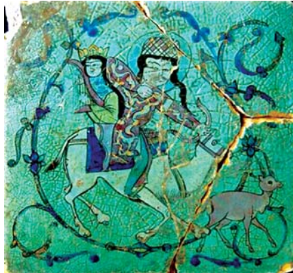
تصویر ۱۳. کاشی مینایی با نقش بهرام گور و آزاده، قونیه، عمارت قلیچ ارسلان دوم، اوایل قرن ۷ هجری، محل نگهداری: مجموعه قویون اغلو