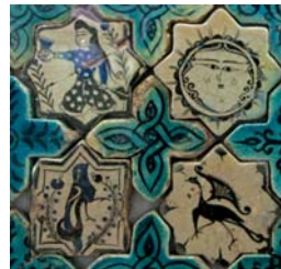
تصویر ۲. بخشی از کاشی‌های کاخ قبادآباد ترکیه، محل نگهداری: موزه کاراتای قونیه

قرن ۶ هجری، آثار مینایی و زرین‌فام منتسب به ری اواخر قرن ۶ و اوایل قرن ۷، آثار زرین‌فام و زیرلعابی منتسب به کاشان نیمه اول قرن ۷ و کاشی‌های زرین‌فام کاشان با تاریخ ۶۷۰-۶۵۰ هجری.