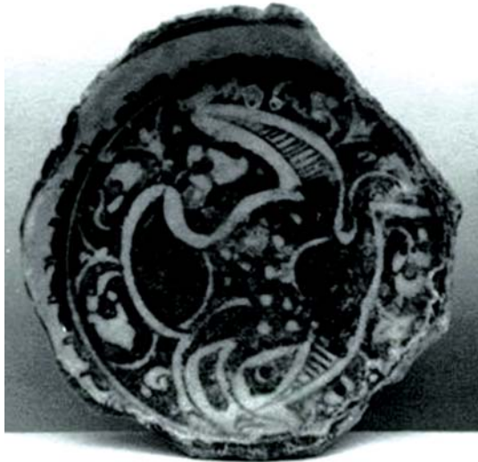
تصویر ۹ الف. قطعه‌ای از بشقاب زیر لعابی، رقه، اوایل قرن ۷ هجری، محل نگهداری: موزه هنرهای زیبای بوستون، مأخذ: www.zoom.mfa.org