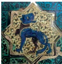
تصویر ۷ ب. کاشی زیر لعابی، کاخ قبادآباد ترکیه، اوایل قرن ۷ هجری، محل نگهداری: موزه کاراتای قونیه

اما از مهم‌ترین مصداق‌های نفوذ سفال ایران در سوریه باید به نقوش اشاره کرد. «با وجود تفاوت فنی، ظروف