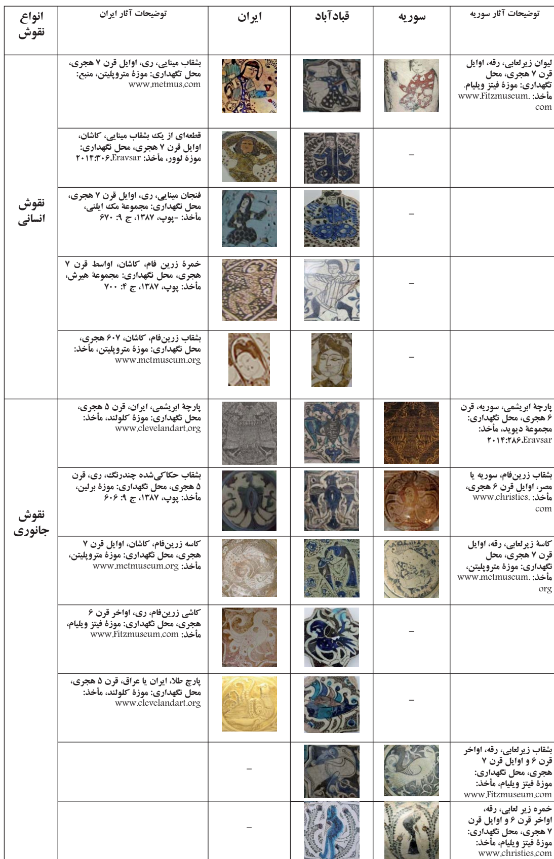
جدول ۱. مقایسه تطبیقی نقوش کاشی‌های کاخ قبادآباد و نقوش آثار ایران و سوریه.