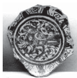
تصویر ۷ الف. قطعه‌ای از بشقاب زیر لعابی، رقه، اوایل قرن ۷ هجری، محل نگهداری: موزه هنرهای زیبای بوستون، مأخذ: www.zoom.mfa.org

این آثار علی‌رغم فقدان نمونه‌های مشابه در سفالینه‌های پیش از خود استمرار یک سنت دیرپا و ریشه‌دار در نقش‌پردازی است.