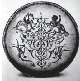
تصویر ۶ الف. کاسه مینایی، ری یا کاشان، قرن ۷ هجری، محل نگهداری: مجموعه سی.ال. دیوید