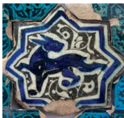
تصویر ۴ ب. کاشی زیرلعابی، کاخ قبادآباد ترکیه، اوایل قرن ۷ هجری، محل نگهداری: موزه کاراتای قونیه، مأخذ: www.pbsa.com