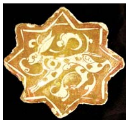
تصویر ۴ الف. کاشی زرین‌فام، ری، اواخر قرن ۶ هجری، محل نگهداری: موزه متروپلیتن