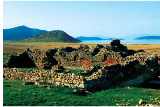
تصویر ۱. خرابه‌های کاخ قبادآباد در ساحل دریاچه بیشهیر در جنوب غربی قونیه

نقوش جانوری در تنوعی از ترکیب‌های هنرمندانه،