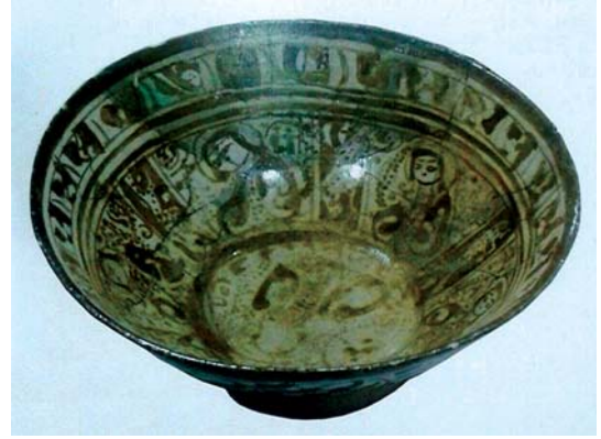
تصویر ۱۲. کاسه زرین فام، آناتولی، اواخر قرن ۶ و اوایل قرن ۷ هجری، محل نگهداری موزه کاراتای مدرسه قونیه

دوردست‌های مرز شرقی و پیشروی به سوی غرب، آنها که توانستند از دم تیغ مغول بگریزند همراه با سلطان جلال‌الدین خوارزمشاه و یا در رکاب مغول به مناطق غربی منتقل شدند و میراث دوران قدرت و شکوه فرهنگ و هنر را با خود به این منطقه آوردند» (مشکور، ۱۳۵۰: ۵). سلاطین و شاهزادگان سلجوقی نیز که توجه خاصی به علم و ادب و هنر داشتند با حسن پذیرش از آنها استقبال کردند. «از جمله سلطان علاء‌الدین کیقباد که عارفان و بزرگانی همچون بهاء‌الدین ولد، فخرالدین عراقی و نجم‌الدین ابوبکر رازی از حمایت او برخوردار بودند» (اوزون چارشی لی، ۱۳۶۸: ۱۱).