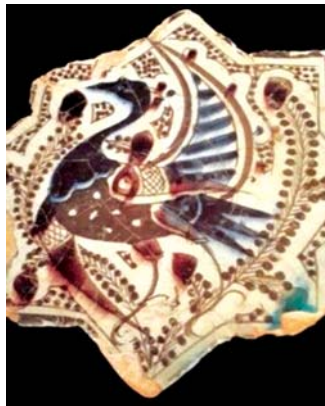
تصویر ۹ ب. کاشی زیر لعابی، کاخ قبادآباد ترکیه، اوایل قرن ۷ هجری، محل نگهداری: موزه کاراتای قونیه، مأخذ: همان