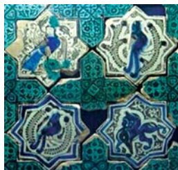
تصویر ۳. بخشی از کاشی‌های کاخ قبادآباد ترکیه، محل نگهداری: موزه کاراتای قونیه، مأخذ: همان