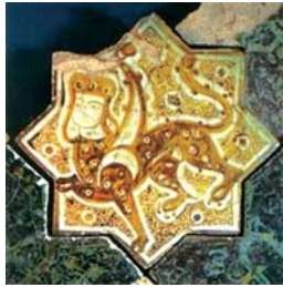
تصویر ۶ ب. کاشی زرین فام کاخ قبادآباد ترکیه، اوایل قرن ۷ هجری، محل نگهداری: موزه کاراتای قونیه