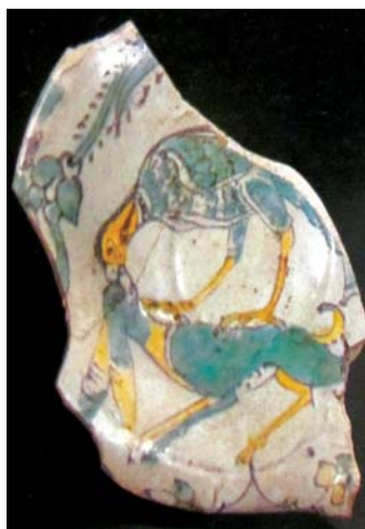
تصویر ۱۰. قطعه‌ای از یک کاسه با تزیینات رولعابی، مصر، قرن ۴-۵ هجری، محل نگهداری: مجموعه کی‌یر.

به‌طور گسترده‌ای با ایران نیز برقرار بوده و از آنجا آثاری به آناتولی صادر شده است.