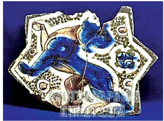
تصویر ۸ ب. کاشی زیرلعابی، کاخ قبادآباد ترکیه، اوایل قرن ۷ هجری، محل نگهداری: موزه کاراتای قونیه، مأخذ: www.pbsa.com

علاوه بر سفالینه‌ها، آثار فلزی، حجاری و پارچه‌ها را نیز دربرمی‌گیرد. با این حال باید گفت هنر سلجوقیان روم از بعضی لحاظ با هنر سایر سلجوقیان بزرگ و دولت‌های بازمانده آنها در جزیره و شام تفاوت دارد و تحت نفوذ اوضاع تاریخی و شرایط بومی و محلی تغییراتی در آن حاصل گردیده و مبانی ویژه خویش را یافته است.