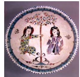
تصویر ۵ الف. بشقاب مینایی، کاشان، اوایل قرن ۷ هجری، مأخذ: Watson, 2004: 370

نتایج بررسی تطبیقی نقوش قبادآباد، ایران و سوریه نشان می‌دهد که مبانی طراحی و شیوه رنگ‌گذاری نقوش قبادآباد، بیش از ایران، به آثار رقه شباهت دارد، اما موضوعات و تنوع نقوش بیشتر متأثر از ایران است. این در حالی است که شباهت زیادی نیز میان نقوش ایران و رقه مشاهده می‌شود.