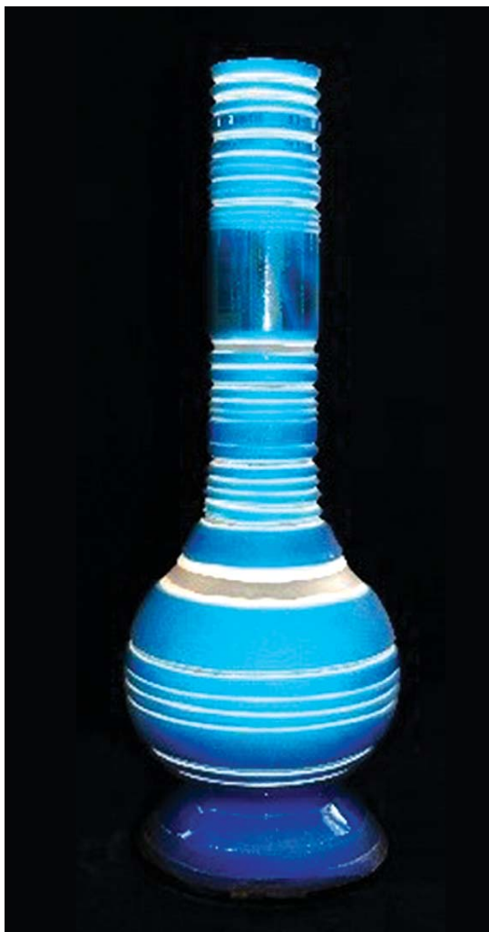
تصویر ۷. اثر شیشه‌ای سه پوست.

ساخته‌شده اما مذاب آن قبل از شکل گرفتن، درون مذاب شیشه رنگی فرو می‌رود که در نهایت پوششی رنگی ظرف را دربر می‌گیرد (تصویر ۴ و ۵). سپس اثر شیشه‌ای مراحل سرد شدن و تنش‌زدایی را طی می‌کند و در مرحله بعد روی ظرف متناسب با طرح دلخواه شیشه‌گر تراش‌خورده و تمام لایه بالایی آن به‌جز بخش‌های موردنیاز برداشته می‌شود و نقش به‌صورت برجسته از محیط مجاور خود آشکار می‌گردد (تصویر ۶ و ۷). گفتنی است در این روش هنرمند شیشه‌گر بر اساس ضخامت شیشه رنگی در مورد عمق اجرای تراش‌ها تصمیم می‌گیرد. نقاط برجسته درجایی ایجاد می‌شوند که شیشه ضخیم باشد. سایه نیز با نازک شدن لایه رویی و یا لایه تراش‌خورده ایجاد می‌شود. همچنین تضاد رنگی آشکاری در بین لایه‌های رنگی اثر شیشه‌ای مشهود بوده و شیشه‌گر اغلب از مذاب بی‌رنگ در لایه