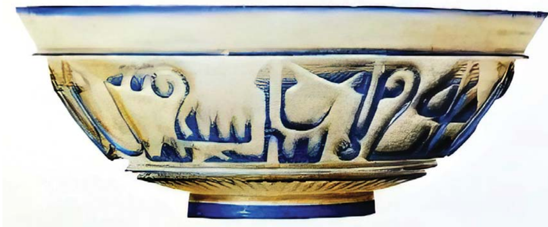
تصویر ۳. شیوه تراشیدن، خط نوشته، جزئی از کاسه، قرن ۴-۵ ه.ق ایران، مأخذ: گلدشتاین، ۱۳۸۷: ۱۳۶.

همان‌گونه که اشاره شد پیوند نزدیکی بین شیشه‌بری و سنگ‌بری در نزد مسلمانان تاریخ میانه وجود داشته و تردیدی وجود ندارد که تراش شیشه در ایران و در منطقه‌ای که سنت کهن سنگ‌بری برقرار بوده رواج داشته است (اتینگهاوزن، شرآتو و بمباچی، ۱۳۷۶: ۲۸). در اواخر سده سوم و سراسر سده چهارم هجری شیشه‌گران در شهرهای نیشابور، ری، ساوه، گرگان به تولید ظروف شیشه‌ای نفیس اشتغال داشتند. در این دوران روش‌های ساخت شیشه در ایران تغییرات چشمگیری یافت و این روش جدید برای ساخت و تزئین شیشه مورد استفاده قرار گرفت که عبارت بود از تراش دادن عمق زمینه ظروف و به جا گذاشتن نقوش اصلی که به صورت نقش برجسته روی سطح آن ایجاد می‌شد (حاتم، ۱۳۸۸: ۱۳۷). آثار شیشه‌ای تراش برجسته