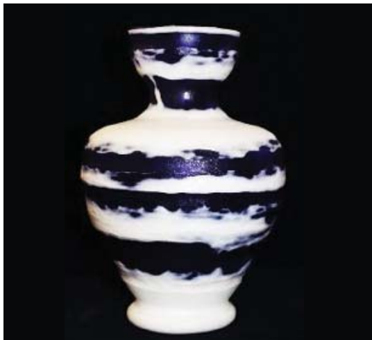
تصویر ۶. اثر شیشه‌ای دو پوست

بررسی شیوه ساخت و تزیین آثار شیشه‌ای تراش