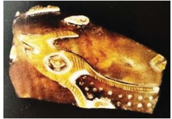
تصویر ۸. قطعه شیشه سه پوست، دمیده، تراش برجسته، قرن ۴-۵ ه.ق مصر، مأخذ: Whitehouse, 2010: 303

خطوط افقی و عمودی نیز بر روی ۵ نمونه از این آثار مشاهده شد. گفتنی است نقوش بقیه این قطعات به دلیل کوچک بودن قابل‌شناسایی نیست. در رابطه با رنگ آثار شیشه‌ای تراش برجسته باید گفت پس‌زمینه تمام این آثار به جز یک نمونه بی‌رنگ بوده و لایه بیرونی بیش از نیمی از آن‌ها سبز است. پس‌از آن به ترتیب رنگ آبی با ۱۲ عدد، قهوه‌ای مایل به زرد با ۳ عدد، قهوه‌ای با ۲ عدد بیشترین رنگ‌های مورد استفاده شیشه‌گران برای لایه بیرونی بوده است. همچنین رنگ‌های زرد، زرد مایل به سبز، سبز مایل به آبی نیز هرکدام لایه بیرونی یک اثر را دربر گرفته‌اند.