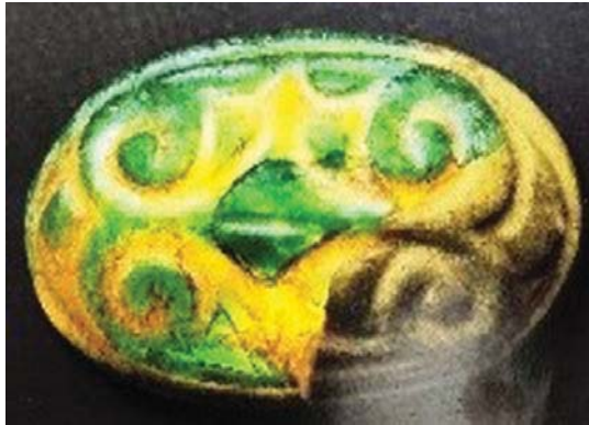
تصویر ۹. شیشه تراش برجسته با پس‌زمینه زرد، نیمه دوم سده سوم هجری ایران، مأخذ: Carboni, 2001: 83