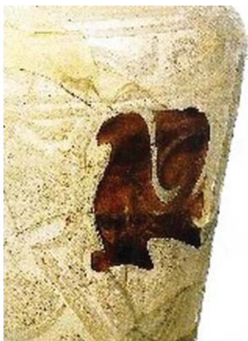
تصویر ۲. شیوه جایگذاری، نقش پرنده، جزئی از تنگ گوشت‌کوبی، سده ۴-۵ ه.ق ایران

از این مناطق ایران یافت شده است. با توجه به اطلاعات محدودی که از شیشه‌های تراش برجسته موجود است، به نظر می‌رسد این نوع شیشه بیش از صدسال ساخته می‌شده است. چند قطعه شیشه تراش برجسته در کاوش‌های باستان‌شناسی جوسق‌الخاقانی در سامرا کشف شده که متعلق به سده‌های ۳-۵ ه.ق است. (Whitehouse, 2010: 283) سامرا بهترین اطلاعات را درباره شیشه‌گری از سده سوم ارائه می‌دهد که مهم‌ترین تکنیک شیشه‌گری اشکال مختلف شیشه‌بری در آن زمان بوده است (گراپر و اتینگهاوزن، ۱۳۷۶: ۶۸). شیشه ساخت سامرا در عراق سده سوم هجری از نظر کیفیت بی‌نظیر بوده و شیشه‌های