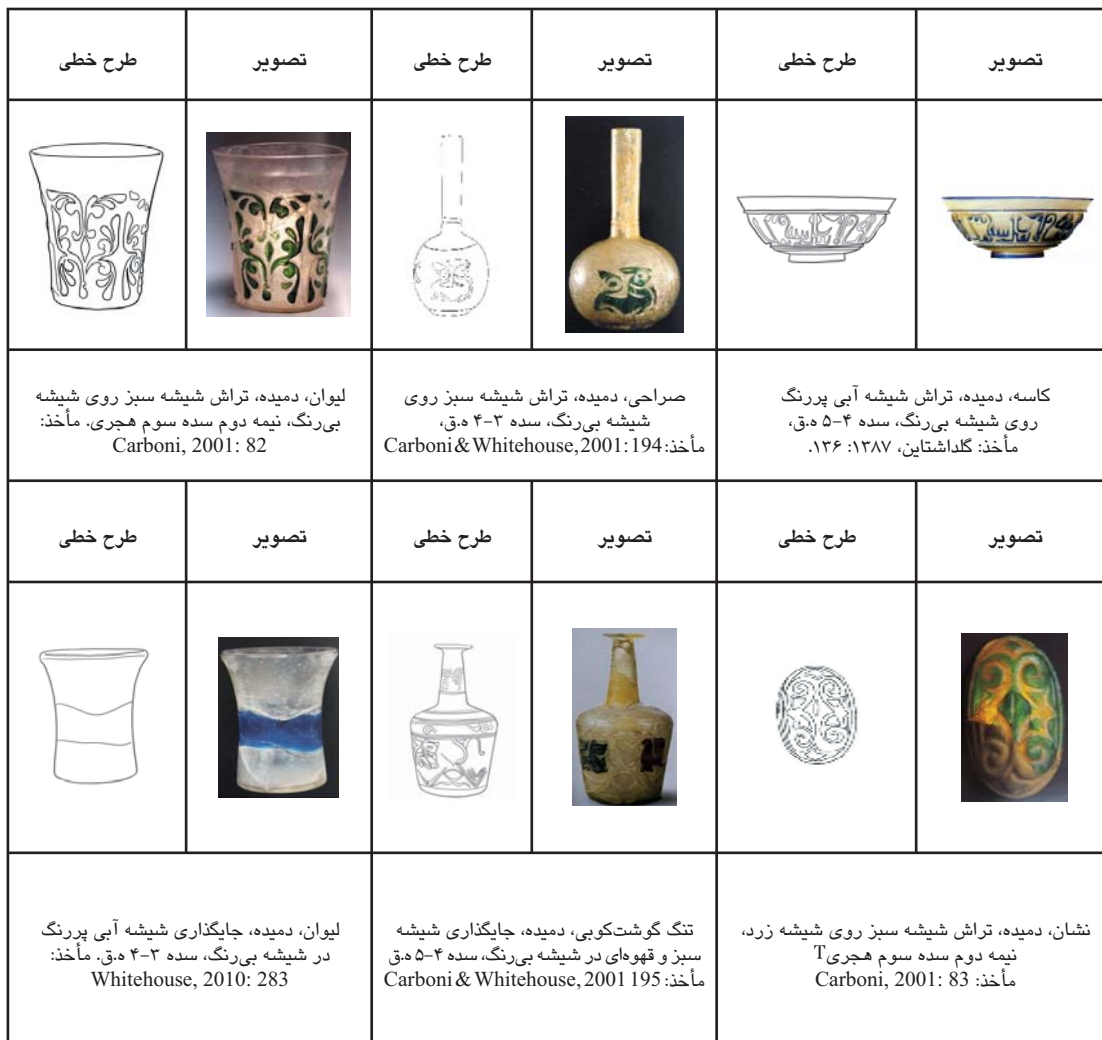
جدول ۱. آثار شیشه‌ای تراش برجسته ایران در سده‌های ۳-۵ ه.ق.

تراش سطحی ایجاد شده‌اند، دایره‌های بزرگ‌تری ایجاد می‌شوند که با دوائر کوچک متحدالمرکز می‌باشند، این تراش سطحی دوبل نامیده می‌شود. در تراش سطحی برجسته ابتدا مذاب شیشه به درون قالبی که نقوش آن کنده‌کاری شده دمیده شده و پس از سرد شدن آن، با تراش نقوش برجسته بر روی سطح شیشه باظرافت بیشتری نمایان می‌شود. تراش خطی نیز بیشتر در دوره اسلامی رواج یافته و شامل خطوط مستقیم، مورب و غیره روی آثار شیشه‌ای است. شیشه‌گر گاهی تلفیقی از تراش‌های خطی و سطحی را نیز به‌کار برده است. این تراش‌ها روی ظروف شیشه‌ای که با یک رنگ مذاب شیشه ساخته شده‌اند به‌وفور وجود دارد. تفاوت اساسی آثار شیشه‌ای نقش برجسته با اشیای تراش‌خورده در بدنه دو یا چند پوستی آن است. در دوران ساسانیان روش تراش روی شیشه در ایران