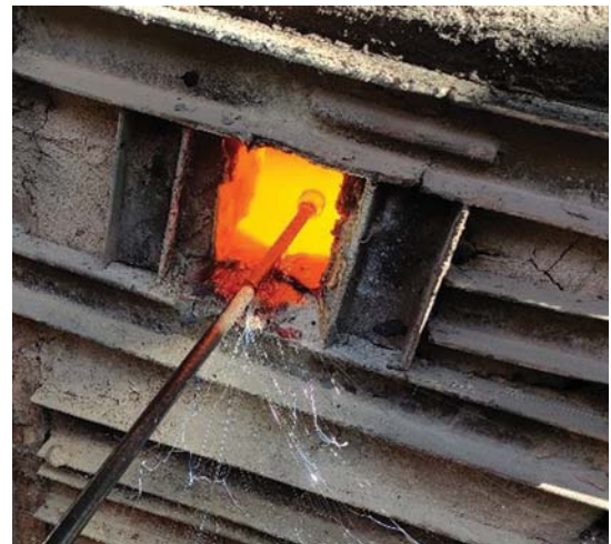
تصویر ۵. فرو بردن گوی اول درون مذاب شیشه رنگی. مأخذ: همان.