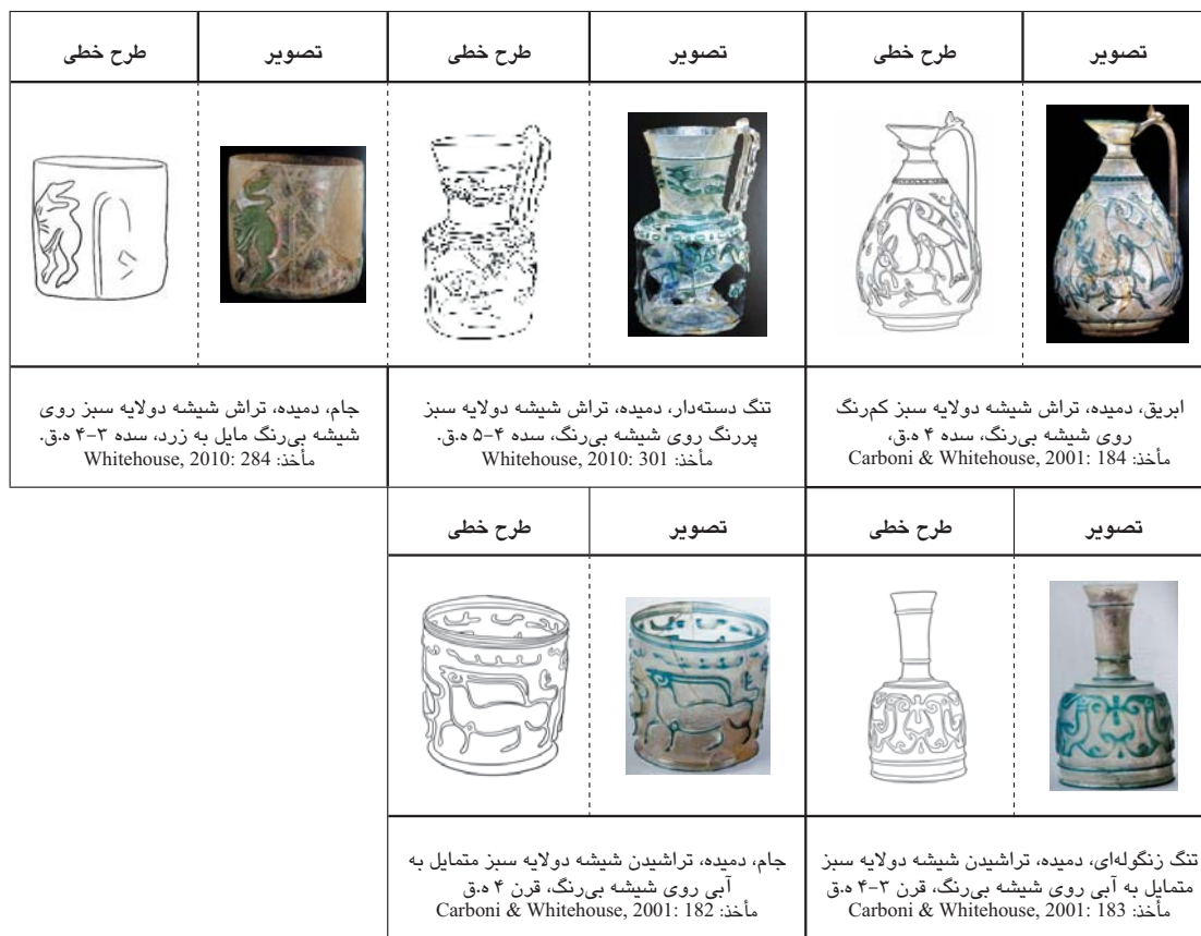
جدول ۲. آثار شیشه‌ای تراش برجسته مصر در سده‌های ۳-۵ ه.ق.

که از خود بر جای گذارده درباره فن تراشکاری در ایران که در گذر زمان تغییر عمده‌ای نیافت، پس از شرح مختصری درباره چرخ سنباده دار برای تراش شیشه می‌افزاید: «تراش گران ایرانی باید در بسیاری موارد مته و یا چرخ تراش را در یک دست نگاهدارند و با دست دیگر شیشه را در تماس با آن بگردانند که اگر هم دائماً شاگردی در خدمت داشته باشند، باز انسان از مهارت دست و کاردانی ایشان دچار حیرت می‌شود» (Ferrier, 1989: 299). ایجاد نقش روی ظروف شیشه‌ای مهارت زیادی می‌طلبیده و استادکاران شیشه‌گر با صرف اوقات طولانی قادر به انجام آن بوده‌اند. تراش با چرخ مسی از زمان قدیم در مصر و روم کاربرد داشته است و امروزه با استفاده از الکتروموتورهایی که دیسک را به چرخش درمی‌آورند، انجام می‌گیرد. سنگ‌های مخصوص این کار سختی متفاوتی داشته و سرعت چرخش آن در نوع تراش تأثیر مستقیم دارد یعنی هر چه سرعت چرخیدن سنگ بیشتر باشد عمق تراش بیشتر می‌شود (یاوری، ۱۳۹۰: ۱۷۹). در میان آثار شیشه‌ای ایران و مصر تعداد