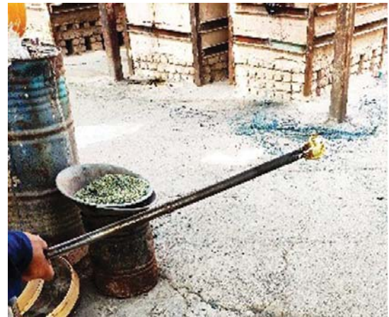
تصویر ۴. گوی اول جهت ساخت اثر شیشه‌ای، مأخذ: آرشیونگارندگان

اعتقاد بر این است که شیشه‌های تراش برجسته از طریق دمیدن لایه‌های مختلف شیشه رنگی ساخته شده باشند. احتمالاً این ظروف شیشه‌ای در دورانی که شیوه دمیدن شیشه در سال‌های گذر از پیش از میلاد و رسیدن به بعد از میلاد بود، در ابتدای مسیر خود بوده است و معمولاً به‌عنوان محصولات باارزش و شاهکارهای متعلق به یک یا چند کارگاه شیشه‌گری محسوب می‌شدند که به کشف قابلیت‌های جدید این فن می‌پرداختند. از این رو این آثار در طول دوره کوتاهی کم‌تر از دو نسل تولید شده‌اند (Tait, 2012: 66). دمیدن شیشه، از روش‌های قدیمی ساخت شیشه در دوران باستان، نخستین انقلاب مهم در شیشه‌گری محسوب می‌شود. این فرآیند که با اختراع بوری همراه است به احتمال زیاد ابتدا در بابل و در حدود ۲۰۰ پیش از میلاد و بعدها در مصر استفاده شده است. بوری، لوله آهنی توخالی به طول ۱۰۰ الی ۱۵۰ سانتی‌متر است که از دو قسمت دسته و دهانه تشکیل شده است. شیشه‌گر با کمک بوری حباب شیشه را از طریق دمیدن شکل می‌دهد. رومیان در خلال حاکمیت آگوستوس (۲۷ تا ۱۴ قبل از میلاد) که اوضاع امپراتوری تثبیت شده بود و به رشد و توسعه شیشه‌گری توجه می‌شد، از آن استفاده کرده‌اند. شیشه‌گران روم در تمام مراحل