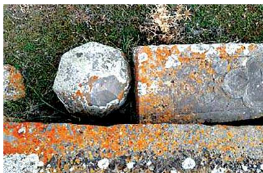
تصویر ۱. نمونه‌ای سنگ‌مزار ترکیبی که به صورت یک افراشته منشوری و یک سنگ‌قبر صندوقی است، گورستان ورزقان.

حیوان، پیش از اسلام و در اساطیر، متون کهن دینی، شاهنامه و فرهنگ بومی منطقه، نقشی بسیار ارزشمند و مورد ستایش داشته است. به غیر از استفاده رایج آن، مانند حمل و نقل و شکار، کارکردهای آیینی، اقتصادی، رزمی، بزمی، تزیینی و تشریفاتی نیز داشته است (احمدزاده و همکاران، ۱۳۹۷: ۸۷) (جدول ۳).