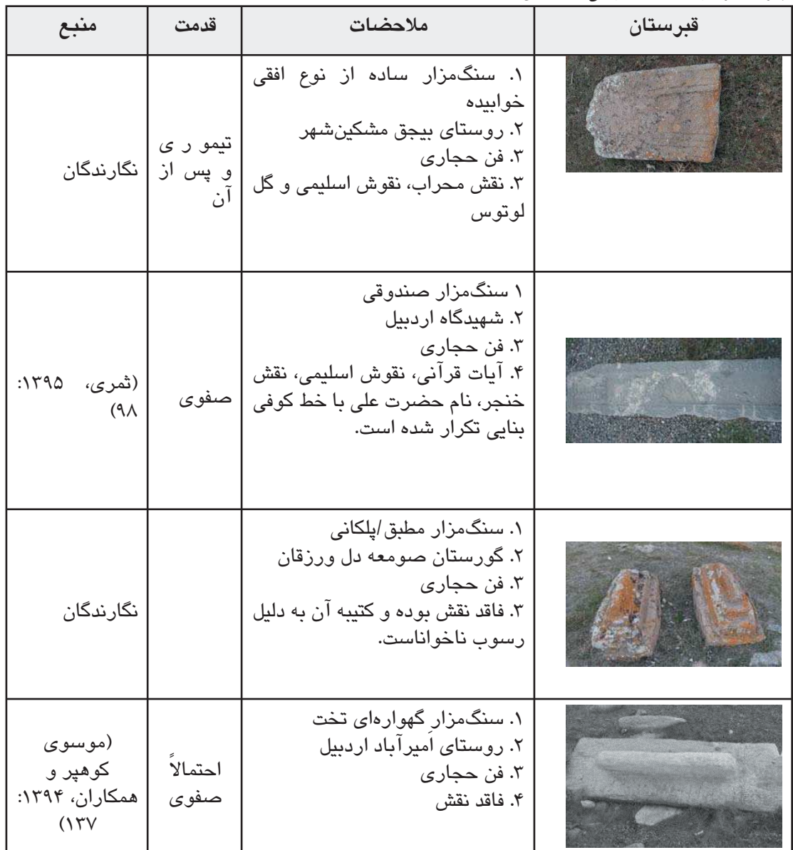
جدول ۲. نمونه‌های از سنگ‌مزارهای افقی، مأخذ: همان.

مناطق از مغولستان، قزاقستان، آذربایجان، ایران و ترکیه بر روی قبور قابل مشاهده است (Aksoy, 36: 2017). نقش قوچ همواره مورد احترام پیشینیان بوده و در منطقه آذربایجان به عنوان نمادی از بهره‌وری، فراوانی، قدرت، شجاعت و جنگاوری شناخته شده است (Alyilmaz & 305: 2017). استفاده می‌کردند در دوره اسلامی استفاده از پیکره گوسفند و قوچ مختص قبور مسلمانان نبوده بلکه در جهان بینی سایر ادیان ترک زبان نیز باقی مانده است (Ağasıoğlu, ۲۰۱۳: ۳۱). مردم منطقه آذربایجان نسبت به پیکره‌های سنگی احترام زیادی قائل بوده‌اند به طوری که زنان به منظور باردار شدن به پای گوسفندان می‌افتادند و