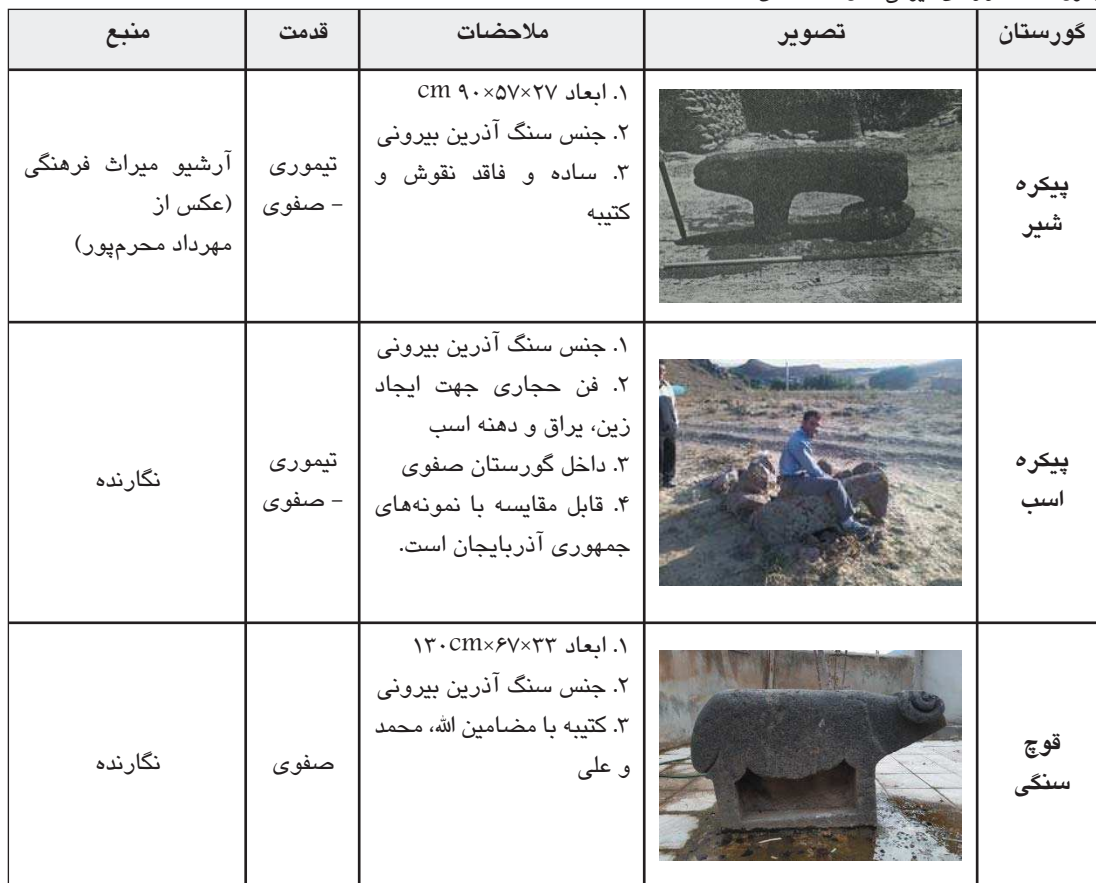
جدول ۳. سنگ‌مزارهای حیوانی شکل. مأخذ: همان.