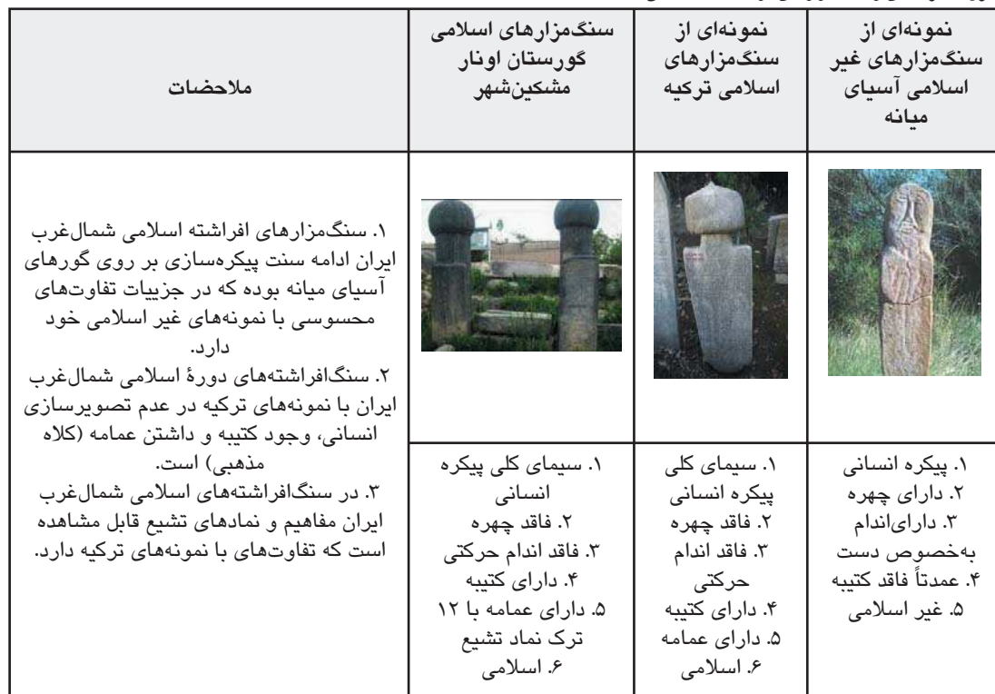
جدول ۶. نمونه‌های از سنگ‌مزارهای افراشته، مأخذ: همان.

گل لوتوس، چلیپا و حتی نقوش گیاهی که نمادی از باروری، زایش و زیبایی هستند. نمونه‌های از این نقش‌مایه‌ها را از دوره پیش از تاریخ تا ورود اسلام در آثار و بناهای مختلف شاهد هستیم. همچنین براساس شواهد باستان‌شناختی در ایران پیش از اسلام متناسب با پایگاه اجتماعی افراد در داخل قبرها قرار داده می‌شد. اشیاء درون گورها و حتی ساختار چینش گورها دارای مفاهیم و نمادهایی است که براساس آن می‌توان به ساختار اجتماعی یک جامعه و فرد متوفی دست پیدا کرد. با ورود اسلام سنت قرار دادن اشیاء در داخل گورها نهد شد که براساس آن نقوش غیر مذهبی مانند نقش ابزارآلات چون قیچی، شمشیر، تیر و کمان، ظروف و غیره بر روی سنگ‌قبرها ایجاد شد. این نقوش بیان‌کننده تفکرات شخص متوفی و پایگاه اجتماعی وی بوده است. در کنار این دو فرهنگ تأثیر باورهای شیعه به خصوص پس از دوره تیموری نمود بیشتری پیدا کرد. برخی از نقوش و مفاهیم کتیبه‌ها ارتباط نزدیکی با باورهای شیعه دارد؛ از جمله نقش ۱۲ ترک بر روی سنگ‌افراشته‌های روستای اونار بیانگر تفکرات دوازده امامی در ایجاد این نقوش است همچنین رواج اسامی از قبیل علی و خلیفه‌الخلافا اشاره کرد. به‌طورکلی سنگ‌مزارهای شمال غرب ایران از نظر نقوش و نحوه استقرار متأثر از سه فرهنگ متفاوت از نظر اعتقادی، جغرافیایی و زمانی است که در این منطقه در قابل یک فرهنگ واحد نمود پیدا کرده است.