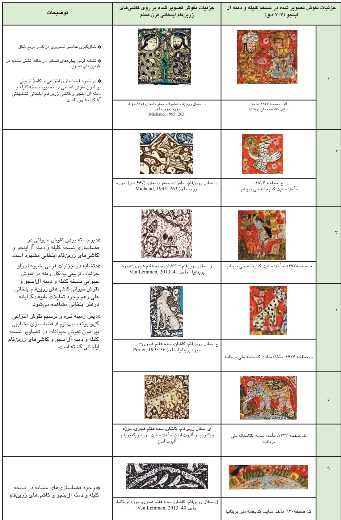
جدول ۵. تطبیق جزئیات تصویرگری نسخه کلیله و دمنه آل اینجو (کد 13506 OR) و کاشی‌های زرین‌فام ایلخانی