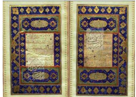
تصویر ۱. صفحات افتتاحیه قرآن متعلق به قرن دهم، حدود ۹۸۰ هجری قمری ۱

در ابتدا، هنر تذهیب قرآن رشد محدودتری نسبت به خط داشت، زیرا نگارش متن قرآن وابسته به آن نبود و از طرف دیگر، احتمالاً در همان آغاز، هنرمند مسلمان تذهیب را زمینه‌ساز نوعی تحریف در قرآن تلقی می‌کرده است. بنابراین، نوعی ترس همراه با احترام مانع از پرداختن او به تذهیب می‌شد، اما «همین ترس توأم با احترام بود که جریان رشد تذهیب را دقیقاً در مجرای صحیحی سوق داد و نیل به آن نتیجه‌ای را تضمین کرد که همگان برصحت حیرت‌آورش متفق‌القول‌اند» (لینگن، ۱۳۷۷: ۷۱). در میان همه مخلوقات فقط انسان از موهبت خلاقیت برخوردار است. انسان عقل و احساس دارد، با عقل متافیزیک و با احساس، جهان محسوسات را درک می‌کند. زمانی که این دو منبع ادراک با بصیرت همراه شوند به بالاترین درجه