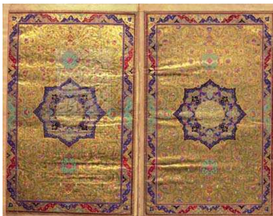
تصویر ۳. شمسۀ صفحات افتتاحیه قرآن متعلق به قرن یازدهم، حدود ۱۰۹۴ هجری قمری ۱.

چنان‌که گفته شد مایل هروی معتقد است که اسلیمی دارای پیچ‌وخم‌های متعدد که چونان درختی یا درختچه‌ای بیچان