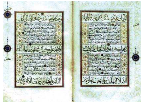
تصویر؛ صفحات داخلی قرآن متعلق به قرن دهم، حدود ۹۶۴ هجری قمری ۱ ، مأخذ: موزه ملک به شماره ۴۳.

قرآن کریم نور را در مفهوم جامعی که مصادیق مختلفی دارد به کار برده است مانند قرآن (تغابن: ۸)، روشنایی روز (انعام: ۱)، روشنایی ماه (نوح: ۱۶) و... مهم‌ترین مصداق، ذات اقدس الهی است (نور: ۳۵). خود واژه‌ی نور به روشنایی پراکنده‌ای اطلاق می‌شود که به دیدن کمک می‌کند. این روشنایی در دنیا گاه چون نور خورشید و ماه، موجب دیدن ظاهری محسوسات و گاه چون نور عقل و نور قرآن (مائده: ۱۵، شوری: ۵۲)، سبب تعقل و دید بصیرت می‌گردد. نور اخروی نیز همان چیزی است که در پیش روی مؤمنان حرکت می‌کند و راهنمای آنان به سوی بهشت است (تحریم: ۸). و کافران و منافقان در حسرت آن به سر