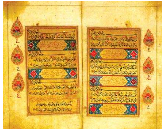
تصویر ۲. تذهیب صفحات درونی قرآن با نقش‌مایه‌های ختایی در سرسوره‌ها و نقش مایه‌های درخت در حاشیه قرآن. مأخذ: خلیلی، ۱۳۸۱: ۲۹.

نقوش و گره‌بندی‌هایی است دارای پیچ‌وخم‌های متعدد همچون گیاهان پیچان و در هم آمیخته که در حواشی و گاه در رو و پشت جلدها می‌کشند (زارعی مهرورز، ۱۳۷۳: ۱۲۴). در فرهنگ معین آمده است که «اسلیمی از طرح‌های اساسی و قراردادی هنرهای تزئینی ایرانی، مرکب از پیچ و خم‌های متعدد که انواع مختلف آن با شباهت به عناصر طبیعت مشخص می‌گردد» (کارگر و دیگران، ۱۳۹۰: ۸۰).