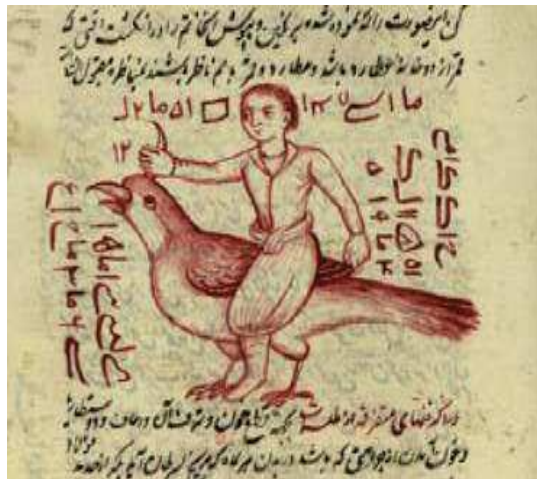
تصویر ۱۱. خاتم عطارد، مجموعه رسائل مختلفه در رمل و اسرار قاسمی، مأخذ: کتابخانه مجلس، شماره ۱۲۵۰۹، صفحه ۲۲۵

گمان بر گنج باشد چون این صورت را در آنجا بگذارند حرکت می‌کند». قسمت دوم که شامل مطالبی است که به علم احکام نجوم مربوط می‌شود. در متن کتاب در توضیح نقاشی مرد سوار بر پرند آمده است: