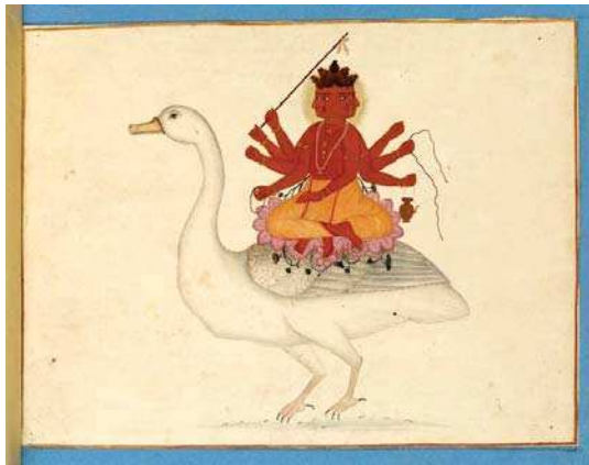
تصویر ۱۷. برهما سوار بر غاز، هند، اوایل ق ۱۹ م.