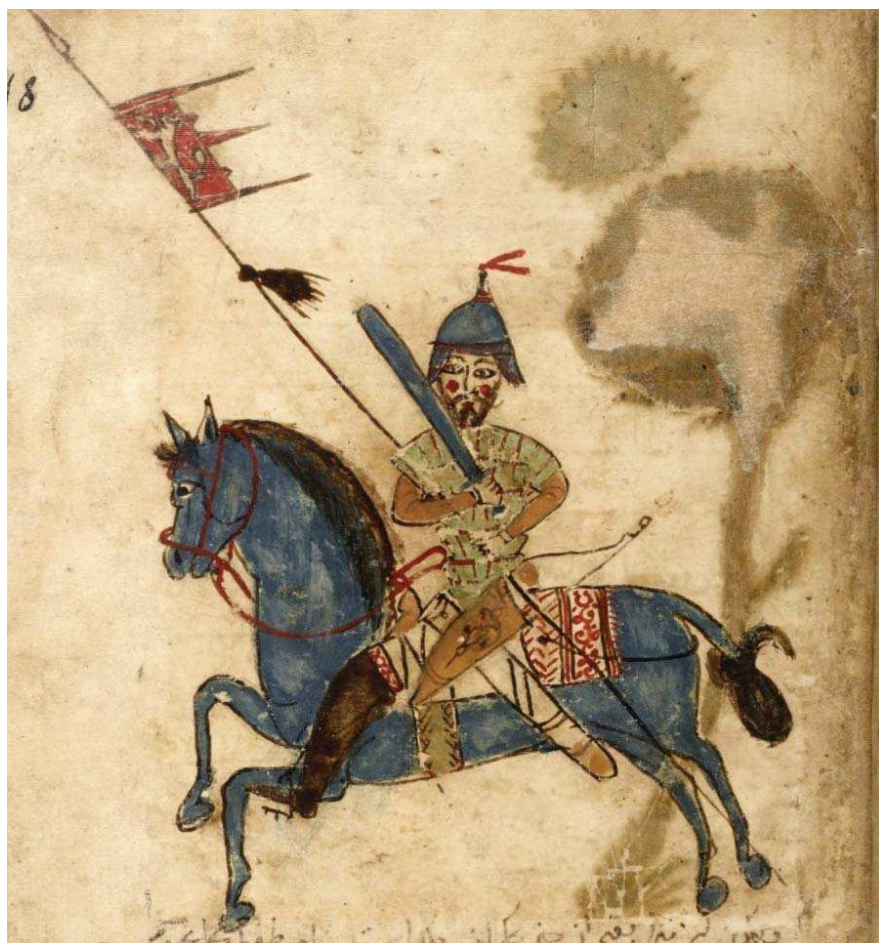
مرد سواره جنگجو

بررسی نگاره مرد سوار بر پرندۀ در نسخه خطی بقایق الحقایق نصیرالدین محمد معزم هیکلی با رویکرد شمایل شناسانه پانوفسکی / ۹۵-۱۱۱