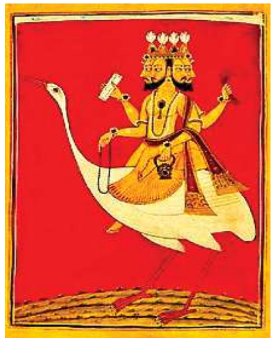
تصویر ۱۸. برهما سوار بر غاز، هند، اوایل ق ۱۸ م.