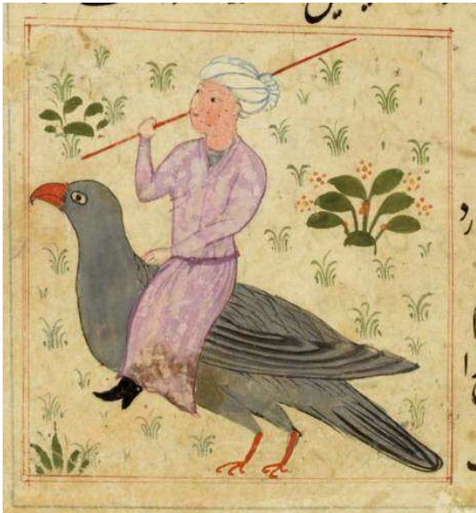
تصویر ۶. طلسم، مأخذ: عجایب المخلوقات، کتابخانه ملی فرانسه، Persan 332, fol.67r. MS پاریس

بررسی نگاره مرد سوار بر پرند در نسخه خطی دقایق الحقایق نصیرالدین محمد معزم هیکلی با رویکرد شمایل شناسانه پانوفسکی / ۹۵-۱۱۱