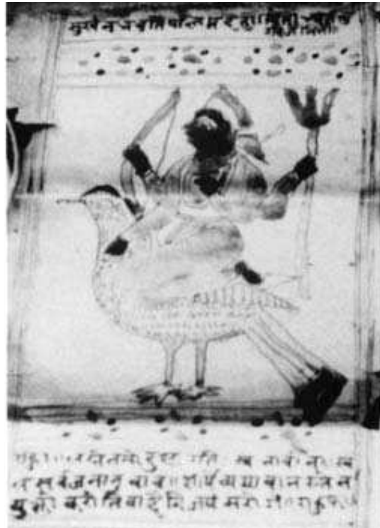
تصویر ۱۴. زحل سوار بر غاز

با یکی از خدایان مرتبط شده‌اند و بسیاری از ویژگی‌های خدایان به‌خصوص مرکب‌هایشان، به سیاره مرتبط با آن‌ها منسوب شده است. به بیانی سنت استفاده از حیوانی خاص به‌عنوان مرکب، به تصاویر نجومی هند راه می‌یابد. این در حالی است که نقش‌مایه‌هایی از این دست و به‌طور کلی نوشته‌ها و تصاویر نجومی هندی، از طریق حرانیان، به تصاویر جادویی و طلسم گونه اسلامی و اروپایی اضافه می‌شود. حرانیان که صائین نیز نامیده می‌شوند، در زمینه انتقال علوم غریبه به جهان اسلام نقش عمده‌ای داشتند. (ادهم، ۱۳۹۸: ۸۶ و ۸۷)