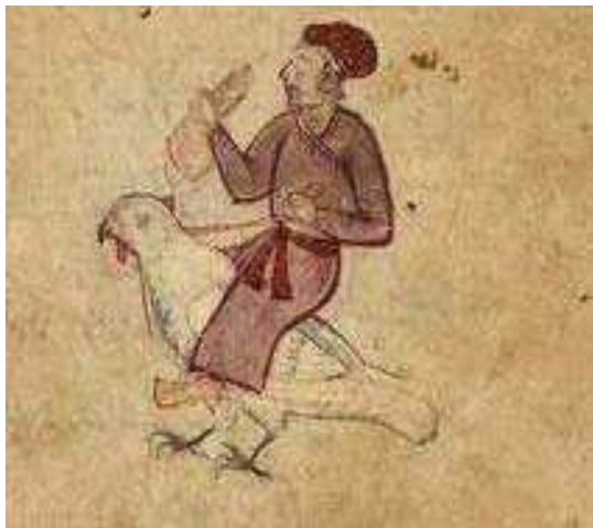
تصویر ۱۲. طلسم مشتری