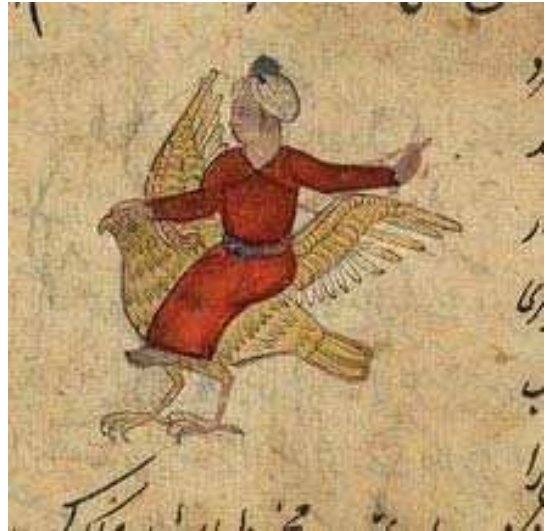
تصویر ۱۲. طلسم مشتری، مأخذ: همان، fol.93.v

در نسخه دیگری از این کتاب نیز همین تصویر با همان کاربرد را می‌بینیم که به جای مرد، زنی برهنه بر پرنده سوار است. (تصویر ۱۰) در نسخه متأخر دیگری که مجموعه‌ای در باب علوم غریبه