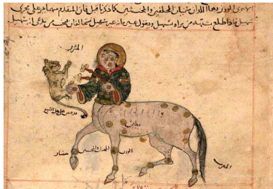
تصویر ۲. ستاره قنطورس، مأخذ: همان fol. 24v.