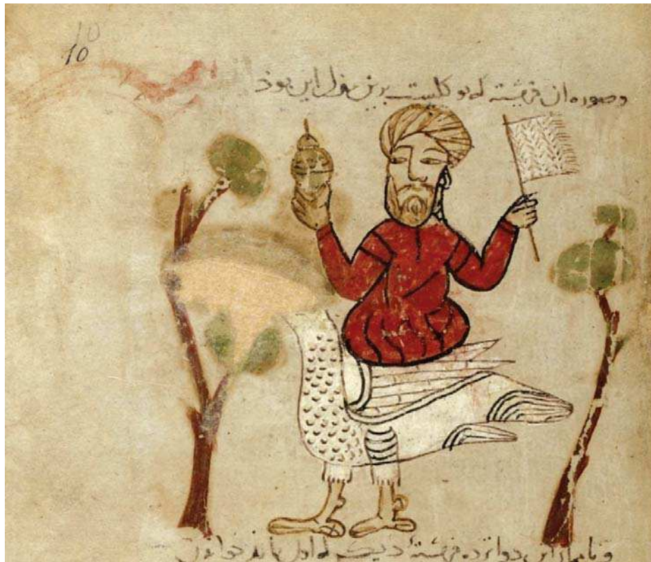
تصویر ۴. مرد سوار بر پرند، مأخذ: همان: fol. 10r.

دوم تشکیل می‌دهد. محل و سال کتابت بخش اول مشخص نیست ولی دقایق الحقایق در روز دوشنبه دهم رمضان سال ۶۷۰ در آق سرای و بخش سوم یا مونس العوارف نیز در شوال سال ۶۷۱ در قیصریه تألیف شده‌اند.