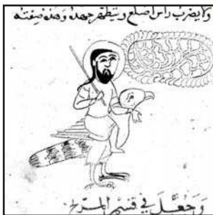
تصویر ۷. طلسم مشتری، مأخذ: کتاب سه‌بخشی جواهر الاحجار، خواص الاحجار و منافع الاحجار، ق ۱۰ و ۱۱ ه.ق. کتابخانه ملی فرانسه، MS arab.2775, fol.129.v پاریس