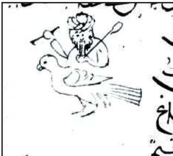
تصویر ۸. طلسم مشتری، مأخذ: همان fol.80.r

شده‌اند. به نظر می‌رسد برای احضار موکلین رسم تصویر آن‌ها ضروری است. فرهاد نیز تألیف دقایق الحقایق در قالب مجموعه‌ای از موضوعات مربوط به علوم غریبه همراه با تصاویر را با فالنامه‌های مصور قرن شانزدهم