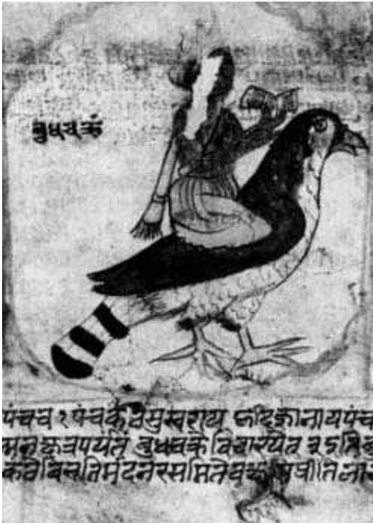
تصویر ۱۵. عطارد سوار بر غاز، مأخذ: همان: ۱۷