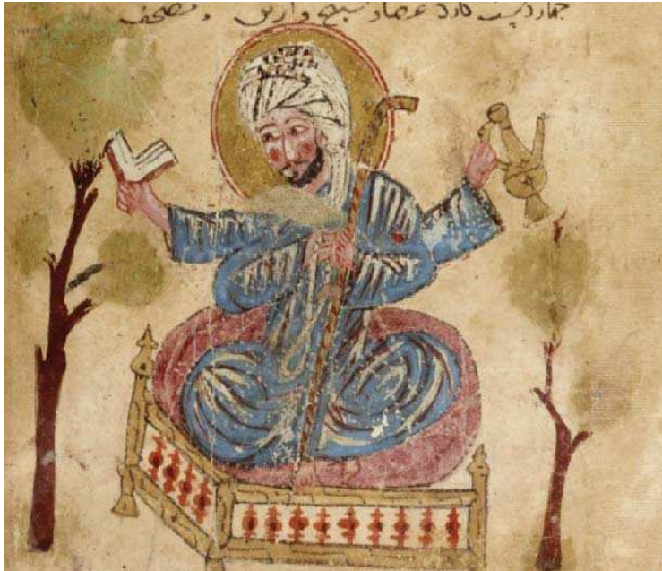
تصویر ۳. سیاره مشتری، مأخذ: همان: دقایق الحقایق. fol.109V.

طلسم، تعویذ و جادو را گردآوری، ترجمه و نگارش کرده است. در هیچ کدام از تحقیقات قبلی کتاب دقایق الحقایق تصاویر آن به طور کامل بررسی نشده است.