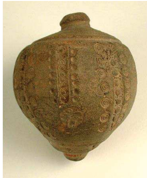
تصویر ۵. کوزه فقاع، نیشابور، ق ۱۱ و ۱۲ میلادی، مأخذ: موزه متروپولیتن 1: URL