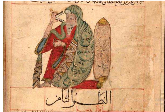
تصویر ۱. سیاره مشتری، مأخذ: عجایب المخلوقات قزوینی، ۷۸. MS cod.arab.464, fol. 16v، مأخذ: کتابخانه باواریا مونیخ.