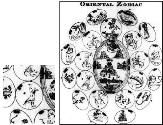
تصویر ۱۶. منطقه البروج در حال گردش به دور زمین و سایر سیارات. مأخذ: همان 18

مرکب ویشنو که با سیاره عطارد در ارتباط است. (تصویر ۱۷ و ۱۸ و ۱۹) به نظر نمی‌رسد این پرنده از عقابی که در غرب سیاره مشتری را با آن تصویر می‌کنند، الهام گرفته باشد. (Pingree, 1989: 8) در باقی تصاویر نیز پرنده تصویر شده شباهت بیشتری به غاز دارد تا به عقاب و کرکس. در تصویری که در دقایق الحقایق نیز وجود دارد، مرد سوار بر مرغابی تصویر شده است که غاز و مرغابی از یک خانواده هستند و تشابه