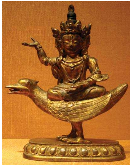
تصویر ۱۹. برهما سوار بر غاز، تبت، قرن ۱۷ و ۱۸ م. برنز، مأخذ: URL:4

دیگری مانند عطارد رسیده است و عطارد سوار بر این پرنده است. (Pingree, 1989: 6,7) اما نکته قابل توجه در تصویر ۸، مشتری سوار بر پرنده‌ای است که متن آن را کرکس معرفی می‌کند، اما پرنده تصویر شده با پرنده‌ای که عطارد سوار بر آن است (تصویر ۱۵) کاملاً مشابه است. این پرنده احتمالاً باید از غاز - مرکب برهما - خدای سیاره مشتری - الهام گرفته باشد و یا از گارودا پرنده افسانه‌ای،