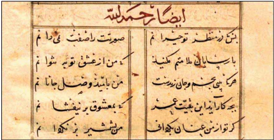
تصویر ۱: نمونه‌ای از نستعلیق اولیه، کلیات سعدی، ۷۸۴ ه.ق، ثبت شده در میراث جهانی یونسکو،