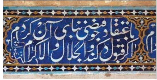
تصویر ۵. کتیبه کاشی معرق سردر آب انبار مصلی عتیق یزد، حاوی رقم: «کتبه عبدالوهاب».

حافظ که در تکیه میر اصفهان اجرا شده و در آخرین قاب‌بندی، رقم «کتبه العبد عماد الحسنی» را بر خود دارد (روح‌الامین: ۱۳۸۶: ۱۵۳). «در زمان میر، اکبر شاه هندی از هندوستان به دیدن شاه عباس آمد. هنگام مراجعت از صنایع اصفهان هر کدام چیزی خواست، من جمله از خطوط میر هم غزل معروف خواجه را، روضه خلد برین خلوت درویشان است، به طور کتیبه که به خط میر نوشته شده بود، جزو هدایا به او دادند، برد هندوستان. بعد از روی آن کرده برداشته آوردند در تکیه میر که هنوز باقی است» (اصفهانی، ۱۳۹۱: ۳۲۱) (تصویر ۲).