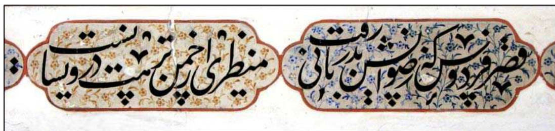
تصویر ۲. تکیه میر اصفهان، بخشی از کتیبه به قلم میر عماد

پس از میرعلی تبریزی، پسرش میرعبدالله و بعد از او میرزا جعفر تبریزی و اظهر تبریزی، در تکامل قلم نستعلیق کوشش‌ها کردند، تا نوبت به سلطان‌علی مشهدی، معروف به «قبله الکتاب» (عالی افندی، ۱۳۶۹: ۶۱) رسید. اساتید زیادی پس از جعفر و سلطان‌علی، در تکامل تدریجی نستعلیق موثر بودند، همانند میرعلی هروی و سپس بعد از حدود یک قرن، میرعماد حسنی (ف ۱۰۲۴ هـ ق). دقیقاً همین نکته که در قلم نستعلیق تکامل