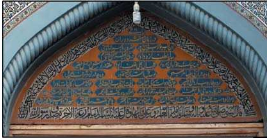
تصویر ۶. کتیبه حجاری سردر ایوان شرقی صحن عتیق حرم مطهر رضوی، حاوی رقم: «نمقه عبدالله» در گوشه سمت چپ کتیبه. ماخذ: نگارنده.