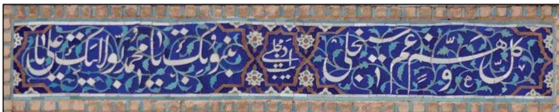
تصویر ۷. کتیبه کاشی معرق طرفین ورودی مسجد امام اصفهان، حاوی رقم: «ادیب مجلسی» ماخذ: نگارنده.

۱۳۷۸: ۳۶ - قلیچ خانی، ۱۳۸۶: ۶۱-۶۳ - هراتی، ۱۳۸۶: ۶ - خسروی بیژانم و یزدانی، ۱۳۹۰: ۶.