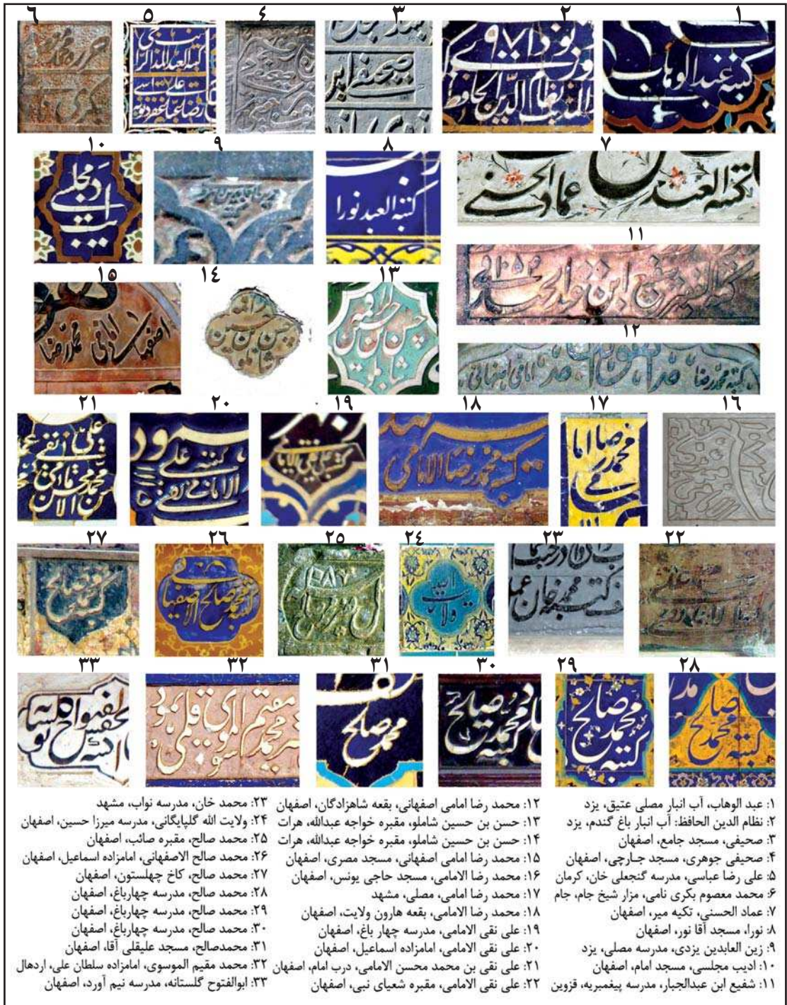
تصویر ۳. برخی از رقم‌های موجود در نمونه‌های جامعه آماری، ماخذ: نگارنده

توانایی شگفتی در نستعلیق خفی داشت. شاگرد او سلطان محمد نور نیز در همنشین کردن نستعلیق خفی و جلی مهارت داشت (سوچک، ۱۳۸۶: ۲۴ و ۳۱). خوشنویسان برجسته، مانند خطاطان دربار ابراهیم میرزا (وفات ۸۳۸ ه.ق.)، بایسنقر میرزا (وفات ۸۳۷ ه.ق.) و شاه طهماسب (حکومت ۹۳۰-۹۸۳ ه.ق.)، بارها در طراحی