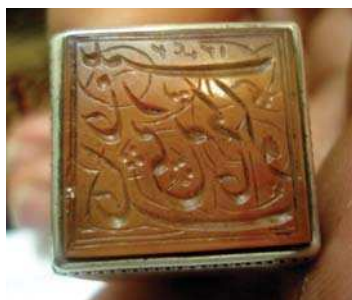
تصویر ۳۳. عبارت «خانم کوچک خانه نبی زینب» بر روی نگین انگشتر، مجموعه خصوصی ویسی