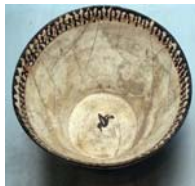
تصویر ۳. قرن ۴ و ۵ ه.ق شماره ثبت: ۴۰