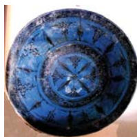
تصویر ۲۶. کاسه لاجوردی، ایران، مأخذ: همان، ۱۷۲.