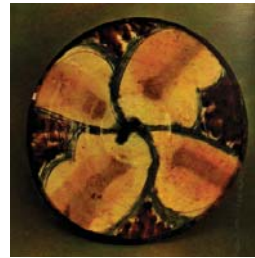
تصویر ۱۲. سفال با تزیین لعاب پاشیده، نیشابور، مأخذ: کریمی و دیگران، ۱۳۶۴: ۱۴۹