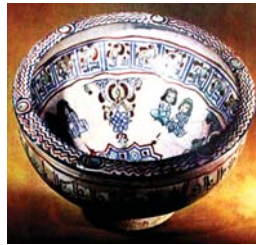
تصویر ۲۱. کاسه مینایی، ری، مأخذ: ماسلنیتسینا، ۱۳۷۴: ۳۱