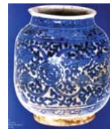
تصویر ۳۵. کوزه آبی سفید، ایران، مأخذ: فهروری، ۶۶: ۱۳۸۸