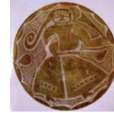
تصویر ۲۹. کاسه زرین فام، عراق، مأخذ: فهروری، ۱۴: ۱۳۸۸