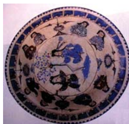
تصویر ۲۲. کاسه مینایی، ایران، مأخذ: گروبه، ۱۳۵۴: ۱۹۰

اواخر عصر سلجوقیان و شروع دوران خوارزمشاهیان در