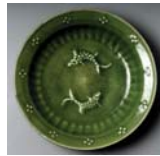
تصویر ۳۹. بشقاب توگرد سفالی از نوع سلادون، خراسان، مأخذ: کریمی و دیگران، ۲۷۶: ۱۳۶۴