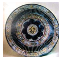
تصویر ۲۳. بشقاب توگرد زر اندود، سلطان آباد، مأخذ: کریمی و دیگران، ۱۳۶۴: ۲۵۳