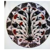
تصویر ۳۴. بشقاب منقوش چند رنگ ایز نیک، ترکیه، مأخذ: همان، ۳۰۸:

ظروف بال لعاب تکرنگ، زیر لعابی، زرین فام، مینا یا هفت رنگ و سفالینه‌های آبی و سفید است. نقوش به کار رفته بر سفال‌های این دوره شامل: نقوش حیوانی، نقوش گیاهی، انسان، خوشنویسی و نقوش طوماری و خطی است (فهروری، ۱۳۸۸: ۵۸). از میان نمونه‌های مورد مطالعه این دوره در جدول ۵ قده سفالی با تکنیک زرین فام مورد مطالعه قرار گرفته است.