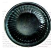
تصویر ۳۸. ظرف سلادون با لعاب زیتونی، احتمالاً کرمان، مأخذ: فهروری، ۷۶: ۱۳۸۸