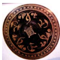
تصویر ۲۵. کاسه گلابه‌ای منقوش با تزئین طلائشان نیشابور، مأخذ: گروبه، ۱۳۵۴: ۸۷.