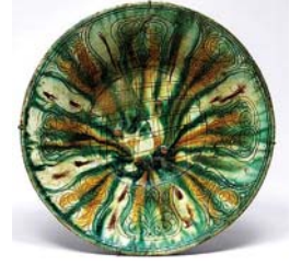
تصویر ۱۵. سفال با تزیین لعاب پاشیده و نقش کنده، نیشابور، مأخذ: دیماند، ۱۳۸۳: ۱۱۷

بودند و هنرمندان و صاحبان حرفه را در دربارها و مقر حکومت خود آوردند. همین گرایش سلاجقه به هنر و توجه به پروراندن هنرمندان در این عصر سبب شد تا هنرمندان به خلق و آفرینش هنری در تمامی جنبه‌ها علاقه نشان داده و تمام اهتمام خود را در زیبایی آثار و اجرای طرح‌های عالی به کار بندند (عباسیان، ۱۳۷۰: ۹۰). تزیینات ظروف سفالین عهد سلجوقی متنوع و شامل سفالی لعاب، سفالینه یکرنگ، سفال لاجوردی، سفال مینایی، سفال زرین فام، سفال با نقش زیر لعاب، سفال با نقش قالب زده و سفال سفیدرنگ مشبک بوده است.