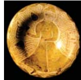
تصویر ۳۱. کاسه زرین فام، عراق، مأخذ: همان، ۳۶: