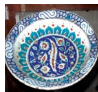
تصویر ۹. قرن ۱۰ و ۱۱ ه.ق شماره ثبت: ۹۰