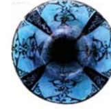
تصویر ۲۸. کاسه لاجوردی، ایران،