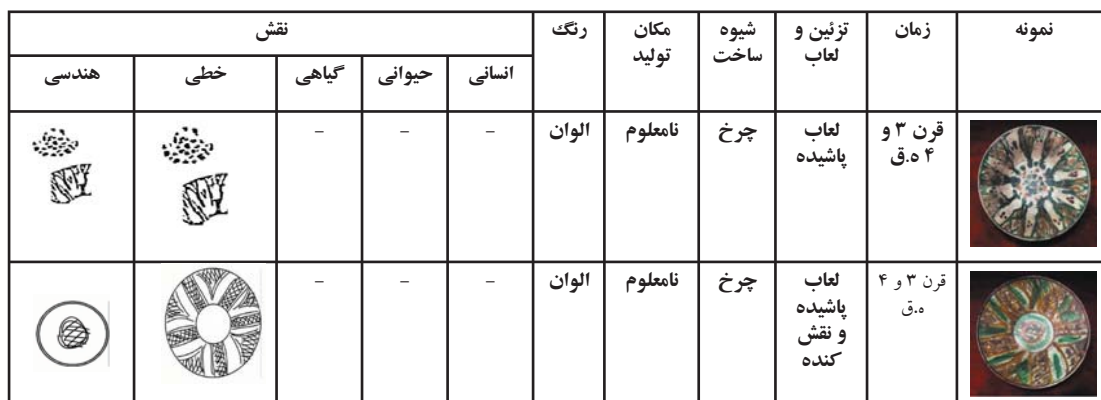
جدول ۱. بررسی نمونه سفالی شماره ۱ و ۲

دوره شامل: نقوش هندسی، نقوش گیاهی، نقوش حیوانی، نقوش انسانی، موج، خطوط موازی، اسلیمی، طوماری و انواع خطوط کوفی است (کریمی و دیگران، ۱۳۶۴: ۱۳). در این دوره شهرهایی چون زنجان، ساری، سمرقند، گرگان و نیشابور به مراکز مهم هنری شرق جهان اسلام تبدیل شدند (کیانی، ۱۳۷۹: ۲۶).