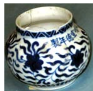
تصویر ۱۰. قرن ۱۰ و ۱۱ ه.ق شماره ثبت: ۱۲۳