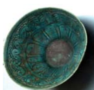
تصویر ۸. قرن ۱۰ و ۱۱ ه.ق شماره ثبت: ۵۰