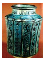
تصویر ۲۷. ظرف سفالی لاجوردی، سلطان آباد، مأخذ: کیانی، ۱۳۷۹: ۱۸۲

ه.ق نمایانگر اوج تکامل این اسلوب در آن زمان بوده است» (فریه، ۱۳۷۴: ۲۶۰ و ۲۶۱). نقوش به‌کاررفته بر سفال‌های مینایی تصاویر مربوط به نسخ خطی آن دوره، سوژه‌هایی از شاهنامه، مجالس بزم و شکار شاهان، رامشگران و نوازندگان و از میان داستان‌های عاشقانه داستان بهرام گور و آزاده و همچنین بیژن و منیژه بیش از هر نقش دیگری دیده می‌شود (گروبه، ۱۳۸۴: ۱۸۵). ساخت ظروف مینایی بیشتر درری متداول بوده و در اواخر قرن هفتم در شهرهای ساوه و سلطان‌آباد نیز ساخته می‌شود در همین دوره است که ظروف مینایی لاجوردی