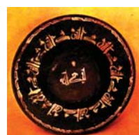
تصویر ۲۴. کاسه تیره رنگ طلائشان، نیشابور، مأخذ: همان، ۱۵۵.