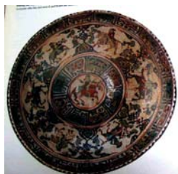
تصویر ۲۰. کاسه مینایی، کاشان، مأخذ: Fehervari, 2000: 142