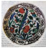
تصویر ۳۳. بشقاب منقوش چند رنگ ایز نیک، ترکیه، مأخذ: همان، ۳۱۰: 311