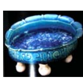
تصویر ۳۷. ظرف سفالی باتزیین سلادون، ایران