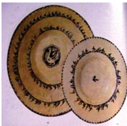
تصویر ۱۸. سفال با نقوش سیاه بر زمینه سفید با تکنیک زیر لعاب، نیشابور، مأخذ: گروبه، ۱۳۵۴: ۹۲