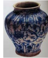
تصویر ۳۶. ظرف آبی سفید، مشهد، مأخذ: Fehervari, 2000: 283