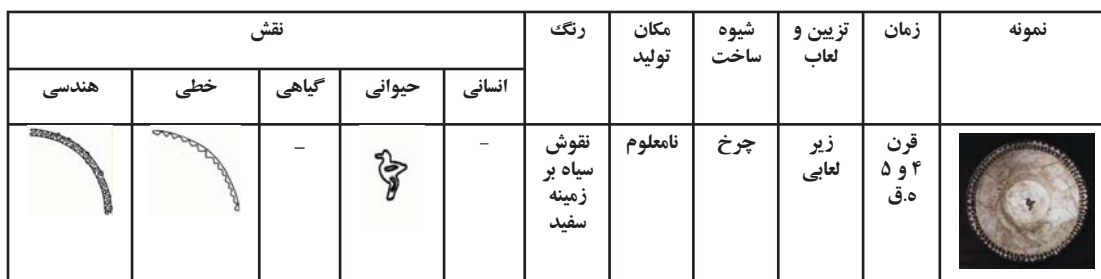
جدول ۲. بررسی نمونه سفالی شماره ۳، مأخذ: همان.

ظروف سفالین این دوران از نظر تکنیک لعاب متنوع‌اند مانند: سفال با تزئین نقش افزوده، کنده و قالب خورده، سفال با لعاب سربی یک‌رنگ با نقش کنده، سفال با لعاب سربی چندرنگ پاشیده و لعاب پاشیده و نقش کنده (کامبخش فرد، ۱۳۷۹: ۴۵۷). همچنین نقوش به کار رفته در سفال‌های این