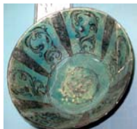
تصویر ۵. قرن ۶ و ۷ ه.ق شماره ثبت: ۶۳