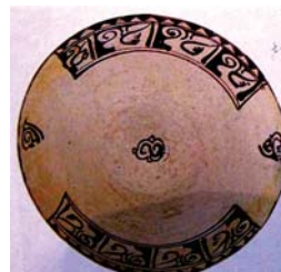
تصویر ۱۹. سفال با نقوش سیاه بر زمینه سفیدبا تکنیک زیر لعاب، نیشابور، مأخذ: گروبه، ۱۳۵۴: ۹۰