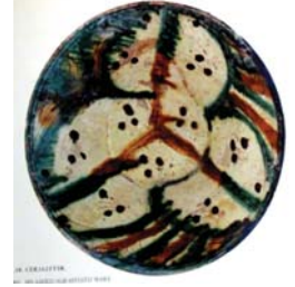
تصویر ۱۱. سفال با تزیین لعاب پاشیده، عراق، مأخذ: Fehervari, 2000: 45