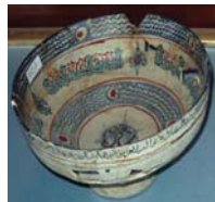
تصویر ۴. قرن ۵ و ۶ ه.ق شماره ثبت: ۱