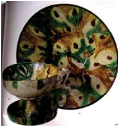
تصویر ۱۴. سفال با تزیین لعاب پاشیده و نقش کنده، نیشابور، مأخذ: گروبه، ۱۳۵۴: ۵۱