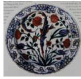
تصویر ۳۲. بشقاب منقوش چند رنگ ایز نیک، ترکیه، مأخذ: Fehervari, 2000: