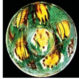
تصویر ۱۶. سفال با تزیین لعاب پاشیده و نقش کنده، نیشابور