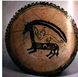
تصویر ۱۷. سفال با نقوش سیاه بر زمینه سفید با تکنیک زیر لعاب، نیشابور، مأخذ: رفیعی، ۱۳۷۷: ۲۱۳