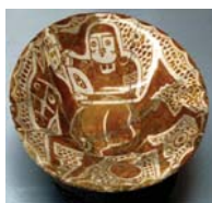
تصویر ۷. قرن ۸ ه.ق شماره ثبت: ۷۰