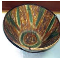
تصویر ۲. قرن ۳ و ۴ ه.ق شماره ثبت: ۹۶