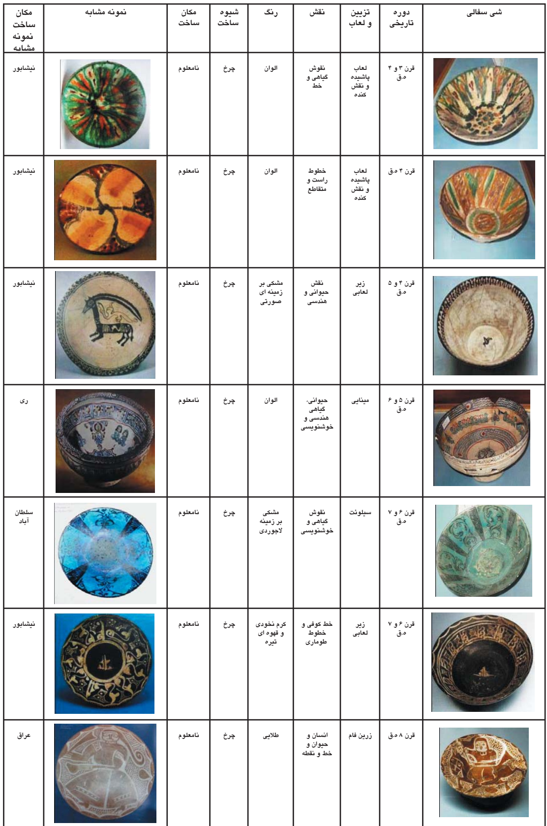
جدول ۸. نتیجه گیری تطبیق نمونه‌های سفالی مورد بحث با نمونه‌های مشابه، مأخذ: همان.