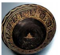
تصویر ۶. قرن ۶ و ۷ ه.ق شماره ثبت: ۱۰۶