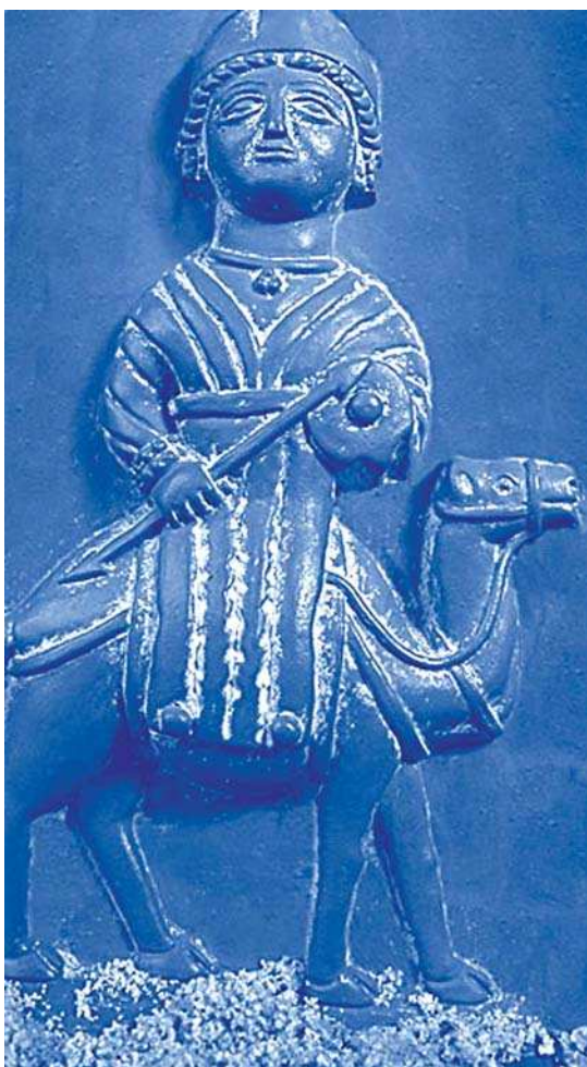
تصویر ۲- یکی از الهگان اقوام عرب (Al-Lat)، ۱۰۰ ق م

که در مقاله حاضر نیز به آن‌ها پرداخته می‌شود، این نقش به احتمال ایزدبانویی با نقش بافندگی دانسته شده است (مختاریان، ۱۳۸۸).