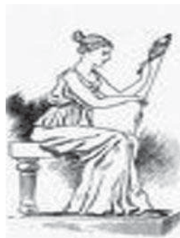
تصویر ۱۰- آتنا در حال نخریسی

البته این نکته را نیز نباید از نظر دور داشت که عمدتاً ایزدان و ایزدبانوان در هنر بین النهرین و سپس ایلام با نماد کلاهی شاخ دار نمایش داده شده اند (مانند ایشتار در تصویر ۸) و بانوی لوح مدنظر این نشانه را با خود به همراه ندارد. می توان توجیه این موضوع را فاصله زمانی این نوع شمایل نگاری تا زمان خلق لوح زن ریسنده دانست، اگرچه در برخی از مهرهای استوانه های این تمدن، ایزد تصویر شده کلاهی شاخ دار ندارد (مانند تصویر ۶).