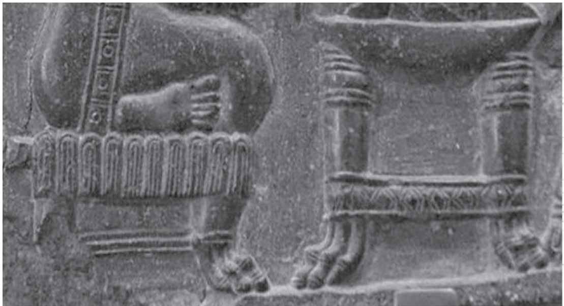
تصویر ۹- بخشی از لوح زن ریسنده ایلامی، پایه تخت و میز مقابل بانو تزیینی به شکل پای گربه سان (احتمالاً شیر) دارد؛ نک. تصویر ۱

پلنگ، یوزپلنگ) یکی از موضوعات تکرار شده در تصویرگری ایزدبانوان به ویژه در بین اقوام هند و اروپایی است (تصاویر ۵ و ۷ و ۸). اگرچه از نظر تاریخی و حتی جغرافیایی، الهگان به نمایش درآمده در این تصاویر در یک محدوده زمانی نیستند، چنان که الهه مادر چتل هویوک از هزاره ششم قبل از میلاد (تصویر ۷.ت) و نقاشی معاصر از دورگای هندی (تصویر ۷.چ)، نکته مدنظر عمومیت این موضوع در ادوار و تمدن های مختلف بوده است.