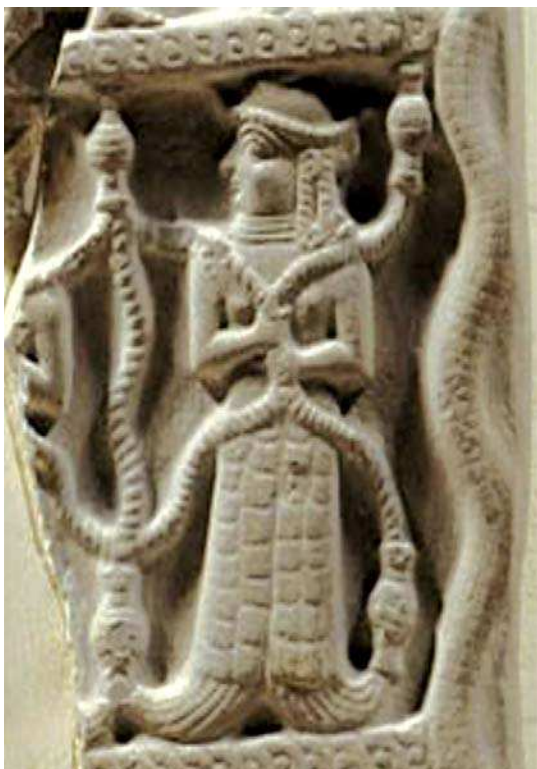
تصویر ۱۲ - نقش برجسته اونتاش‌گال، متعلق به قرن ۱۴ ق م

شایان توجه در این لوح است. چنان‌که اشاره شد، یکی از نمادها یا نشانه‌های همراه ایزدبانوان ماهی و درارتباط با آب و باروری است. در بندهشن نیز ماهی در فهرست چهار عنصر مؤنث جهان بیان شده است. این چهار عنصر عبارت‌اند از: آب، زمین، ماهی و گیاهان. البته این عناصر درارتباط با پرستش ایزدبانوان نیز در سراسر جهان باستان مطرح شده‌اند. برخی از ایزدبانوان مرتبط با ماهی در تمدن‌ها و دوره‌های تاریخی مختلف عبارت‌اند از: