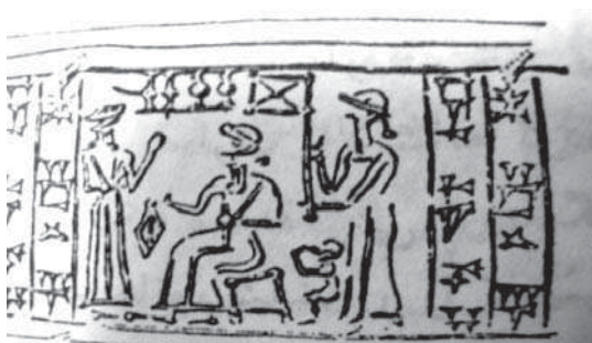
تصویر ۶- اثر مهر استوانه‌ای از چغازنبیل، شوش، قرن ۱۳ ق م نیایشگر در مقابل خدای نشسته بر تخت قرار دارد، دست خود را به منظور ادای احترام بالا برده و خدمتکار نیز با بادبزی در دست در پشت سر خدای تصویر شده قرار دارد. مأخذ: همان: ۵۲