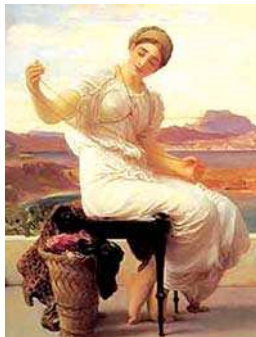
تصویر ۱۱- آرخنه یونانی بارشته نخ در دست، مأخذ: www.medeaslair.net

بانوی تصویر شده در لوح مذکور بر تختی با پایه ای به شکل پنجه های نوعی گربه سان (احتمالاً شیر) نشسته و این خود می تواند نشانه ای از اهمیت و جایگاه این بانو، بیش از زنی ریسنده، باشد (تصویر ۹).