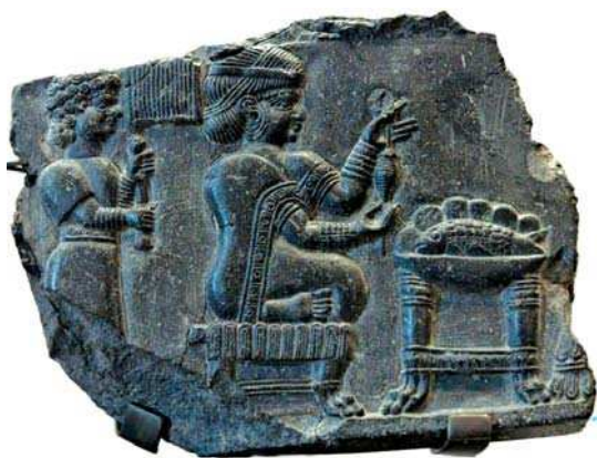
تصویر ۱- نقش نیم‌برجسته زنی در حال نخ‌ریسی، دوره ایلام جدید، قرون هفتم و هشتم پیش از میلاد، ارتفاع: ۰.۰۹۳ متر و عرض ۰.۱۳۰ متر. محل نگهداری: موزه لوور، مأخذ: Harper, 1992: 200

کتاب تاریخ هنر و باستان‌شناسی این لوح را تنها با عنوان اثری هنری از تاریخ ایلام جدید معرفی کرده‌اند و عناوینی چون زنی در حال دوک‌ریسی یا نخ‌ریسی، و زن ریسنده ایلامی برای آن برگزیده‌اند (آمی، ۱۳۸۴: ۶۸؛ مجیدزاده، ۱۳۷۰: ۹۳؛ پرادا، ۱۳۸۳: ۸۴؛ هارپر، ۱۹۹۲: ۲۰۰). تنها در مقاله‌ای با نام «اسطوره سرنخ» بر اساس عناصر تشکیل‌دهنده تصویر،