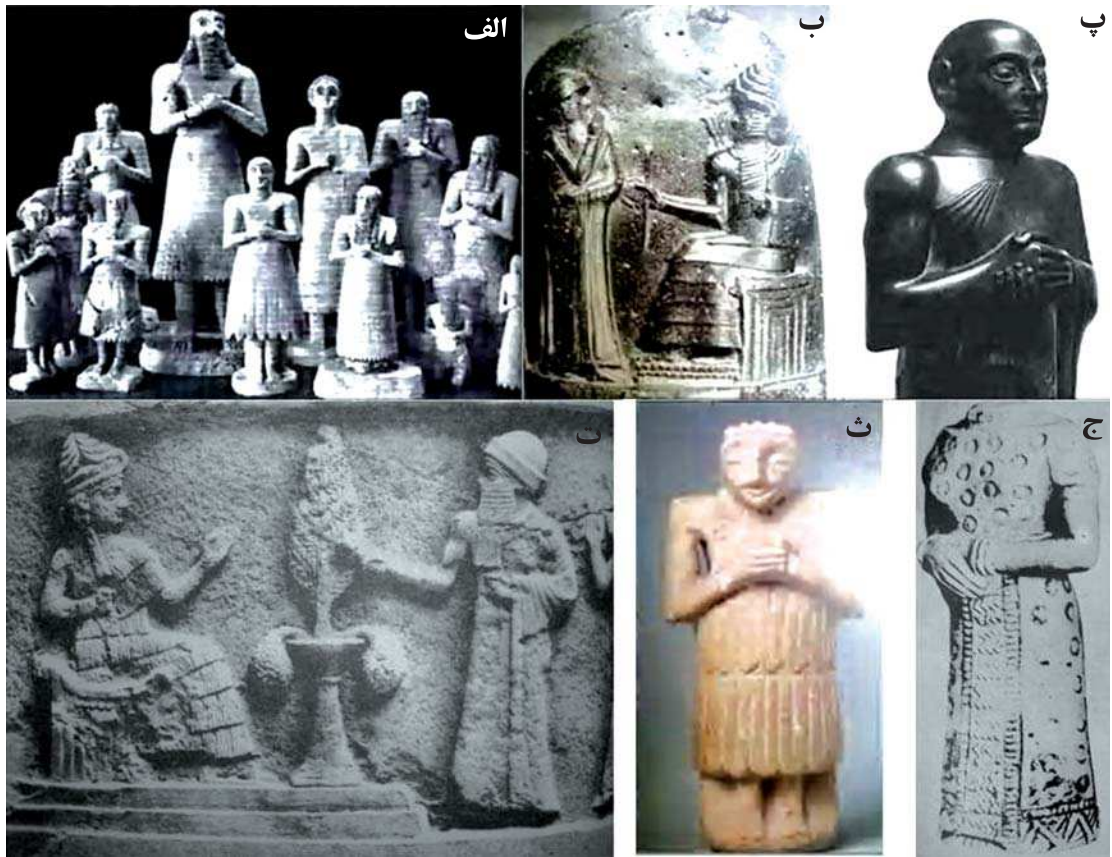
تصویر الف- پرستندگان معبد ابو در تل اسمر، حدود ۲۷۰۰ تا ۲۵۰۰ ق م مأخذ: www.luc.edu تصویر ب- لوح حمورابی متعلق به ۱۷۹۲-۱۷۵۰ ق م؛ مأخذ: Harper, 1992, p.160 تصویر پ- گویا، حدود ۲۱۰۰ ق م؛ مأخذ: www.luc.edu تصویر د- اورنامو پادشاه اور در مقابل الهه نین گال؛ مأخذ: صراف، ۱۳۸۴: ۱۶۱ تصویر ث- نیایشگر ایلامی متعلق به ۲۹۰۰-۲۳۳۴ ق م؛ مأخذ: Harper, 1992: p.83 تصویر ج- مجسمه وقف شده به معبد الهه پینیکیر در چغان نیل، قرن ۱۳ ق م، ارتفاع ۰/۱۰۱ متر؛ مأخذ: آمیه، ۱۳۸۴: تصویر ۸۶ (ترتیب تصاویر براساس دوره تاریخی است)