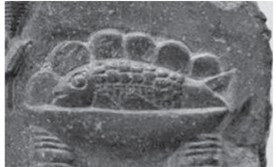
تصویر ۱۳- جزئیات لوح زن ریسنده ایلامی؛ نک. تصویر ۱.

به‌نظر مجیدزاده، این نقش نوارهای پرده شرابه‌داری از یک پنجره است (مجیدزاده، ۱۳۷۰: ۹۳؛ تصویر ۱۴ الف). شاید این قسمت، بخشی از دامن مطبق نیایشگری باشد که در جلوی ایزدبانو زانو زده است (تصویر ۱۴ ب؛ تصویر ۶). مسلماً به‌علت کامل نبودن لوح باقی‌مانده اظهار نظر در این خصوص بسیار دشوار است.