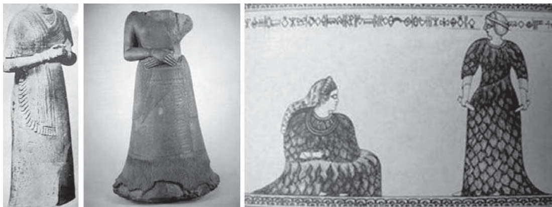
تصویر ۴- از سمت چپ: زن نیایشگر ایلامی (ابتدای هزاره دوم پیش از میلاد، ارتفاع: ۰.۰۹۴ متر؛ مأخذ: آمیه، ۱۳۸۶: عکس ۶۱ مجسمه ملکه نپیراسو (قرن سیزدهم پیش از میلاد، ارتفاع: ۱.۲۹ متر؛ مأخذ: Harper, 1992: 133) طراحی از نقش حک شده بر جام به دست آمده از حاجی آباد مرو دشت فارس با نقش الهه و پرستشگری که در مقابل او زانو زده است (دارای کتیبه آغاز ایلامی)؛ مأخذ: صراف، ۱۳۸۴: ۱۵۶