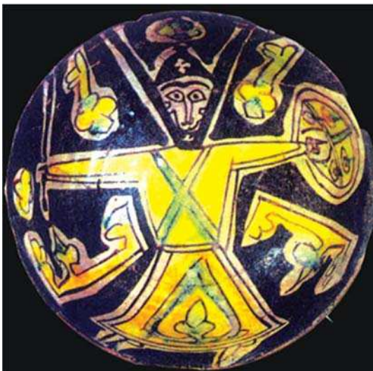
تصویر ۶-کاسه سفالی، دوران سامانی، نیشابور، موزه متروپولیتن، نیویورک، مأخذ: www.metmuseum.org