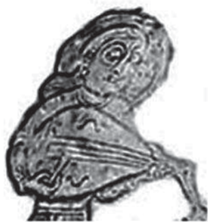
تصویر ۷ ب- بخشی از جزئیات تصویر صراحی نقره، دوره ساسانی، مأخذ: همان

گردن بلند نامنظم. علاوه بر تنوع در اشکال ظروف فلزی این دوره، نقوش تزیینی آن‌ها نیز موضوعات گوناگونی دارد. «موضوعات مهم تزیین این ظروف شامل: صحنه‌های شکار، جلوس شاه، اعطای منصب و ضیافت، رامشگری، صحنه‌هایی با ویژگی‌های مذهبی، پرندگان و گل‌ها و حیوانات افسانه‌ای است» (زمانی، ۲۵۳۵: ۲۳). اکثر این موضوعات، به ویژه داستان بهرام گور و نوازنده او آزاده، در فلزکاری و پارچه‌بافی و سفالگری و سایر رشته‌های هنری دوران اسلامی مورد توجه قرار گرفت. در این دوره، هنرمند علاوه بر استفاده از نقوش پیشینیان به پالایش و همچنین خلق نمونه‌های تازه‌ای از نقوش جانوری به‌ویژه نقش مایه‌های پرندگان دست زد. «نقوش حیوانی، که اغلب نقش ترکیبی دارند، مجموعه‌ای از جام‌ها را تزیین می‌کنند. یکی از این حیوانات پرنده اساطیری ایرانی سیمرغ است که در ترکیب آن شیر و سگ و شاهین و طاووس با هم در یک جا گرد آمده‌اند (تصویر ۱). پرنده‌گانی دیگر چون طاووس، کبوتر، عقاب و... نیز زینت بخش برخی از آثار سیمین ساسانی شده‌اند» (گیرشمن، ۱۳۵۰: ۲۱۹).