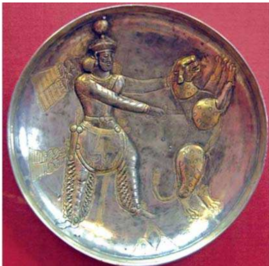
تصویر ۱۱- سینی نقره‌ای بانقش شاپور دوم در حال کشتن پلنگ، دوره ساسانی، موزه آرمیتاژ، مأخذ: www.hermitage museum.org