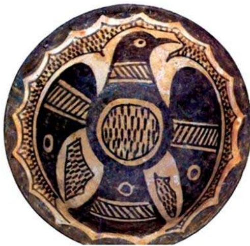
تصویر ۱۶- کاسه سفالین، دوره سامانی، نیشابور، موزه طارق رجب، مأخذ: Fehervari 2006, 63

۱- استیلزه، نقطه نشان (توحیدی ۱۳۸۶: ۲۶۳).