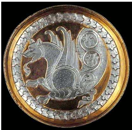
تصویر ۱- جام بانقش سیمین، دوران ساسانی، موزه بریتانیا

در زمینه تأثیر هنر ساسانی بر هنر اسلامی، با توجه به مداوم سنت هنری قبل از اسلام در دوره اسلامی، تحقیقات اندکی انجام شده است. در بررسی ادبیات هنر دوره باستان