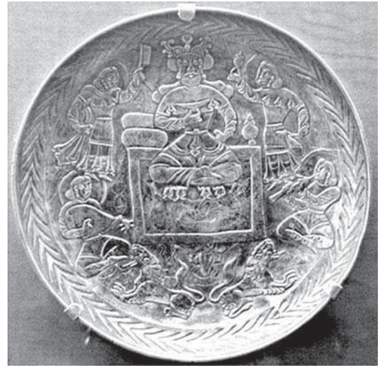
تصویر ۲- سینی نقره، صحنه جلوس خسرو اول (۵۷۹-۵۳۱ م)، دوران ساسانی، موزه ارمیتاژ، مأخذ: زمانی، ۲۵۳۵: ۱۵۶