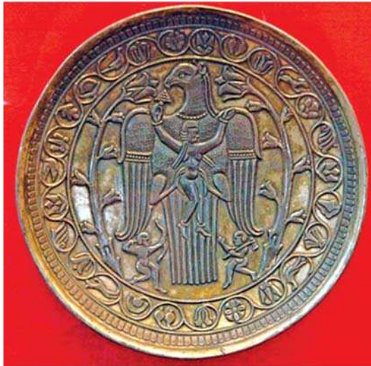
تصویر ۱۵- بشقاب نقره، دوره ساسانی، موزه آرمیتاژ