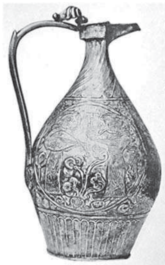
تصویر ۷ الف-صرافی نقره، دوره ساسانی