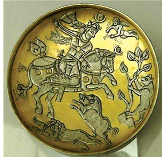
تصویر ۹- بشقاب نقره باتصویر شکار شاهانه، دوره ساسانی، موزه هنرهای اسلامی برلین، مأخذ: www.freunde-islamische-kunst

ژرف و آیینی را در ورای خود دارد، و این گنجینه کهن و ارزشمند از نقوش جانوران، انسان‌ها و گیاهان مختلف، میراثی برای هنر اسلامی در سده‌های بعد گردید» (پوپ و اکرم، ۱۳۸۷: ۹۱۵). البته بسیاری از جانوران واقعی، که به صورت تنها یا با دیگر هموعان خود کارمایه بخشی از طرح‌ها را می‌سازند، ممکن است هیچ معنای نمادینی نداشته باشند و تنها به این دلیل به نمایش درآمده باشند که ساسانیان مثل پیشینیان خود و جانشینان آنان در ایران، به جانوران علاقه‌ای وافر داشتند و این موضوع به تخیل آنان می‌افزود و محرک مهارت آنان در تصویر کردن آن‌ها بود. اغلب آن‌ها در حالتی آرام دیده می‌شوند، در آرامش