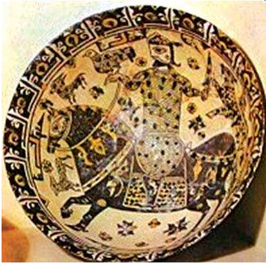
تصویر ۱۰- کاسه سفالین صحنه شکار، دوره سامانی، نیشابور، مأخذ: www.farhangsara.com