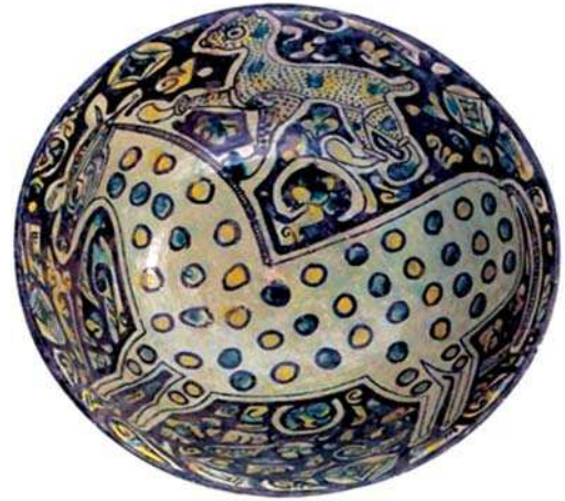
تصویر ۱۴- کاسه سفالی با نقش حمله چیتا بر اسب، دوره سامانی، نیشابور 51، Fehervari 2006