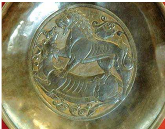
تصویر ۱۳- سینی نقره با تصویری که برگزینی حمله کرده است، دوره ساسانی، موزه آرمیتاژ .