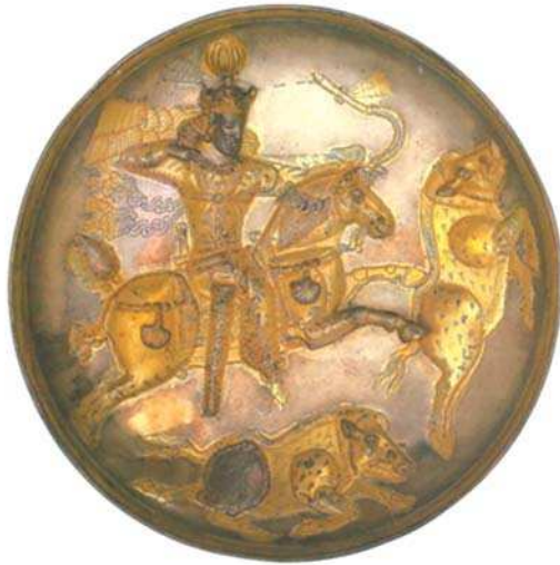
تصویر ۳- سینی سیمین بانقش شاپوردوم درحال شکار، دوران ساسانی، نگارخانه فریرآرت، مأخذ: فریه، ۱۳۷۴: ۷۰