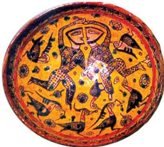
تصویر ۵- سفالینه بانقش دوپیکره، دوران سامانی، نیشابور، مأخذ: همپارتیان، ۱۳۸۴: ۴۷