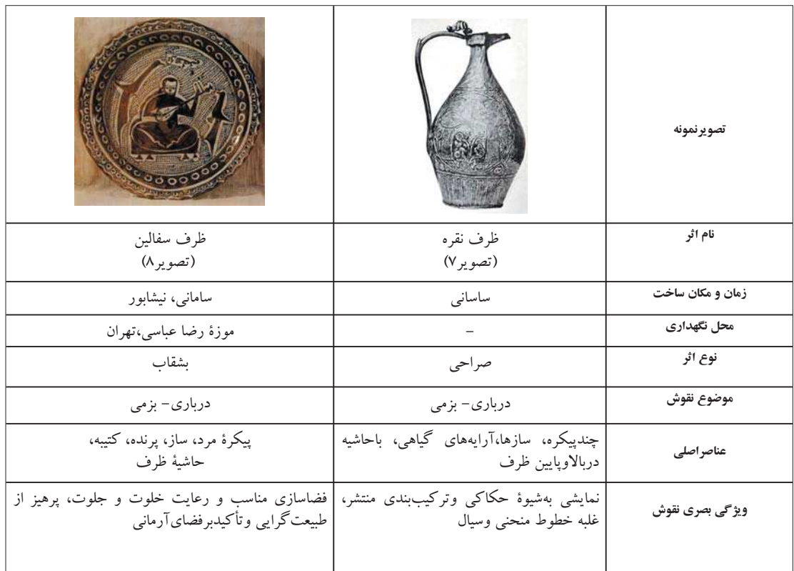
جدول ۱- تطبیق آثار بانقوش درباری-بزمی

در تصویر ۱۷ ظرفی فلزی به‌شکلی خاص از دوره ساسانی مشاهده می‌شود که بر روی بخشی از آن دو بز کوهی در دو طرف درختی با شاخ و برگ‌های متعدد دیده می‌شود. در دوره ساسانی درخت با شاخه‌های پیچان و متقارن نمایانگر درخت زندگی یا درخت مقدس بوده است. در حقیقت، درخت مقدس درختی است بهشتی و سودمند برای بشریت که معنویت خاصی در آن وجود دارد. هر جا بز کوهی دیده می‌شود نشان از آب و گیاه است. در اکثر پدیده‌های هنری آن‌اهیتا (الهه آب) در قالب بز کوهی مجسم شده است. گاهی نیز این جانور مظهر فرشته باران بوده