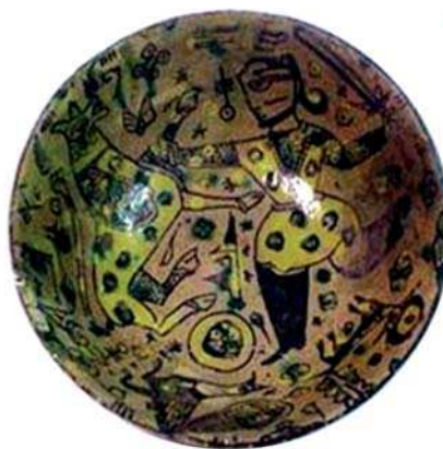
تصویر ۱۲- کاسه سفالی منقوش، دوره سامانی، نیشابور، مأخذ: www.animohtashemi.com

و مکتب اسلامی از این دوره به نحوی جدی سازگاری و اشتراکات فرهنگی خود را دنبال کرد (پوپ، ۱۳۶۶: ۸۱).