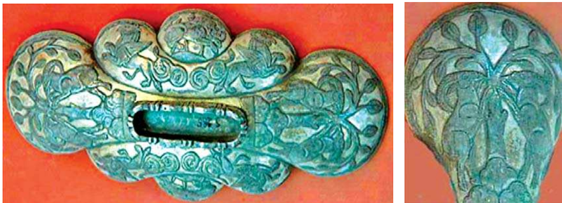
تصویر ۱۷- ظرف نقره‌ای چندتکه، دوره ساسانی، موزه آرمیتاژ، مأخذ: www.depts.washington.edu

ایران نیز نخستین سلسله‌های خودمختار ایرانی و مسلمان، از جمله سامانیان، از این منطقه برخاستند و توانستند هویت فرهنگی و ملی ایران را حفظ کنند» (بیات، ۱۳۵۶: ۱۶۹).