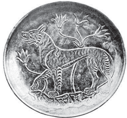
تصویر ۴- ظرف نقره باتصویر جانوری خارق العاده، دوره ساسانی

در محدوده هنرهای صناعی، ظروف زرین و سیمین ساسانی مهارت و سلیقه هنرمندان این عصر را نمایان می‌سازند. این ظروف بخشی بسیار مهم از هنر درباری ساسانی را تشکیل می‌دهد. این ظروف به سبب ظرافت و نفاست در خارج از مرزهای ایران نیز مورد توجه بوده‌اند. در ساخت مصنوعات فلزی دوره ساسانی نقره بیش از فلزات دیگر مورد توجه بود، ولی طلا و مفرغ نیز استفاده می‌شد. مردم از این ظروف سیمین تقلید می‌کردند و این ظروف را از مفرغ و شیشه یا از سفالینه‌های لعابدار می‌ساختند. شکل‌های منتخب برای ساخت این ظروف باید متناسب با شکوه دربار ساسانی و کاربرد آن‌ها می‌بود. معروف‌ترین اشکال این آثار عبارت‌اند از: بشقاب بزرگ مدور، سینی مدور با لبه‌های برگشته و مضرس، کوزه بیضوی با پایه بلند شیپوری‌شکل و گلدان گلابی‌شکل با