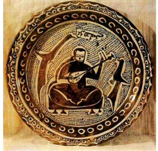
تصویر ۸- بشقاب سفالین، دوره سامانی، نیشابور، موزه رضاعباسی