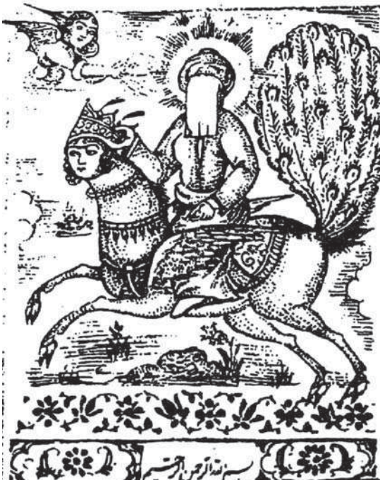
تصویر ۴. صحنه ای از معراج، دوره قاجار، چاپ سنگی ۱۲۶۵ هـ. ق، مأخذ: مارزلف، ۱۳۹۰: ۲۴۱.