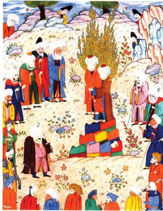
تصویر ۳. پیامبر (ص) در کنار حضرت علی (ع) در غدیر خم از کتاب احسن الکبار، دوره صفوی ۹۸۸ هـ. ق.

یکی از موضوعات مورد توجه و از اصلی‌ترین مضامین هنر دینی است. قدیمی‌ترین شمایل‌نگاری از چهره مقدسین در اسلام، به دوره ایلخانی نسبت داده شده است. در دوره ایلخانی، به تاثیر از هنرمندان چینی و بیزانسی که به نقاشی دین خود را تبلیغ میکردند و با توجه به منش و سهل‌گیری حکمرانان مغول، هنرمندان نقاش به خلق نگاره‌هایی با مضامین مذهبی چون، میلاد پیامبر(ص)، مبعث آن حضرت، عید غدیر خم و... و همچنین شرح قصص و روایات همت گماشتند (شایسته فر، ۱۳۸۶: ۹۸).