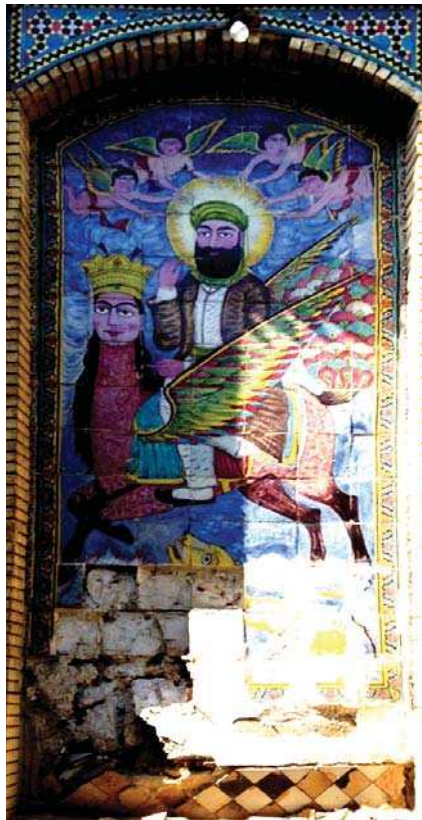
تصویر ۱۴. معراج پیامبر (ص)، خانه پاکبازی، شیراز