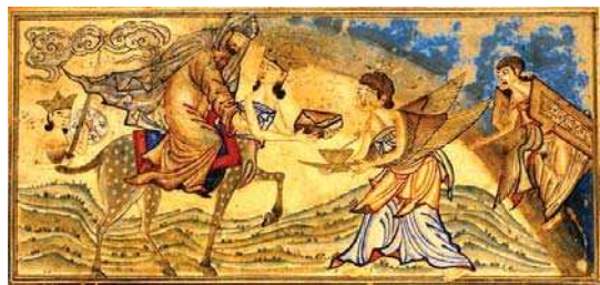
۱۲. معراج پیامبر (ص) سوار بر براق، جامع التواریخ رشیدی، ۱۳۰۷ م.