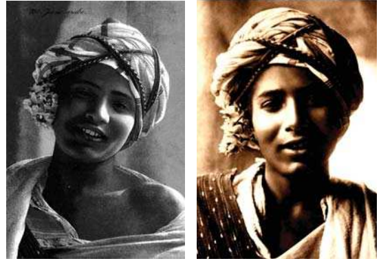
تصویر ۸. پرتره جوان تونس، رادولف لنت، مجموعه موزه الیزه، لوزان، مأخذ: سنتلیورن، ۲۰۰۶: ۱۸.

می‌گذاشت (موهای سر را از وسط به دو قسمت تقسیم می‌کرد). رنگ (پوست) او بسیار درخشان بود. پیشانی گشاده ای داشت. ابروهای او پر مو، کشیده و ناپیوسته بود. رگی بین دو ابروی او بود که به گاه خشم برجسته و پر خون می‌شد. بینی او دارای برجستگی خاصی بود. البته در برخی روایات نیز ابروان ایشان را پیوسته توصیف کرده‌اند (مجلسی، ۱۳۹۲: ۱۴۷). در دو شمایل کار شده (شماره ۷ و ۵ بجز شمایل سقاخانه مشیر) ابروان حضرت کشیده و اندکی میان دو ابرو پر است.