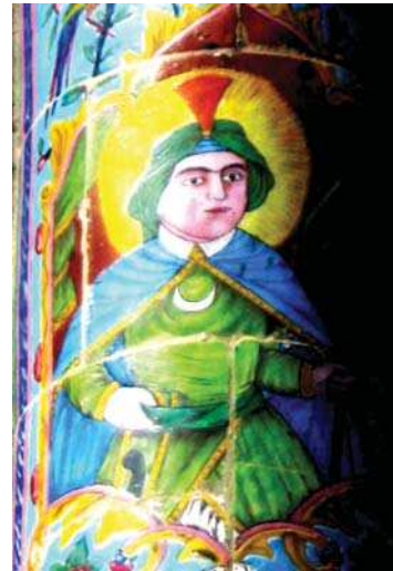
تصویر ۵. شمایل حضرت محمد(ص)، خانه ضیاییان، شیراز، مأخذ: نگارندگان.

ووجه کشف ناشده روح ملی و جهان بینی را بازسازی کنیم» (کیپنبرگ، ۱۳۷۲: ۱۴۶). شمایل‌نگاری در بناهای دوره قاجار شامل انگاره‌هایی از واقعیت‌های تاریخی - دینی و داستان‌های اسطوره‌ای - حماسی فرهنگ ایران را در نظر بینندگان نسلیها در توالی زمان مجسم می‌سازد. کاشیکاری هفت رنگ بویژه در دوران قاجار راه مناسبی برای دیوارنگاری شد.