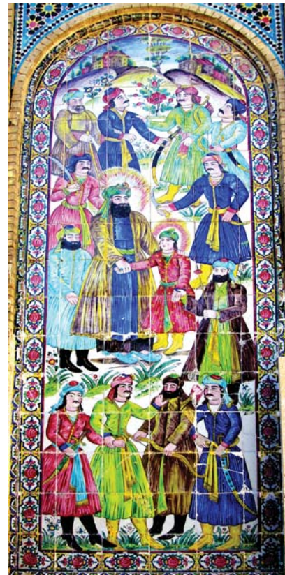
تصویر ۲. کاشی‌نگاره با داستان حضرت یوسف، خانه عطروش

آندره گدار در کتاب هنر ایران به وجود مکتبی از نقاشان کاشی ساز محلی در شیراز اشاره دارد که