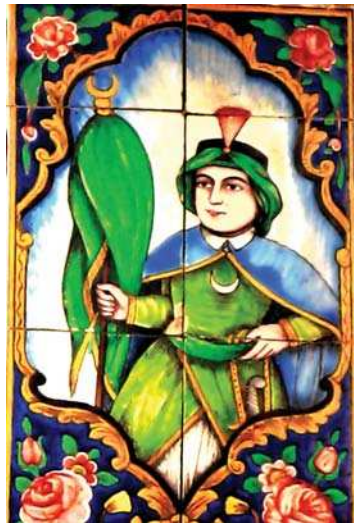
تصویر ۶. شمایل حضرت محمد(ص)، سقاخانه مشیر، شیراز، مأخذ: همان.