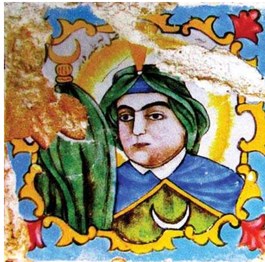
تصویر ۷. تک چهره حضرت محمد(ص)، خانه ضیاییان، شیراز، مأخذ: همان.

همچنین نماد کشورهای عربی - اسلامی است. ایشان دست راست خود را بر شال کمر نهاده‌اند. در پایین کادر تصویر دسته شمشیری دیده می‌شود. هاله پیامبری در اطراف سر مبارک قرار دارد. هاله نماد نور الهی و نیروی ترکیبی آتش و طلای شمسایی یا نیروی الهی است؛ نور ساطع از ناحیه قدس خداوند، نیروی معنوی و قدرت نور، تقدس، قر، دایره شکوهمند، نبوغ، فضیلت، صدور قوه حیاتی موجود در سر، نیروی حیاتی فرد و نور متعالی معرفت» (کوپر، ۱۳۸۰: ۳۷۸). همین الگوی تصویری در شمایل‌نگاری سقاخانه مشیر - تصویر ۶ دیده می‌شود، با این تفاوت که هاله دور سر آن به شکل نور منتشر و به رنگ مهتابی است.