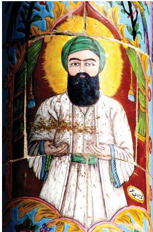
تصویر ۱۰. تمثال مبارک حضرت محمد(ص)، خانه ضیاییان، شیراز، مأخذ: همان.

خدا را از از سرزمین‌های مختلف و از بهشت و جهنم بیان می‌کند پیامبر (ص) سوار بر براق است. در تصاویر به جا مانده براق معمولاً چهره زنانه دارد و تاجی بر سر داشته با دو بال اندامی کشیده و بی مو و همچون اسب در حال تاختن است (سگای، ۱۳۸۵: ۱۱؛ تصویر ۱۲)