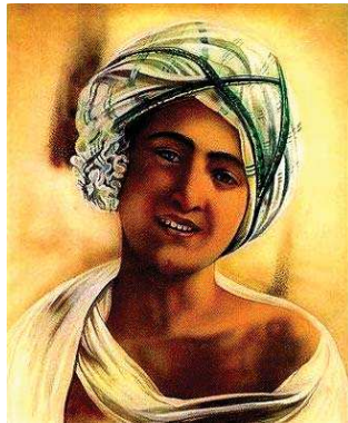
تصویر ۹. نقاشی از جوانی حضرت محمد(ص)، چاپ تهران، از مجموعه سنتلیورن، مأخذ: همان، ۱۹.