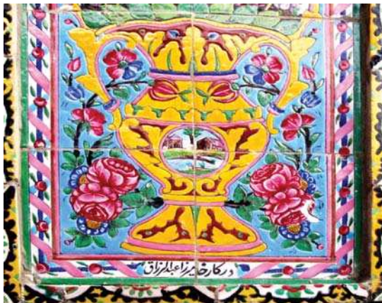
تصویر ۱۱. بخشی از کاشی خانه ضیاییان که سازنده را میر عبدالرزاق معرفی می‌کند.