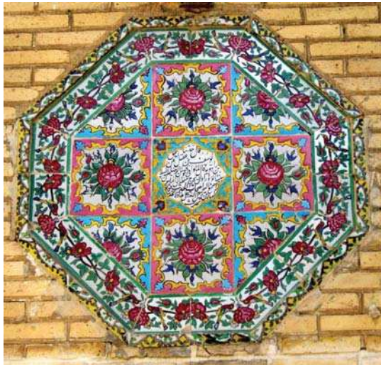
تصویر ۱. کاشی هفت رنگ، تزیینات طاقنما، دیوار حیاط خانه ضیاییان، شیراز، مأخذ: نگارندگان.

در مورد شمایل‌نگاری مسیحی و ارتدوکس مقالاتی