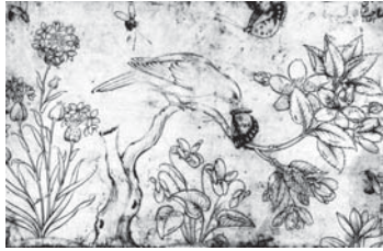
تصویر ۱۵. شفیع عباسی-۱۱۵۶ق- مکتب صفوی- اصفهان