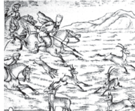
تصویر ۱۳. تحفة الذاکرین- ۱۲۸۰ ق (پناه بردن آهوان به حرم محترم امیرالؤمنان)- مأخذ: همان