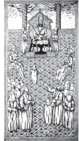
تصویر ۳. تحفة‌الذاکرین، ۱۲۸۰ ق (ورود اسرای امام مجید به مجلس یزید پلید)