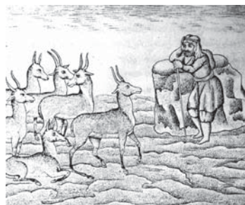
تصویر ۱۰. تحفة الذاکرین - ۱۲۸۰ ق (تکلم آهوان با عبدالسلم در مصیبت امام شهید تشنه کام)