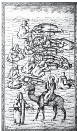
تصویر ۲۳. تحفة الذاکرین - ۱۲۸۰ق (عبور اهل بیت بی پناه از میان قتلگاه)

آنکه شخصیت امام سجاد(ع) در قسمت سمت راست و یک سوم تصویر در نقطه طلایی، در قسمت جلو قرار دارد. در حالی که قامت آن بزرگتر تصویر شده، توجه بیننده را به خود جلب می‌کند. حضرت زینب در راستای ایشان قرار گرفته و با اندازه‌ای کوچک‌تر توجه بعدی را شامل می‌شود. اما در قسمت‌هایی که صحنه‌های نبرد اتفاق می‌یافتد مانند تصویر ۱۴ و ۲۱ این ترکیب ممتد به فراخور التهاب صحنه به صورت مورب دیده می‌شود. پیکره حضرت علی اکبر و قاسم تصویر ۲۱ در بالاترین قسمت این مارپیچ، در کانون طلایی عروج معنوی، بر روی نقطه‌ای که عملکرد آنها را در جریان اوج التهاب نبرد نشان می‌دهد، قرار گرفته است.