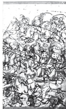
تصویر ۲۱. تحفة الذاکرین-۱۲۸۰ق- (مبارزه بنی هاشم در جنگ مغلوبه)- مأخذ: همان

انسانی، دیده می‌شود. در اغلب حیوانات به خصوص اسبها، چشمها از حالت طبیعی، کمی بزرگتر شده و جهت نگاه آن به سوژه اصلی کاملاً مشخص است. در این طراحی‌ها ارتباط انسان‌ها با حیوانات کاملاً بارز است و جزو لازمات واقعه است. گاهی بعضی از قسمت‌های حیوانات مانند نگارگریهای ایرانی، با ظرافتی بیش از فرم طبیعی طراحی شده که آن را به هنر ایرانی نزدیک تر می‌کند. تصویر ۱۰ پای آهوان را نشان می‌دهد که نازک‌تر از فرم طبیعی پرداخت شده است، این گونه در طراحی‌های هنرمندان مکتب صفوی به خصوص آثار رضا عباسی و شاگردان وی دیده می‌شود (ت ۱۵).