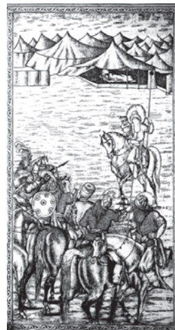
تصویر ۵- تحفة الذاکرین، ۱۲۸۰ ق (شهادت علی اصغر در آغوش پدر) مأخذ: همان

از وقایع عاشورا عیان گشته بود و در دوران کریم خان زند اجرای مجلس تعزیه به طور رسمی اجرا می شد. اساس گفتگوی تعزیه شعر است یعنی متن آن از شعر ساخته و پرداخته شده است. اوج شعر پارسی مقارن است با ظاهر شدن اشعار مذهبی. در شبیه خوانی، پرده خوانی و صورت خوانی از شعر استفاده می شود اما تعزیه بیش از سایرین از این صنعت ادبی استفاده می کرد. در دوره قاجار شعرسرایی برای تعزیه و شعائر مذهبی خود شیوه ای نوآندیشی به حساب می آمد. «ریشه تعزیه و منبع الهام سراینندگان تعزیه نیز همان کتبی است که در زمینه مقاتل نوشته شده است از جمله کتاب روضه الشهداء» (همایونی، ۲۶). تعزیه نویسان با الهام از کتابهایی که در اختیار عموم مردم بود تعزیه نامه ها را می نوشتند. این برداشت بیشتر از کتابهایی مانند نوحه الاحزان نوشته محمدیوسف دهخوآقانی، جلاء العیون مجلسی و یا مهمتر از آن تحفة الذاکرین بیید بود. در این کتاب سبک روایی و داستان پردازی به شکل شرح مصائب دیده می شود که به سبک و شیوه تعزیه بوده و برخی از تعزیه نویسها شعرهای آن را عیناً در نسخه های خود می نویسند. این کتاب ترکیبی از نظم و نثر است با اشعاری نسبتاً ساده که قابل فهم برای توده مردم کوچک و بزرگ است و با اشعار بلند و فصیح تفادت دارد. بسیاری از تعزیه ها به صورت چاپ سنگی و مصور روی کاغذهای گاهی و یا کتب مختلف منتشر می شدند تا در اختیار سایر افراد قرار گیرد. تصاویر این کتاب نیز همانند تعزیه ها صحنه های نبرد و یا موقعیت های خاص داستان را نشان می دهد. شرح تصویری به شیوه ای پویا زبان شعر را کامل می کند.