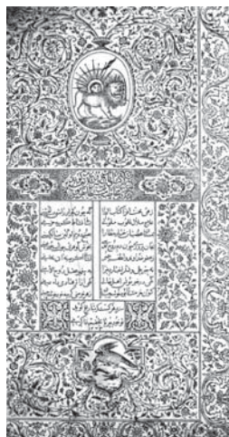
تصویر ۱. تحفة لنکرین، ۱۲۸۰ ق