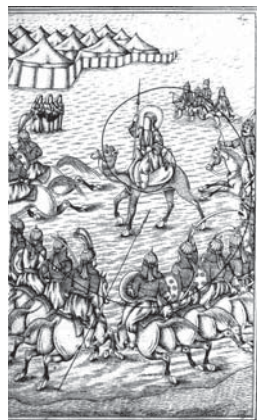
تصویر ۲۲. تحفة الذاکرین-۱۲۸۰ق- (راست: شترسواری سفینه نجات به عزم شریعه فرات-چپ: مبارزات حضرت عباس با سپاه شقاوت اساس)