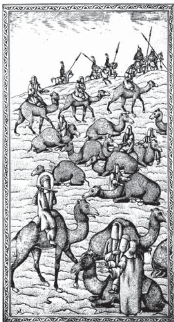
تصویر ۱۱. تحفة الذاکرین - ۱۲۸۰ ق (شتر سواری اهل بیت امام عطشان) - مأخذ: همان