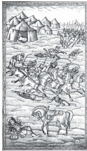
تصویر ۲۰. تحفة‌الذاکرین، ۱۲۸۰ق (مبارزه امام مجید با سپاه پلید)