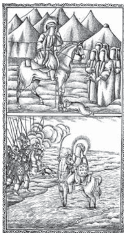
تصویر ۷- تحفة الذاکرین - ۱۲۸۰ ق (افتادن سکینه بر سم ذوالجناح پدر تشنه)