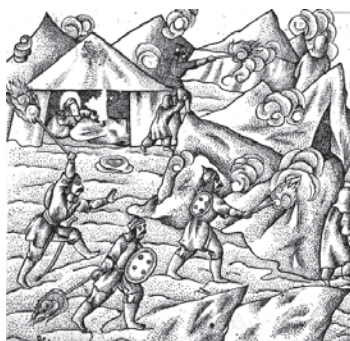
تصویر ۱۷. تحفة الذاکرین - ۱۲۸۰ ق (بیداد سپاه دین تبا، بعد از شهادت فرزند رسول الله و سوزاندن خیمه گاه)