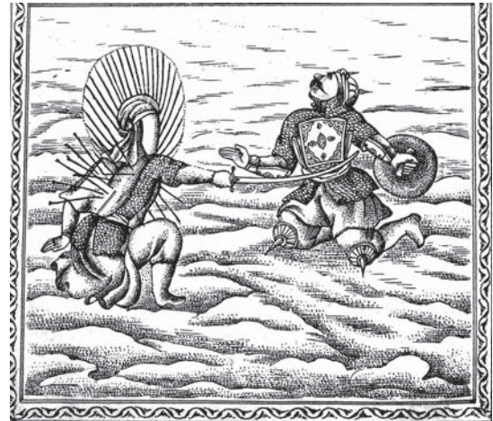
تصویر ۸. تحفة‌الذاکرین - ۱۲۸۰ ق

آنچه در تصاویر این کتاب قابل ذکر است نمایش صحنه‌های کربلا به شیوه نمایشی و روایی با الهام از هنر ایرانی، اروپایی و نقاشی قهوه‌خانه‌ای و حتی نمایش تعزیه است. البته تحفة‌الذاکرین در چند ویژگی متفاوت از پرده‌های نقاشی قهوه‌خانه‌ای است. رنگ در این کتاب‌ها به دلیل محدودیت چاپ مطرح نمی‌شود، این خصوصیت با خطه‌ای هاشوری و یا سایه‌زنی با شیوه نقطه‌گذاری، خط‌های متوازی و متقاطع ایجاد می‌شود. کلیت تصاویر شبیه به نقاشی‌های قهوه‌خانه‌ای است. هر دو از بیان تصویر و آن هم به شیوه نقاشی قاجار تبعیت می‌کنند و بروز هنر اروپایی و فرنگی کاری در هر دو دیده می‌شود. واقعه کربلا و شخصیت‌های آن در تعزیه به خصوص در هنر شبیه خوانی و نقالی از نمادهای رنگی با مفاهیم نیروی اسلام و یا سپاه یزید و یا رهایی پرده به عنوان