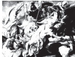
تصویر ۱۴. پتر پل روبنس- (شکار شیر)- ۱۶۱۸م