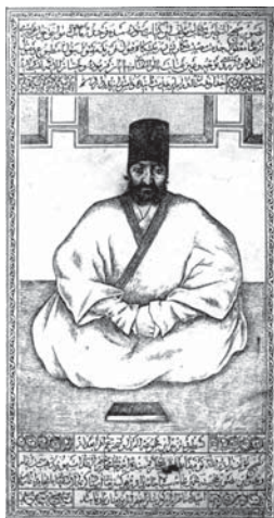
تصویر ۲. تحفة الذاکرین، ۱۲۸۰ ق

با توجه به بررسی‌های انجام شده، در کتاب تصویرسازی داستانی در کتابهای چاپ سنگی نوشته اولریش مارزلف، درباره کتاب تحفة الذاکرین چند خطی ذکر شده، همچنین علی‌بوذری در کتاب چهل طوفان تصاویر کتاب چاپ سنگی طوفان البکاء را که درباره ائمه است جمع‌آوری و تا حدی شرح داده است. مقاله‌هایی مانند تصویرسازی مذهبی نوشته پرویز اقبالی در ماهنامه کتاب ماه هنر شماره ۱۰۶، سال ۸۶ - «حضور واقعه عاشورا در نگارگری صفویه و قاجار» نوشته مهنار شایسته‌فر در ماهنامه کتاب ماه