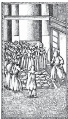
تصویر ۱۸. تحفة الذاکرین - ۱۲۸۰ ق (اظهار معجزه امیرمؤمنان در میان یهودان)