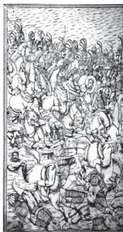
تصویر ۶- تحفة الذاکرین، ۱۲۸۰ ق- تصویر در دو صفحه روی هم با فاصله سفید (راست: اجماع لشکر اشراق در شهادت امام حسین (ع) - چپ: مبارزه حضرت سیدالشهدا با سپاه یزید) - مأخذ: همان