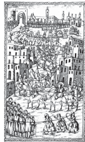
تصویر ۱۹. تحفة‌الذاکرین، ۱۲۸۰ق (ورود اهل بیت امام به شام)

فرشتگان: فرشتگان و دیوان مخلوقاتی متعلق به دنیای غیرمادی هستند و طراحی‌های آنها نیز فرای بعد انسانی ترسیم می‌شود. در این کتاب شاخصه دیگری که برگرفته از شیوه هنر غربی است، فرشتگان و دیوان هستند که در صحنه دادگاهی و مجازات در کنار انسان‌ها نشان داده شده‌اند. همانند نقاشی‌های کلیساها در عصر رنسانس، به شکل انسان‌های برهنه، سیمای کودکانه و دارای بال‌های کوچک با موهای تاب دار به صورت اسطوره‌های باستانی در روم، ترسیم شده‌اند. آنها قامت‌ها و دامن‌هایی کوتاه و پرچین دارند. معمولاً در هنر نقاشی ایرانی، مخلوقات با بدن‌های کاملاً برهنه ترسیم نشده‌اند. در این نقاشی‌ها طراح فرشتگان را همچون موجودات دست بر سینه و مطیع ترسیم کرده است. همان‌طور که در تصویر ۹ می‌بینیم، در صحنه دادگاه اخروی با حضور ائمه (ع) در بالای صفحه، تصویر خورشیدی تابناک با چهره انسان‌گونه سیمای زن، همانند شیر و خورشید نماد حکومت قاجار گوشه سمت چپ ناظر بر ماجراست. اعتقادات میتراپی از باورهای باستانی به‌عنوان فرمانروا داوری روان را پس از مرگ بر عهده دارد (آموزگار و تفصیلی، ۱۳۹۱: ۱۲۱). در این صحنه، وجود خود را به‌عنوان ناظر به‌خوبی نشان می‌دهد. بعضی پیکرها مانند فرشتگان عذاب با قلمگیری‌های پرت‌تر و نقطه‌گذاری‌های متراکم‌تر طراحی شده‌اند.