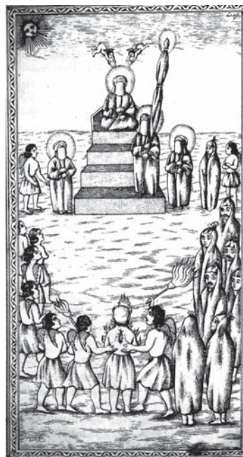
تصویر ۹. تحفة الذاکرین - ۱۲۸۰ ق (نشستن پیامبر (ص) بر منبر - عذلب بر سعد لعین به فرمان رسول مبین)

داستان با اندازه‌ای بزرگتر و درشت‌تر و مابقی بانسبتهای کوچک‌تر ترسیم می‌شود اما در این کتاب با تبعیت از شیوهٔ اروپایی، نسبت بین شخصیت‌ها تفاوت چندانی ندارد و ویژه کردن آنها از طریق پوشش صورت و لباس، محل قرار گرفتن در صفحه و تا حدی درشت اندام بودن و یا در اغلب موارد هالهٔ نور نشان داده می‌شود. حرکت اندام‌ها و حیوانات، نسبت به پرده‌های نقاشی نرم‌تر و طبیعی‌تر و از بافت برای تکمیل فرمها استفاده بیشتری شده است. به دلیل آنکه هنرمند امکان این را داشته تا هر صحنه را به طور مجزا مطرح کند این ویژگی را دارد که عناصر زمینه و معماری در صحنه ظاهر شود و حرکت پیکره‌ها و حیوانات را تکمیل کند همچنین برعکس پرده‌های نقاشی، بعضی تصاویر این کتاب، مملو از عناصر اضافی نیست و فضاهای خالی به خوبی خود را نشان می‌دهد مانند یک صحنه نمایش تعزیه که فقط عناصر لازم برای روایت در آن جای می‌گیرد.