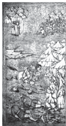
تصویر ۱۶. تحفة الذاکرین - ۱۲۸۰ ق (اجماع زنان بادیه در سنگباران علی اکبر)

امامان و پیامبر هاله نور سفیدی است که به واسطه بافت زمینه و خطوط مشعشع کوچک در اطراف این هاله‌ها، سفید و مؤکد شده است. گاهی نیز هاله نور به شکل خطوط مرکزگرا و شعاعی نشان داده می‌شود. همچنین به غیر از حضرت علی اکبر(ع) که در سن نوجوانی است، شخصیت‌های اصلی مثبت و یا حتی منفی دارای محاسن هستند اما در افراد منفی مانند یزید، ریشها پریشان و درهم ترسیم شده‌اند. به جز سه تصویر، آن هم جزئی، مابقی در بسیاری از صحنه‌ها از اندازه تأکید مقامی در شخصیت‌ها مانند نقاشی‌های قهوه‌خانه‌ای استفاده نشده، به گونه‌ای که اندازه پیکره امام حسین(ع) و یا حضرت ابوالفضل(ع) با سایر شخصیت‌ها مثبت یا منفی یکسان بوده و فقط پیکره اباعبدالله کمی درشت‌تر طراحی شده است. در تمامی صحنه‌هایی که در کنار امام حسین به میدان نبرد می‌رود با نیزه و شمشیری برافراشته و رو به بالا (حتی زمانی که تیرباران شده است) به نشانه نبرد در راه حق تعالی، با قامتی محکم سوار بر اسبی که با تمام قوت ایستاده، پرشتاب و یا خرامان حرکت می‌کند. در صحنه‌های گفتگوی امام با لشکریان یزید و یا با خانواده خویش، قسمت اعظم صفحه تصویر به شخصیت ایشان اختصاص یافته و فضای متمرکزی برای آن بزرگوار طراحی شده است (ت ۷ و ۵).