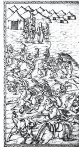
تصویر ۴. تحفة‌الذاکرین، ۱۲۸۰ ق (به میدان رفتن پسر عبدالله ابن جعفر)

تحفة‌الذاکرین دارای یک مقدمه ۲ ، پنج بیان و یک خاتمه است. مقدمه بر مبنای شش مطلب و هر بیان شامل دوازده مجلس است و خاتمه نیز شش مقصد دارد. بیان اول: درباره شهادت غلام سید سجاد(ع)، وقایع شهادت مادر وهب، وقایع بعثت و خصایص ایشان، رویدادهای مکه، شهادت آن امام عباد و احوال آن آفتاب سپهر در افول به گودال، عناد کوفیان، عروج سیدالشهداء(ع) به اوج افلاک و گفتگوی ذوالجناح، هجرت آن حضرت به مدینه، بی‌ادبی به قرآن مجید توسط یزید پلید و بعضی وقایع مجلس یزید و عتاب جناب سید سجاد(ع) به یزید ملعون،