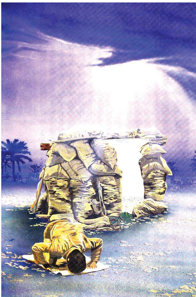
سنگر عشق، طراح سيد حميد شريفی آل هاشم، مأخذ: عالی، ۱۳۶۷: ۵۲

تحليل گفتمان پوستره‌های جنگ ایران و عراق براساس آراء مربع ايڤنولوژيک «وندايک» (مطالعه موردی پوستره‌های با موضوع مقاومت) / ۱۸۳- ۱۹۷