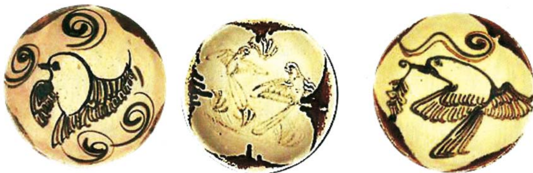
تصویر ۲. سفالینه‌های دوره تانگ، چین، قرن ۹ میلادی.

برای پرنده از خصوصیات نقوش پرندگان است. از انواع پرندگان متداول در این سفالینه‌ها سیمرغ، کبوتر، پرندگان آبی و عقاب هستند.