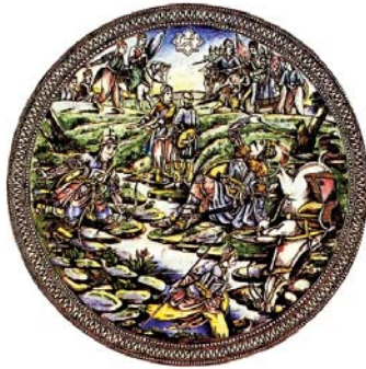
تصویره. نگاره میانی میز کاشی با عنوان «نبرد رستم و اشکبوس»