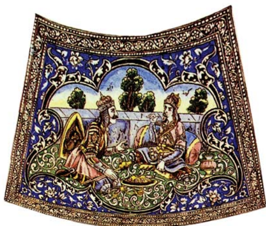
تصویر ۸. نگاره «دیدار گوردن با گیو»