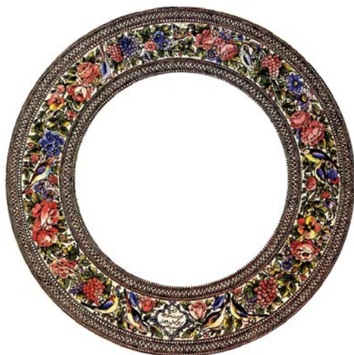
تصویر ۳. تزئینات حاشیه نگاره مرکزی با بهره‌وری نوآورانه از هنر گل و مرغ