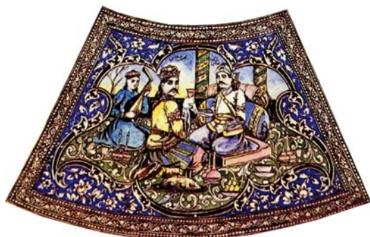
تصویر ۷. نگاره «ضیافت شاه عباس و خرم چینی»

تاریخی و تمامیت ارضی ایران آغاز شده بود. در این دوران، ایران اگرچه مستقیماً تحت استعمار نظام‌های سیاسی قدرتمند قرار نگرفت؛ اما به نوعی متأثر از استعمار نوبی آنها بود. شکل گرفتن جنگ‌های اول و دوم با روس‌ها، تحمیل معاهدات ننگین گلستان و ترکمنچای از سوی آنها، خلأ قدرت داخلی، برپا شدن بساط ملوک‌الطوایفی و یکه‌تازی منورالفکران متجدد و غرب‌گرا در اعطای امتیازات مختلف تجاری به خارجی‌ان همگی سبب گردیدند تا عزت و روحیه اعتماد به نفس ایرانیان در هم شکسته شده، ایران تدریجاً به ملتی نیمه‌مستعمره و کانون کشمکش‌های منفعت‌جویانه نظام‌های سیاسی روسیه و بریتانیا مبدل گردد و تماماً حاکمیت سیاسی و اقتصاد ملی‌اش به شدت تهدید و تحدید شوند (سلامی، ۱۳۹۷: ۲). در چنین شرایطی، اگرچه «نظام سیاسی قاجاری خود به لزوم اقتباس از تمدن اروپایی و کسب معرفت از فرهنگ مغرب زمین جهت همگام شدن با پیشرفت‌های فناوریانه آنها مجاب گردیده بود» (تقوی، ۱۳۹۳: ۱۷۴). لیکن هنرمند با جریانی همراه شد که عده‌ای