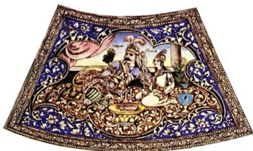
تصویر ۱۰. نگاره «دیدار حسین‌کرد با یوسف ثانی»