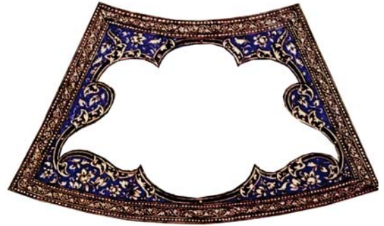
تصویر ۴. تزئینات حاشیه نگاره‌های اطراف در ترکیبی از نقوش اسلیمی و ختایی

بودجه لازم برای خرید آثار هنری در ایران و سازوکاری برای انتقال آنها از طریق دریا (از مسیر خلیج فارس به انگلستان) را تأمین نمود. همچنین چون ارتباط نزدیکی با درباریان و در رأس قدرت ایران (ناصرالدین شاه) داشت آزادانه و در دو مرحله، آثار هنری را خریداری و بدون هیچ مشکلی و معاف از هرگونه عوارض گمرکی به لندن منتقل کرد (کاووسی، ۱۳۹۸: ۲۰-۲۱). با اتمام مأموریتش در ایران و منصوب شدن به ریاست موزه ادینبرو، از آنجایی که جمع‌آوری و مستندسازی هنرها و صنایع معاصر ایران را نیز مدنظر داشت. لذا طی آخرین سفرش به سال ۱۸۸۷ مجموعه‌ای کامل از انواع کاشی‌ها و ظروف سرامیکی را به استادکار برجسته عهدناصری، علی محمد اصفهانی سفارش داد (مکی‌نژاد، ۱۴۰۰: ۳۴). میز کاشی‌نگاره مورد مطالعه از همین مجموعه می‌باشد که به سه دلیل خوانش آن حائز اهمیت است: اولاً سایر آثار صناعی و اشیاء هنری عتیقه‌ای که به موزه ویکتوریا و آلبرت برده شده بودند؛ پیشتر در راستای تأمین نیاز مادی و معنوی مردمان ایران زمین و