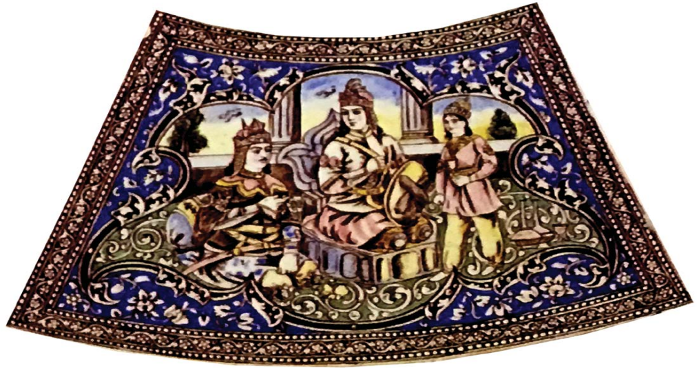
تصویر ۱۳. نگاره «ضیافت قهرمان و قهتران»

مالیات‌ها، فرامینی برای امرا و حکام درباره رفتار مناسب با مردم صادر کرد و بهبود شرایط را در حسن رفتار و رعایت عدل و انصاف به آنها متذکر شد (عابدینی مغانکی، ۱۳۹۷: ۱۱۲). بر این اساس، هنرمند باردرگر میراث سیاسی ایران و جلوه‌هایی از خاطرات سیاسی سرزمین‌اش را در تمثال شخصی به تصویر می‌کشد که در رأس هرم قدرت دارای صفاتی همچون عدالت، تدبیر و مدیریت سیاسی و اجتماعی بوده و بر فضای حکومتی دینی، فارغ از هرگونه استبداد و دیکتاتوری دلالت می‌ورزید. به گونه‌ای که با دربرداشتن چنین خصائل پسندیده و زیبایی به یوسف ثانی شهره گردیده بود و پهلوانانی همچون حسین کرد شبستری در محضرش آماده به خدمت بودند. البته لازم به ذکر است که چون وی در سن نوجوانی (ده سالگی) بر رأس هرم قدرت دودمان صفوی جلوس می‌نماید؛ علی‌محمد نیز وی را کم سن و سال و در لباس شاهزادگان درباری ترسیم می‌کند. تمثال پهلوان را هم در حالی که گریزی به دست چپ گرفته، کاملاً فیگوراتیو و سه‌رخ در لباس رزم و کلاهخودی با دو پر بزرگ بر سر ترسیم می‌نماید. چنانکه حالتی قدرتمندانه و هویتی یگانه از تن‌پوش رزم پارسی را تداعی می‌بخشد. زیرا «هر چیزی از این تن‌پوش حامل اندیشه‌ای می‌باشد که در واقع، خود عامل اصلی طراحی و تولید بوده است» (متین، ۱۳۸۳: ۳۸). بارزترین نمود چنین اندیشه‌ای را در طراحی و استعمال کلاه دیهیمی می‌توان یافت. «پیشانی‌بندی طلایی که بلندی آن به پنج سانتیمتر می‌رسد؛ با پر پرندگان، برگ‌ها و گل‌هایی آرایش می‌یافت و بر سر دلیران جنگاور به نشانه پیروزی و افتخار بسته می‌شد» (غیبی، ۱۳۸۴: ۱۲۷). فلذا در این نگاره هم هنرمند از چنین نشانه‌های بصری غافل نمانده و بر سر هر دو