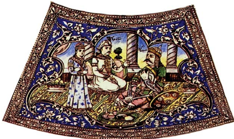
تصویر ۶. نگاره «دیدار شاه عباس با حسین کرد شبستری»