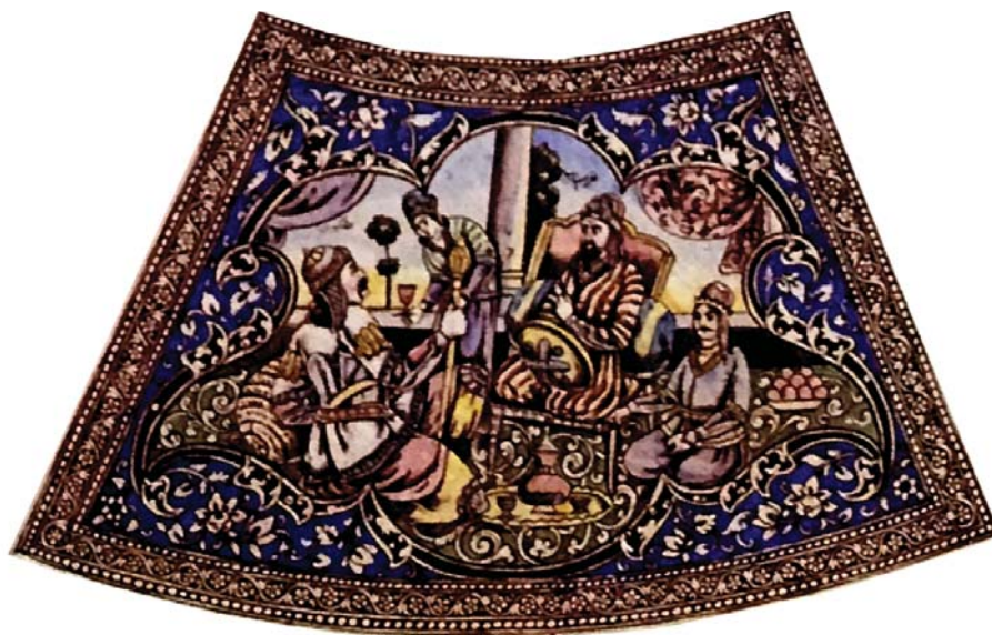
تصویر ۱۲. نگاره «دیدار افراسیاب با اشکبوس»

به مثابه پدیده‌های فرهنگی و بستر ساز تداوم بخش به چنین هویتی استفاده می‌کند و با نشان دادن سهم و نقش آنها در تکامل تمدن و فرهنگ ایرانی، درصدد برمی‌آید تا این باور را ایجاد کند که امروز هم ملتش مانند گذشته فعال و بالنده هستند.