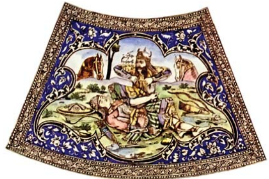
تصویر ۹. نگاره «نبرد رستم و سهراب»

تزئینات میز شامل دو بخش کلی است: تزئینات حاشیه نگاره