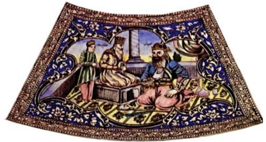
تصویر ۱۱. نگاره «ضیافت هوشنگ و تهمورث»

از آنجایی که بخشی از ساختار هویت ملت ایران را تاریخی شکل می‌دهد که بیانگر آغازین دوران شکل‌گیری روح جمعی و دیرینه ایرانیان بر مبنای اسطوره است (زارع‌زاده، ۱۳۹۳: ۲۷۰). لذا در تجسم بخشی به میزکاشی نگاره هنرمند کوشیده تا به واسطه ترسیم تمثال شخصیت‌های تاریخی - افسانه‌ای، نیمه افسانه‌ای یا واقعی - در هیأت اسطوره‌ای