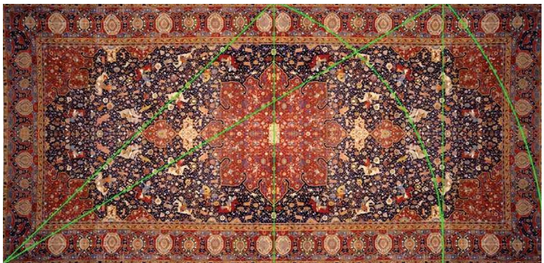
تصویر ۱. قالی شکارگاه، (۶۹۰ × ۳۶۰) سانتی‌متر، موزه پولدی پتزولی میلان، نسبت طلایی به دست آمده از مربع شاخص، مأخذ: نگارندگان

طراحی این قالی‌ها کاملاً متأثر از سبک و شیوه کاری هنرمندان همان دوره بوده است. هنرمندان با تأثیرپذیری از شعر و ادبیات ملی، همچنان که به کار تجلید و نقاشی و تذهیب مشغول بوده‌اند، طرح و نقش قالی را نیز نقاشی و رنگ‌آمیزی کرده‌اند. «استقرار نگارگران، طراحان و هنرمندان در دربار و کتابخانه‌های سلطنتی و ارتباط تنگاتنگ آن‌ها با یکدیگر، خود باعث اشتراک، تأثیر و گاهی تلفیق نقوش در آثار هنری مختلف این دوره به‌ویژه در تزیینات بنا، تزیینات کتاب و قالی شده است» (رشیدی، شکرپور، ۱۳۹۶: ۹۶). دلیل دیگر این ادعا، نوشته‌های پوپ در کتاب «شاهکارهای هنر ایران» است: «چون تذهیب‌کاران معمولاً مستعدترین و زبردست‌ترین طراحان کشور بوده‌اند اغلب برای طراحی هنرهای دیگر نیز از ایشان استفاده می‌شده است و در نقش قالی یا هر مورد دیگری که نوع عالی تزیین مورد تقاضا بوده، همین استادان به کار طراحی می‌پرداختند.» (پوپ،