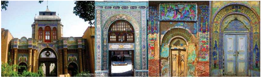
تصویر ۱. به ترتیب از راست به چپ: سردر حمام حاجی، حمام گلزار، تکیه معاون الملک، سردر باغ ملی