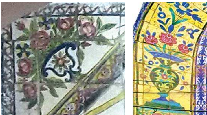
تصویر ۶. تصویر گل و گلدان در سردر حمام حاجی رشت (راست) و حمام پهنه (چپ)، مأخذ: همان

خورشید، فرشته و گلدان دیده می‌شود (تصویر ۱).