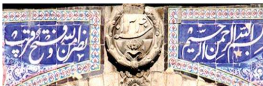
تصویر ۱۵. کتیبه‌نویسی در سردر باغ ملی

نمایند» (براتلو و همکاران، ۱۳۹۱). تسلیحات: در میان نمونه سردرهای منتخب، نقوش مربوط به تسلیحات در سردر ارگ سمنان، سردر باغ ملی و حمام حاجی وجود دارد (تصویر ۱۴). نمایش قدرت نظامی در قالب ترسیم نوین‌ترین تسلیحات جنگی زمان، یکی از ویژگی‌های کاشی‌کاری دوره قاجار می‌باشد. این تسلیحات اغلب در کنار یادست سربازان قاجاری به نمایش گذاشته می‌شدند. مسلسل، تفنگ شصت‌تیر، تفنگ سرنیزه‌دار، توپ و گلوله‌های آن از جمله تسلیحات ترسیم شده در این کاشی‌کاری‌ها هستند. کتیبه‌نویسی: در سردر تمام نمونه‌های مطالعه شده به جز باغ ارم، کتیبه‌هایی قابل مشاهده است. برخی از این کتیبه‌ها عبارت‌اند از: آیهٔ حصن؛ بسم الله الرحمن الرحیم؛ آیه و ان یکاد؛ نصرمن الله و فتح قریب (تصویر ۱۵، تصویر ۱۶، تصویر ۱۷).