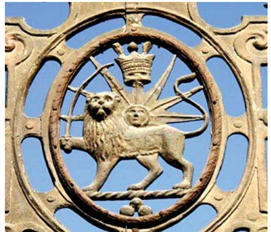
تصویر ۴. نماد شیر و خورشید و تاج شاهی در درهای فلزی سردر باغ ملی