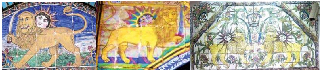
تصویر ۵. از راست به چپ: نماد شیر و خورشید در حمام پهنه، حمام گلزار، تکیه معاون الملک، مأخذ: همان

به چشم می‌خورد. «در بالای درب ورودی اشعاری به خط نستعلیق خوانا و استادانه نوشته شده است. ازاره این سردر را کاشی‌هایی با گل‌های سفید و لاجوردی به ارتفاع یک متر تشکیل می‌دهد» (آرمان سفر؛ تصویر ۲).