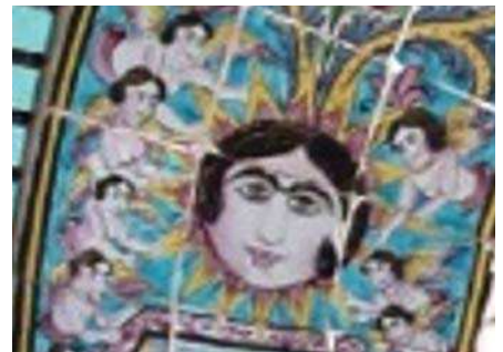
تصویر ۷. نماد فرشته (کوپید) در سردر تکیه معاون الملک

طراحان بنا خواسته‌اند با ترسیم فرشتگان نوعی تقدس و حالتی روحانی به بنا بدهند» (بمانیان و همکاران، ۱۳۹۰). «ریشه ظهور نقش فرشته، در فرآیند تاریخی خویش، از نماد فروهر آغاز می‌شود. با نقش سیمرخ همگام می‌شود و در قالب نقش فرشته جلوه‌گر می‌شود» (اختیاری و همکاران، ۱۳۹۰). «فرشته‌ها با بال ترسیم می‌شوند. بال بر بدن انسان یا حیوان علامت ایزدی و نماد قدرت محافظت است. بال‌ها الوهیت، طبیعت روحانی، تحرم، حفاظت و همه نیروهای فراگیرنده خدا، نیروی استعلای جهان مادی، خستگی ناپذیری، حاضری مطلق، هوا، باد، حرکت خودبه‌خود، پرواز زمان، پرواز اندیشه، اراده، فکر، آزادی، پیروزی و چابکی را نشان می‌دهند. بال‌ها نشانه پیک ایزدان تیزپا و نیروی ارتباط بین ایزدان و انسان‌ها هستند. بال‌های گسترده به معنای حفاظت الهی یا محافظ انسان‌ها از گرمای خورشید است» (جعفری، ۱۳۸۶). «در برخی از اماکن تصویر فرشته به تعبیر اسلامی مانند ملائکه مقرب خداوند نزدیک‌تر است» (خزائی، ۱۳۹۲). وجود این ملائکه با لباس‌های پوشیده، حجب و حیای مخصوص به خود، تعداد متقارن و واقع در ارتفاعی نسبتاً بلند، در تطابق با سنت‌های ایرانی - اسلامی قرار دارد و واسطه فیض هستند و ضمن اینکه به بنا روحیه‌ای قدسی می‌بخشد، می‌تواند این پیام را برای ناظر به دنبال داشته باشد که بنا، صاحبان یا استفاده‌کنندگان از آن، در سایه فیوضات الهی و حفاظت کروبیان عالم ملکوت می‌باشند.» (در