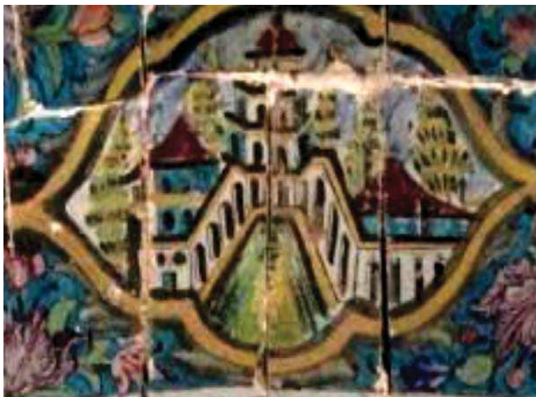
تصویر ۱۸. ترسیم منظره ساختمانی در سردر تکیه معاون الملک

یک مضمون مشترک هستند و آن مضمون مشترک همانا گفتمان قدرت و غلبه دولت قاهر قاجاری است که خوانشگر را به سمت اطاعت و تسلیم در برابر حاکم فرا می‌خواند. نمایش قدرت و اصالت نه تنها در انتخاب عناصر و نمادها نقش داشته بلکه در برخی نمونه‌ها در چیدمان عناصر در کنار هم نیز مؤثر بوده است. سردر حمام گلزار و باغ ارم از جمله این نمونه‌هاست.