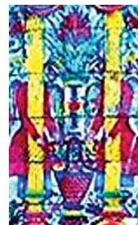
تصویر ۸. راست: نقش فرشته در حمام حاجی، چپ بالا حمام گلزار، چپ پایین سردر باغ ملی.