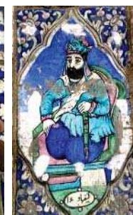
تصویر ۱۰. راست به چپ: تصویر کیقباد، ضحاک و فریدون در حمام گلزار، نبرد رستم با دیو سفید در حمام حاجی، مأخذ: همان