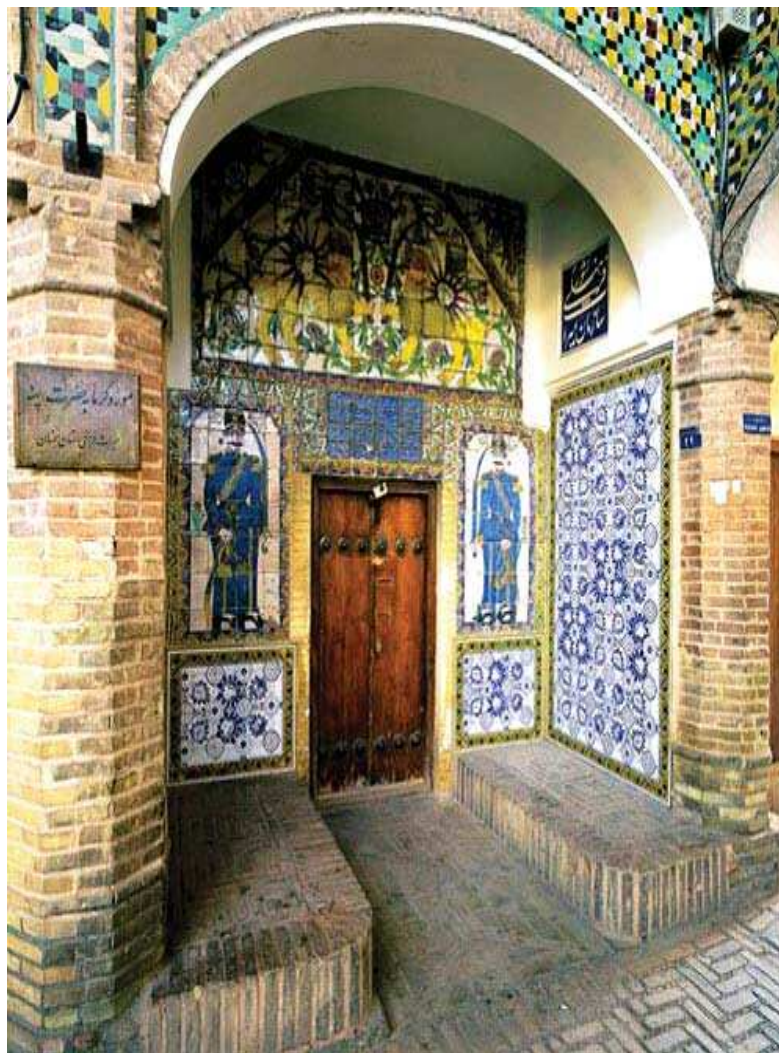
سردر حمام پهنه

شناسایی وجه اشتراک پیام موجود در سردر هفت بنای عمومی دوره قاجار از طریق تحلیل گفتمان نقوش به کار رفته در آنها