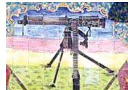
تصویر ۱۴. نمایش توپ و گلوله‌های آن و مسلسل در سردر باغ ملی، مأخذ: همان

سردرها ترسیم شده است. تاج شاهی و پرچم: این نقش در سردر باغ ملی، و تکیه معاون الملک ترسیم شده است (تصویر ۹). تاج به عنوان نماد شاهی و پرچم به عنوان نماد ملیت و استقلال کشور، یکی دیگر از عناصر معمول در کاشی‌کاری دوره قاجاریه بوده است. در اغلب موارد تاج شاهی توسط فرشته‌ها و الهگان پیروزی حمل و نگهداری می‌شوند و جایی در بالای سردر و پایین یا بالای تصویر شاه قرار دارند مجلس‌نگاری: شخصیت‌نگاری در تزیینات تمام سردرهای