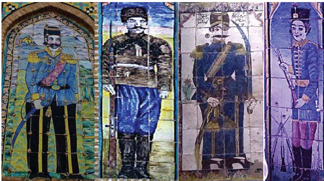
تصویر ۳. به ترتیب از راست به چپ: تصویر سرباز قاجاری در حمام گلزار، حمام پهنه، سردر باغ ملی، ارگ سمنان

وقت) ترسیم شده است. همچنین در دو طرف سردر، بالای تصاویر پهلوانان، تصویر دو مچ دست که با انگشت سبابه به سمت شاه اشاره کرده اند نمایان است. اشاره این دستها بر اهمیت و مرکزیت تصویر شاه قاجار میافزاید. در دو طرف قسمت بالایی سردر نماد شیر و خورشید که نماد ملی زمان قاجار بوده است نمایان است. در طرفین قسمت میانی سردر و زیر تصویر دومی که از احمدشاه قاجار ترسیم شده است، دو فرشته بالدار نیمه‌عریان وجود دارد. یکی دیگر از عناصر سردر، دو گلدان در قوس ورودی سردر میباشد که گلهای آن از پایین حرکت کرده و در نقطه نزدیکی به هم، تصویری دیگر از احمدشاه قاجار که در دو طرف او پرچم سه رنگ ایران قرار دارد را همچون پرتوهای در برگرفته‌اند. در این تصویر آمده: «تمثال اعلی حضرت سلطان احمدشاه قاجار». درست زیر پای فرشتگان و پایین تصویر احمدشاه، کتیبه‌ای مزین به آیه «و ان یکاد...» نگاشته شده است. در طرفین ورودی بنا تصویری از یک سرباز اسلحه به دست قاجاری ترسیم شده است (تصویر ۱).