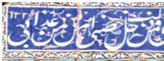
تصویر ۱۶. کتیبه‌نویسی در سردر تکیه معاون الملک، مأخذ: مریخ‌پور، ۱۳۹۳

ترسیم تصویر شاهان در دوره قاجار به یکی از متداول‌ترین رسوم در کاشی‌کاری مبدل شده بود. «پادشاهان قاجار به خصوص فتحعلی‌شاه و ناصرالدین‌شاه که دوره زمامداری‌شان طولانی بوده است به‌منظور ارضای حس شاهانه، جاودانگی و تثبیت حکومت و تخت و تاج و... به تأسی از گذشتگان به هنرمندان سفارش‌های متعددی می‌دادند تا هنرمندان نقش آنها را بر بوم کاشی یا سنگ و غیره جاودانه