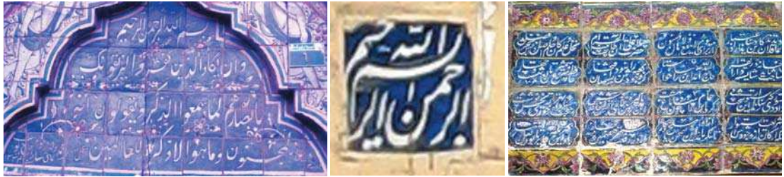
تصویر ۱۷. راست به چپ: کتیبه نویسی در سردر حمام پهنه، حاجی، گلزار

- توجه به نحوه جانمایی و ترکیب نقوش مختلف به طوری که در تشکیل و القای پیام نهایی سردر نقش داشته باشد یکی از وجوه اشتراک سردرها در نحوه پیام سازی و پیام رسانی بوده است، به طوری که اگر میزان دقت و ظرافت به کار رفته در ترکیب و جانمایی نقوش سردرها از ۱ تا ۵ امتیاز دهی شود؛ کمترین امتیاز به دست آمده (امتیاز ۳) از حد میانگین بیشتر است. همچنین حداکثر امتیاز قابل کسب از لحاظ نحوه ترکیب و جانمایی نقوش (امتیاز ۵) در سردر حمام گلزار و باغ ارم به دست آمد.