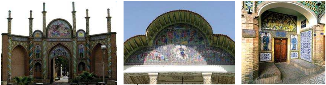
تصویر ۲. به ترتیب از راست به چپ: سردر حمام پهنه، باغ ارم، ارگ سمنان، مأخذ: همان

متن، تقدم و موقعیت زمانی احداث بنا در کل دوره قاجار، مورد خوانش قرار نمی‌گیرند.