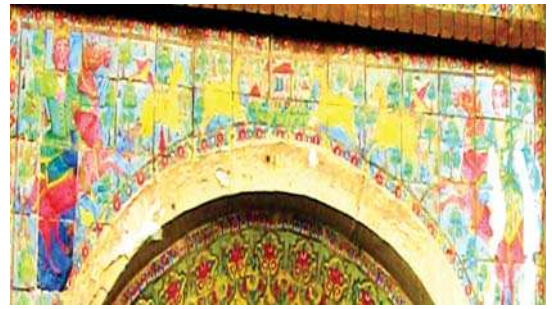
تصویر ۱۱. راست به چپ: شاهزادگان در شکارگاه (حمام حاجی)، مجلس دیدن خسرو، شیرین در چشمه سار (سر در باغ ارم)، مأخذ: همان.