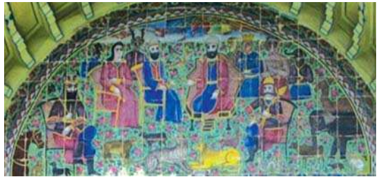
تصویر ۱۲. رستم در بارگاه حضرت سلیمان (ع)، سردر باغ ارم، (راست)، مجلس مدهوش شدن ندیمگان از جمال یوسف (چپ)، مأخذ: همان.