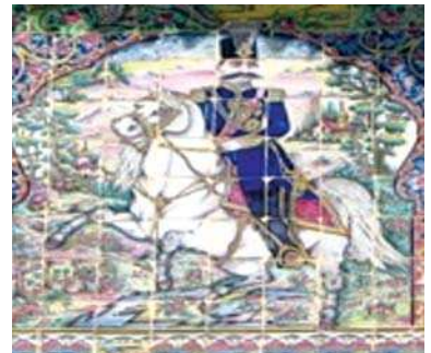
تصویر ۱۳. تصویر ناصرالدین شاه در سردر باغ ارم (راست): تصویر احمدشاه در سردر حمام گلزار (چپ)