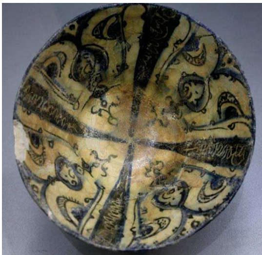
تصویر ۷. ظرف لعابدار. از سده هفتم ه.ق محفوظ در موزه ایلخانیان مراغه.

یکسو و استفاده از دست‌نویس‌ها در هنر دوره اسلامی، دو دلیل می‌شده که با دیدن چنین شکلهایی ذهن تصور آشنای از آن بیندارد. در صورتی که از آن شکل‌ها معنا و پیام خوانشی نمی‌توان دریافت. از ویژگی این دسته از شبه‌نویس‌ها می‌توان به عدم پیروی از قواعد خطوط رسمی و همچنین راحتی حرکت دست طراح در چارچوب کتیبه اشاره کرد. جلوه بصری حاصل از این نمونه‌ها، نمودی از تزئیناتی است که در نقش‌مایه‌های مجاور وجود داشته و این در آشناینداری، نقش مهمی را ایفا می‌نماید (تصویر ۶ و ۷).