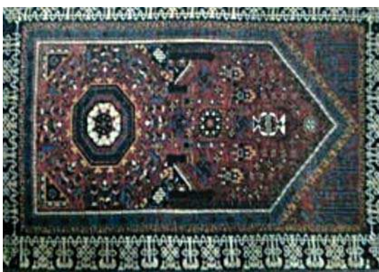
تصویر ۴. قالی ترکمانان. دوره ترکمانان.

اینجا ابتدا به معرفی هر دسته پرداخته می‌شود و سپس به تشریح آن‌ها، متناسب با ویژگی‌های هر کدام اشاره خواهد شد.