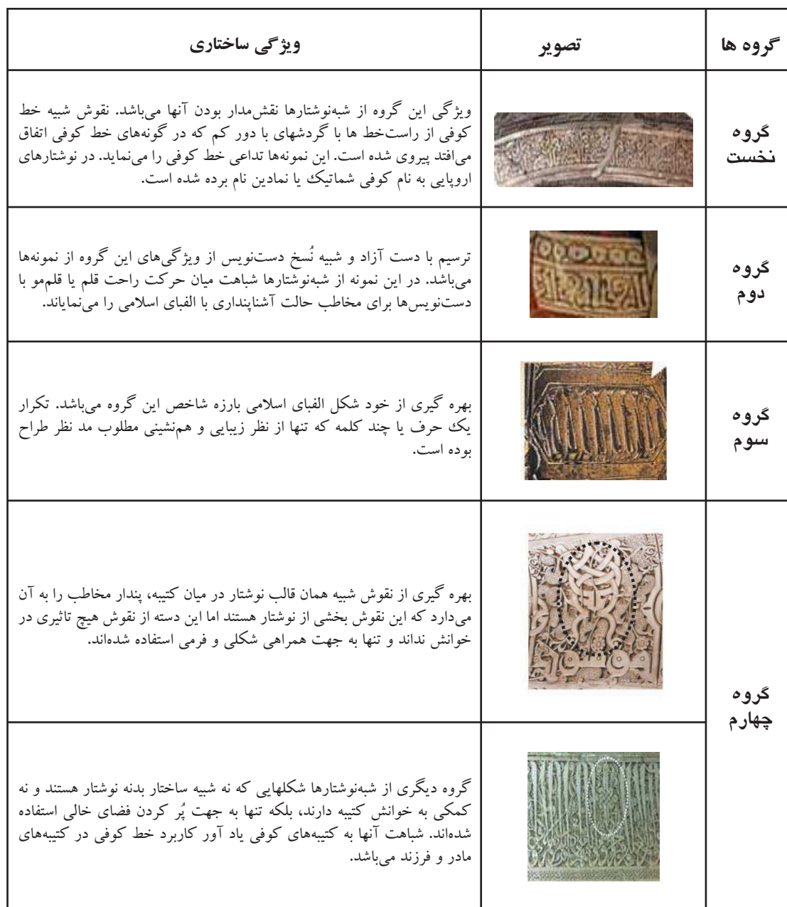
جدول ۱. دسته بندی شبه‌نوشتارها در کتیبه‌ها.