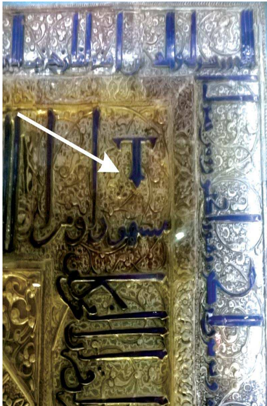
تصویر ۱۲. بخشی از محراب شماره دو بالاسر حضرت امام رضا، سده شش ه.ق. موزه آستان قدس.