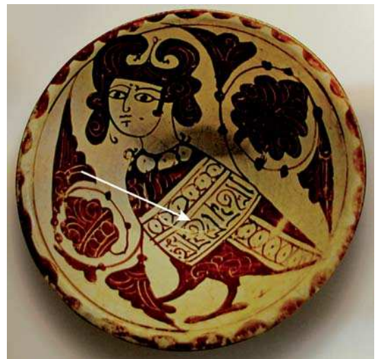
تصویر ۶. سفال لعابی مربوط به قرن ۶ ه.ق از ایران محفوظ در موزه آبیگینه.