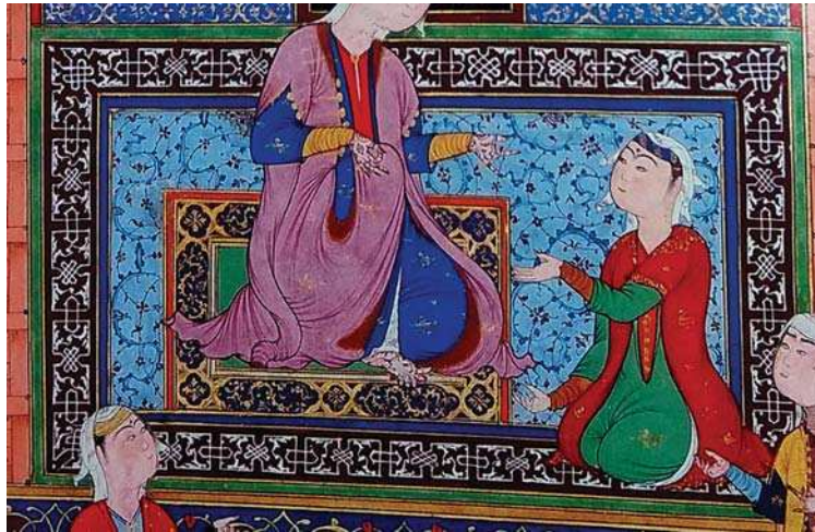
تصویر ۵. بخشی از نگاره سودابه با ندیمه اش مشورت میکند. از شاهنامه طهماسبی. سده ۱۰ ه.ق. مأخذ: رجبی: ۱۳۸۵، ۱۱۲

۳) حروف خوشنویسی اسلامی، به دلیل تنوع فرمی و ساختاری به سان شکل و فرم، می‌تواند بستر آفرینش فرمی برای تزئینات به حساب آید. از این رو گروه دیگر از شبه‌نویس‌ها به صورت مشخص از حرف خوشنویسی اسلامی شکل گرفته‌اند. در این حالت خود شکل حرف تبدیل به ابزار تزئین می‌شود. رعایت قاعده خوشنویسی در این نمونه‌ها وجه شاخصی می‌باشد. همچنین استفاده از دیگر خطوط آشنای اسلامی به جز کوفی، آشنا پنداری را پذیراتر نموده است. برای مثال در شکل شماره هشت، تکرار حرف "الف" که از خط ثلث وام گرفته شده است،