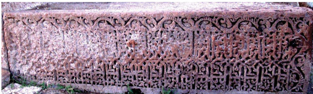
تصویر ۳. سنگ گور از گورستان اخلاط ترکیه، مربوط به دوره سلجوقی.