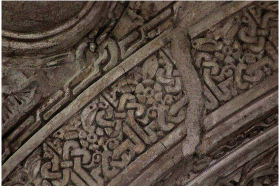
تصویر ۲. بخشی از محراب میر نطنز، احتمالاً اواخر سده هفت ه.ق.

حال استفاده از این ویژگی ادراک ذهنی در ساختار مغز انسان، دست‌مایهٔ آفرینش‌هایی شده که در آن طراح برای پدیدار کردن نمادی از فرهنگ اسلامی در ذهن مخاطب، از ساختار الفبای اسلامی بهره گیرد. در این زمینه یکی از مناسب‌ترین مکان‌ها در جهت پدیدار شدن نمود فرهنگ اسلامی، کتیبه‌ها بوده است. در زیر به دسته‌بندی بخشی از کارکرد این گونه از کتیبه‌ها در صنایع اسلامی پرداخته می‌شود.