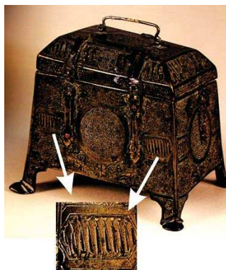
تصویر ۸. جعبه فلزی مربوط به سده ۵ ه.ق. ایران.

الف) حالت نخست از این گروه؛ شبه‌حروفی هستند که شبیه متن کتیبه می‌باشند- یا شبیه بخشی از متن- که حضور آن‌ها تاثیری در خوانش متن نوشتار نداشته و تنها به جهت دیزاین و چیدمان در صفحه از آن بهره گرفته می‌شود. برای مثال در تصویر شماره ۹ که مربوط به کتیبه خانقاه نطنز می‌باشد عبارت "الله الصمد لم یلد" انتخاب شده است؛ اما با کمی دقت می‌توان حروفی مانند لا را بالای عبارت "صمد" دید که در آیه وجود ندارد، اما حضور آن از بابت حفظ ضرب‌آهنگ و هم چنین تعادل در صفحه لازم بوده است. از این رو طراح از اشکالی شبیه همان فرم نوشتار برای پُر کردن فضا بهره برده است. به بیان دیگر، از آشناپنداری با دیگر حروف و از مشابهت با الفبا، به‌جای نقش بهره برده است.