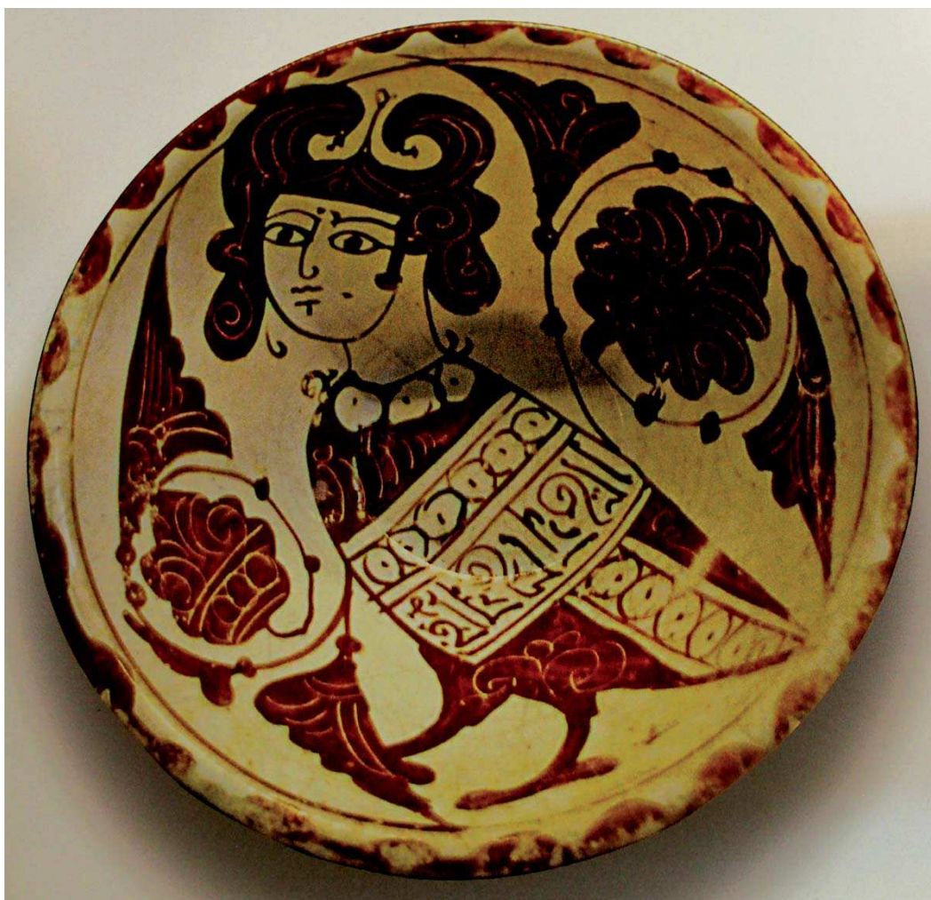
سفال لعابی مربوط به قرن ۶ ه. ق از ایران محفوظ در موزه آبگینه