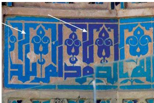
تصویر ۹. قسمتی از کتیبه بیرونی خانقاه نطنز. سده ۷ و ۸ ه.ق.