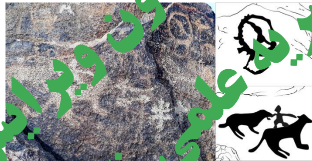
تصویر ۱۰. در قسمت بالا و سمت راست تصویر نقش بزکوهی با شاخ کاملاً دایره که با خطی مورب دایره به دور آن تبدیل شده است، محوطه "شترسنگ"، مشهد (شهریور ۱۳۹۸)، ترسیم تصاویر خطی توسط پژوهشگر انجام شده است، نگارنده.