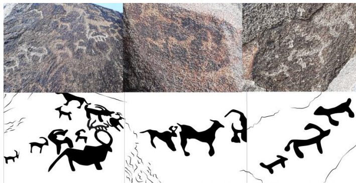
تصویر شماره ۱۴، تمرکز بر نقش احتمالاً بز مادر به همراه فرزند، محوطه "شترسنگ" مشهد، (شهریور ۱۳۹۸)، ترسیم تصاویر خطی توسط پژوهشگر انجام شده است نگارنده.

در مجموعه سنگ‌نگاره‌های سایت تاریخی "شتر سنگ" که دارای پرانسی نقوش بر روی سنگ‌های منطقه است، تصویر بزهای کوهی با تنوع متفاوتی از جهت طراحی نیز ظاهری، دارا بودن حرکت یا عدم حرکت بزها و نیز تنوع متفاوت در سایز بزهای ترسیم شده قابل مشاهده است. در چند مورد در میان نقوش بزهای حکاکی شده، بزها کوچکتری به همراه مادرشان ترسیم شده است که یا در کنار و پشت سر و در مواردی در مقابل بز مادر که دارای ابعاد بزرگتری است، قرار می‌شوند (تصویر ۱۴). در قسمت بالای سنگ نگاره اصلی موجود در منطقه، که حجم زیادی از نقوش جانورسان در آن ترسیم شده است، تنها یک بز نیم رخ متفاوت از سایر بزها، با دو پا و با شاخی کاملاً منحنی قابل مشاهده است که انحناي شاخ با پشت بدن بز یک دایره کامل را تشکیل داده است و این دایره با خطی مورب به دو نیم تقسیم شده است (قابل مشاهده در تصویر شماره ۱۰). این تنها نقش بز موجود در منطقه است که از جهت فرم شاخ و اندازه با سایر بزها متفاوت است و در بالاترین قسمت لاشه سنگ اصلی و در نمایی مقابل بیننده خودنمایی می‌کند.