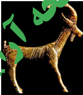
تصویر شماره ۴. مجسمه بز، مفرغ های تاریخی لرستان ( https://www.beytoote.com/art/ ).

نکته قابل توجه در ارتباط با نقش بزهای موجود بر روی ظرف سفال و یا ظروف و مجسمه های مختلفی که به شکل بز ساخته و طراحی شده اند در مقایسه با بزهای حکاکی کنده بر روی سنگ نگاره ها علاوه بر تکنیک متفاوت در اجرای این نقش، ساختار طراحی کمی رئالیستی تر و واقع گرایانه تر طراحی بزها است؛ که سختی جنس سنگ و موقعیت قرار گیری صخره ها در مکان های خاص، یکی از دلایل طراحی های انتزاعی تر در سنگ نگاره ها است.