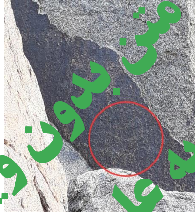
تصویر ۱۲. تنها تصویر بزرگ‌سای قابل مشاهده در لاشه سنگ اصلی موجود در منطقه "شترسنگ" به صورت طراحی (خراش) با خط‌های محیطی اجرا شده است (شهریور ۱۳۹۸)، نگارنده. تصویر ۱۳. ایجاد نقوش انسانی سوار بر پشت یوزپلنگ به شیوه کنده کاری به صورت ضربه‌های پی در پی برای ایجاد نقوش توپر، "محوطه شتر - سنگ" مشهد، (شهریور ۱۳۹۸)، نگارنده.

در مجموعه سنگ‌نگاره‌های سایت تاریخی "شتر سنگ" که دارای پرانسی نقوش بر روی سنگ‌های منطقه است، تصویر بزهای کوهی با تنوع متفاوتی از جهت طراحی نیز ظاهری، دارا بودن حرکت یا عدم حرکت بزها و نیز تنوع متفاوت در سایز بزهای ترسیم شده قابل مشاهده است. در چند مورد در میان نقوش بزهای حکاکی شده، بزها کوچکتری به همراه مادرشان ترسیم شده است که یا در کنار و پشت سر و در مواردی در مقابل بز مادر که دارای ابعاد بزرگتری است، قرار می‌شوند (تصویر ۱۴). در قسمت بالای سنگ نگاره اصلی موجود در منطقه، که حجم زیادی از نقوش جانورسان در آن ترسیم شده است، تنها یک بز نیم رخ متفاوت از سایر بزها، با دو پا و با شاخی کاملاً منحنی قابل مشاهده است که انحناي شاخ با پشت بدن بز یک دایره کامل را تشکیل داده است و این دایره با خطی مورب به دو نیم تقسیم شده است (قابل مشاهده در تصویر شماره ۱۰). این تنها نقش بز موجود در منطقه است که از جهت فرم شاخ و اندازه با سایر بزها متفاوت است و در بالاترین قسمت لاشه سنگ اصلی و در نمایی مقابل بیننده خودنمایی می‌کند.