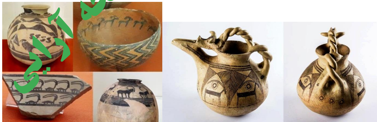
تصویر شماره ۲. نقش بزکوهی با ساختار طراحی متفاوت بر روی سفالهای مناطق مختلف ایران، موزه ایران باستان، نگارنده.

علاوه بر وجود نقش بز بر روی ظروف سفالی، نقش این حیوان بر روی ظرف استوانه ای شکل، ظروف مخروطی به شکل تنگ و بر روی جام های ساخته شده از سنگ های صابونی مربوط به قدیمی ترین تمدن بشری، تمدن جیرفت نیز به زیبایی ترسیم شده اند، تصویر شماره ۳ (صفاران و همکاران، ۱۳۹۷: ۶۱). نمونه های بسیار زیبای دیگری از ارتباط انسان با این حیوان سمبولیک را در مجسمه های فلزی با شکل بز بر جای مانده از عصر مفرغ در لرستان (تصویر شماره ۴)، عصر هخامنشی (بز بالدار طلائی، ریتون یا