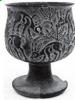
تصویر شماره ۳. نقش بز و قوچ بر روی جام، سنگ صابون، تمدن جیرفت، موزه جیرفت (صفاران و همکاران، ۱۳۹۷: ۶۱).