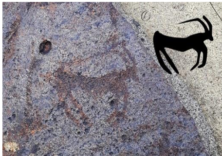
تصویر ۱۱. تصویر بزکوهی با بدنی کشیده با دو شاخ کوتاه، زاویه سر و شاخ حالت سه رخ، محوطه "شترسنگ"، مشهد (شهریور ۱۳۹۸)، ترسیم تصاویر خطی توسط پژوهشگر انجام شده است، نگارنده.

در بین نقوش بر جای مانده از قسمت های جلویی لاشه سنگ اصلی و بزرگتر موجود در منطقه (تصویر شماره ۶ و ۷)، تعداد محدودی از تصاویر حیواناتی عظیم الجثه مانند شیر و یوزپلنگ مشاهده می شوند که انسانی بر پشت آنها ایستاده است و در صحنه ای دیگر انسان ایستاده با کمانی در دست و در حال شکار، مشاهده می شود. این به این معنی است که انسان عصر نوسنگی در آن دوران از حیواناتی مانند اسب، شیر و یوزپلنگ برای کمک به شکار حیوانات دیگر استفاده می کرده است. نکته قابل توجه دیگر این است که نقوش حیوانات در این سنگ‌نگاره ها دارای تنوع ریخت شناسی است، اما یکی از نکات مهم دیگر اشاره به این موضوع است که اغلب حیوانات حک شده مانند بسیاری از صخره نگاره های مناطق دیگر به صورت نیمرخ و با خطی افقی با بدنی کشیده به دور از هر گونه تزئین با خطوطی بسیار ساده و کم عمق حکاکی شده اند. در مورد نقش انبوه بزها در سایر سنگ های موجود در منطقه، باید اشاره کرد که نقش این حیوان در مقایسه با جانوران خانواده گربه سانان، دارای تحرک کمتری است. تصاویر بزها، اغلب در حالت نیمرخ با شاخ متفاوت شاخ از جهت شکل، اندازه و تعداد (دوتایی و یا تکی)، گاه با انحنای بزرگ که داخل آن نقشی دیده می شود (تصویر شماره ۱۰) و گاهی با شاخ هایی کوتاهتر و یا با انحنای کمتری قابل مشاهده است که معمولاً فرم شاخ آنها به نیم دایره نمی رسد (تصویر ۱۱).