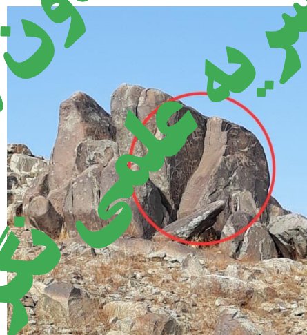
تصویر شماره ۶. لاشه سنگ اصلی منطقه "شتر سنگ" در قسمت شرق محوطه که بیشترین نقوش سنگ نگاره های منطقه را در بر گرفته است، مشهد، (شهریور ۱۳۹۸).

در ارتباط با تاریخ دقیق نقوش سنگ نگاره های منطقه "شتر سنگ"، می توان گفت که به درستی مانند سنگ نگاره های سایر نقاط دیگر ایران و جهان نمی توان تاریخ قطعی آنها را تخمین زد، بلکه بصورت تقریبی بر اساس شواهد موجود بررسی های دقیق باستانشناسی و قوم نگاری می توان تاریخ تقریبی این نقوش را بیان کرد. طبق نظر کارشناسان میراث فرهنگی، نقوش تاریخی این منطقه دارای تاریخی ۱۱ هزار ساله است که به جهت حکاکی شدن در جهت رو به جنوب و شرق و کمتر قرار گرفتن مسیر وزش باد و عوامل فرسایشی، کما بیش تا به امروز زنده مانده است (نصرتی، ۱۳۹۳). مورد بالا انسان متفکر و هنرمند عصر نوسنگی و بعد از آن با محاسبه، جهت یابی دقیق و مناسب به خوبی می دانسته است کدام سنگ ها با شیب مناسب، بهترین گزینه برای حکاکی و نیز قرار گرفتن در معرض دید مخاطبان است تا بتواند بهترین خوانش تصویری را به بیننده ارائه دهد. بیشترین حیوانی که در بین نقوش سنگ نگاره های منطقه مورد پژوهش مانند سایر مناطق ایران قابل مشاهده است نقش حیوان اهلی، بزکوهی است که طبق آنچه فرهادی (۱۳۷۷)، در مقاله خود بیان کرده است زمان اهلی شدن بزکوهی به حدود ۹۵۰۰ سال پیش از میلاد باز می گردد که بر طبق نقوش باقی مانده از این جانور در سنگ نگاره های مناطق مختلف می توان تاریخ تقریبی این سنگ نگاره ها را به آن دوران تخمین زد (۲۲۱). دومین نقشی که در بین نقوش سنگ نگاره های منطقه "شترسنگ" دارای بیشترین فراوانی است، نقش انسانی است، انسان کماندار در حال شکار، ایستاده، در حال جنگ و نزاع و انسانی سوار بر شیر.