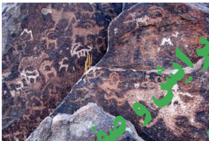
تصویر ۷. نمای بسته از سنگ نگاره اصلی "شتر سنگ" مشهد، (شهریور ۱۳۹۸).

نگاره های مناطق دیگر نشان از گذر زمان و حکاکی نقوش در فواصل زمانی متفاوت دارند. همچنان که در تصاویر ارائه شده از منطقه مورد پژوهش مشاهده می شود، نقوش موجود در سطح سنگ ها به واسطه ساختار طراحی و حکاکی و نیز تغییرات رنگی ایجاد شده در سطح سنگ ها مانند هوازدگی، اکسید شدگی و یا تغییرات رنگی که بر اساس وجود آهن (تصویر ۸ و ۹) در بخشی از سنگ های منطقه بوجود آمده است، میتوان به طور نسبی، تقدم، تأخر، کهنه و یا جدید بودن آنها را تا حد زیادی تشخیص داد. برخی از نقوش بسیار قدیمی هستند و بر اثر تخریب های ایجاد شده توسط عوامل جوی، به سختی قابل مشاهده و خوانش تصویری است و برخی نقوش جدیدتر و حتی مربوط به سالهای اخیر است که این عمل توسط افراد غیر حرفه ای و غیر متعهد باعث تخریب ۹۱- فتن نقوش قدیمی تر شده است. در حقیقت بخشی از نقوش های موجود به علت قدمت تاریخی و نیز تکنیک خراش و حکاکی عوامل جوی، در قسمت هایی با سطح سنگ بستر خود، تقریباً هم رنگ شده است و نمی توان با عکاسی تصویری با دقت بسیار بالا از آنها ثبت کرد (تصویر ۹). این تفاوت رنگی نقش های حکاکی شده نشانی است از فاصله زمانی بین نقوش ایجاد شده در طول دوره های مختلف.