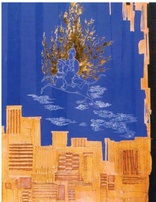
تصویر ۲. معراج اثر ایرج اسکندری، گنجینه فرهنگستان هنر، مأخذ: خیال ایرانی ۱۳۸۴، ۱۰