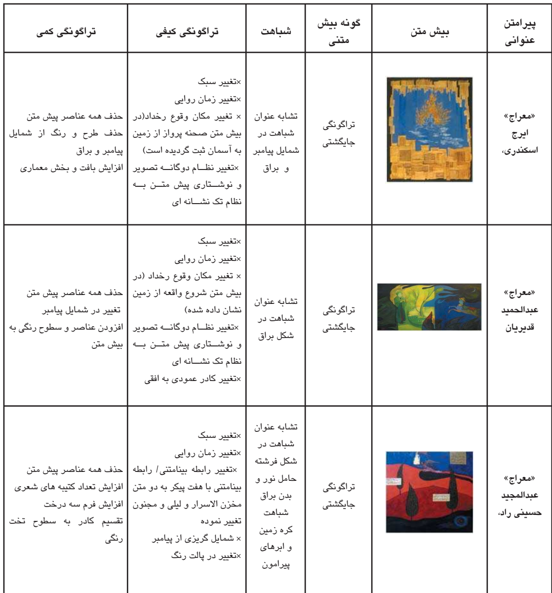
جدول ۲. مقایسه تکثیر پیش متن در پیش متن.

صحنه‌ای نمایشی از مرحله نخست سفر معراج و ورود براق خدمت پیامبر را نقاشی کرده است. حسینی‌راد ضمن توجه بر ارتباط بینامتنی میان تصویر و متن در پیش متن، این ارتباط را در اثر خود حفظ و بازنمایی کرده است. گرچه متن انتخابی متفاوت از متن منظومه هفت‌پیکر است که پیش متن برای آن تصویر شده. به عبارتی حسینی‌راد هم معراج سلطان‌محمد و هم منظومه‌های مخزن‌الاسرار و لیلی و مجنون نظامی و شاید برخی از متون دینی را به عنوان پیش‌متن استفاده کرده و با الهام از این متون پیش متن را خلق نموده است که بازتاب