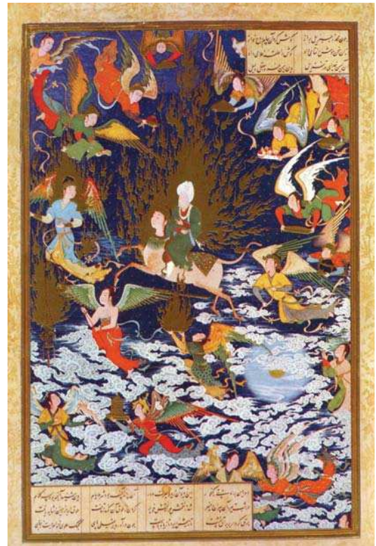
تصویر ۱. نگاره معراج اثر سلطان محمد، حدود-۴۹-۹۴۶ هجری، کتابخانه بریتانیا، مأخذ آژند ۱۳۸۴، ص ۱۳۱

معراج به معنای نردبان و مصعد جای بالا رفتن، بلند گردیدن و فراز آمدن است همچنین عروج پیامبر اسلام به آسمان... می‌باشد (نک دهخدا، ذیل واژه معراج). واقعه معراج، یکی از مهمترین رخدادهای زندگی پیامبر اسلام است که با سفر ملکوتی ایشان از مسجدالحرام به مسجدالاقصی آغاز و سپس با سیر و عروج به آسمانهای ۷ گانه و ملاقات با پیامبران پیشین و فرشتگان و همچنین مشاهده وقایعی از بهشت و جهنم ادامه یافته تا در نهایت به ملاقات و گفتگویی بی‌واسطه با خداوند متعال منتهی می‌شود. در دو سوره از قرآن کریم به‌طور اجمال معراج پیامبر مورد توجه قرار گرفته است: آیه اول از سوره اسراء که سیر شبانه پیامبر اعظم از مسجدالحرام به مسجدالاقصی را منظور می‌دارد و سوره نجم آیات ۵ الی ۱۸ که قسمت دوم این سفر از بیت‌المقدس به آسمان و سدره المنتهی را مورد توجه قرار می‌دهد. این واقعه در قالب روایات و احادیث، بازگو، تفسیر و تاویل گردیده افزون بر آن که از گذشته تاکنون دستمایه آفرینش آثار ادبی و هنری متعدد نیز قرار گرفته است. در این رابطه می‌توان به دهها نگاره که ملهم از واقعه معراج خلق شده، اشاره کرد. که به رغم تفاوتی که حاصل نگرش و سبک متفاوت هنری هنرمندان است شباهتهایی را به