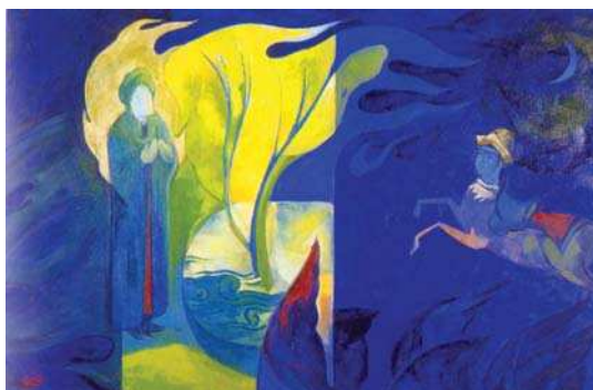
تصویر ۳. معراج اثر عبدالحمید قدیریان، گنجینه فرهنگستان هنر، مأخذ: خیال ایرانی ۱۳۸۴، ۳۸

به سمت چپ و به سوی آسمان و ماه است. تصویر براق در گوشه سمت راست در زیر هلال ماه در حال ورود به کادر نشان داده شده است. شکل براق و حالت بدن و حرکت او کاملاً مشابه پیش متن است و ارجاع به آن دارد. در پایین کادر نیز گیاهانی به چشم می‌آید. حرکت گیاهان و هاله پیامبر که حرکتی از سمت چپ به سمت راست و به سوی آسمان و ماه دارد تأکیدی بر حرکت پیامبر از زمین به آسمان می‌باشد. به جز عناصری که بدان اشاره شد عنصر دیگری در پیش متن نیست و همه آنها اعم از فرشتگان، ابرها و ... حذف شده است. پیش متن از یک نظام نشانه‌ای برخوردار است و برخلاف پیش متن به ادبیات ارجاع نداده و کتیبه‌های شعری حذف شده است. افزون بر این پیش متن نسبت به پیش متن دچار زمان پریشی شده و قدیریان زمان پیش متن را به عقب برده و مراحل و صحنه آغازین سفر معراج را نشان داده، هنگامی که براق به عنوان مرکب برای در خدمت بودن پیامبر ظاهر می‌شوند به عبارتی نقاشی قدیریان از نظر زمانی مقدم بر نقاشی پیش متن است. لازم به یادآوری است اغلب صحنه‌های تصویر شده از واقعه معراج، سیر سفر پیامبر در آسمان و عرش را نشان می‌دهد و صحنه‌هایی معدود به آغاز سفر اشاره دارد که از نظر انتخاب کادر و شکل متفاوت است مانند صحنه‌های تصویر شده در معراجنامه ایلخانی یا شاهرخ، اما در کتاب جامع‌التواریخ ۱۴ که قدیم‌ترین صحنه شناخته شده از این واقعه را نشان می‌دهد (تصویر ۴)، پیامبر سوار بر براق بر روی زمین و پیش از سفر آسمانی نشان داده شده است که از نظر زمان، مکان و انتخاب کادر افقی با اثر قدیریان مشابهت دارد و شاید یکی دیگر از منابع مورد توجه قدیریان بوده باشد. تغییرات پیش متن نسبت به پیش متن را به اختصار می‌توان چنین برشمرد.