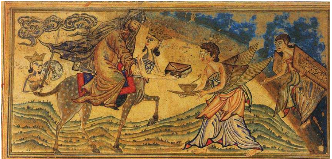
تصویر ۴: معراج پیامبر، برگي از نسخه جامع التواریخ، اوایل قرن هشتم هجری، کتابخانه دانشگاه ادینبورو.

با لباسی به رنگ قرمز با طبقی از نور در حرکت است. در بالای سر او پاهای جانوری، احتمالاً براق، تصویر شده که نیمی از بدنش خارج از کادر و غیرقابل دید است. تصویر فرشته و طبقی که حمل می‌کند و همچنین فرم بدن و حرکت رو به سوی بالای براق ملهم از پیش متن است. اما نقاشی حسینی راد فاقد عناصر متعدد نگاره سلطان محمد چون فرشتگان و جبرئیل است.