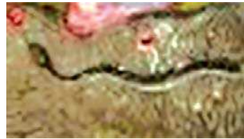
تصویر ۴. مار در نگاره مولانا و دیوآب-جزیی از تصویر ۱