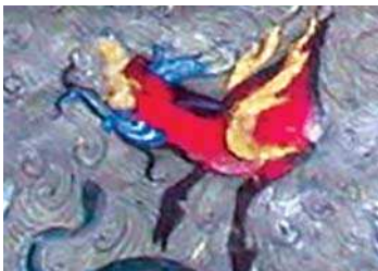
تصویر ۸. اژدها در نگاره مولانا و دیوآب، جزیی از تصویر ۲