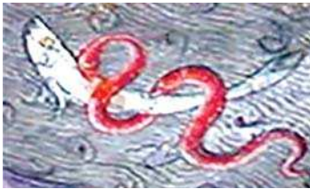
تصویر ۵. مار در نگاره مولانا و دیوآب-جزیی از تصویر ۲

بازگشایی مفهوم جن در قرآن و تطبیق آن با نگاره مولانا و دیوآب در نسخه ثواقب المناقب بر اساس نقد اسطوره‌ای نورتروپ فرای / ۶۹-۷۷