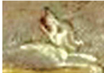
تصویر ۷. سگ در نگاره مولانا و دیوآب، جزیی از تصویر ۱