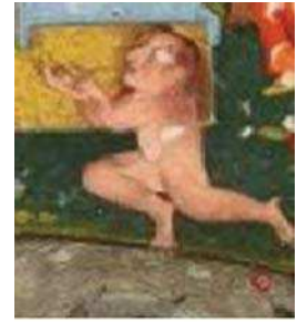
تصویر ۱۱. تصویر جن در نگاره مولانا و دیو آب، جزیی از تصویر ۱

یا حتی انسان با ظاهری عجیب غریب درآیند" (مولوی مقدم، ۱۳۹۲، ۲۶). همانطور که در تصاویر شماره ۱۱ و ۱۲ آمده‌است، جن می‌تواند ظاهری نیمه انسان و نیمه حیوان نیز داشته‌باشد که این موضوع در تفسیر طوسی آمده‌است. "برخی از جن‌ها ممکن است بدن انسان یا سر حیوان داشته باشند یا دست و پایشان مانند دست و پای حیوانات باشد" (طوسی، ۱۳۴۵، ۴۸۶).