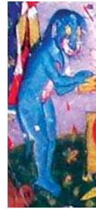
تصویر ۱۲. ظاهر حیوانی جن در نگاره مولانا و دیو آب، جزیی از تصویر ۲

مختلط و متحرک آتش آفریده شده است که به عبارتی در اینجا منظور از اختلاط شعله‌های مختلف آتش می‌باشد، زیرا هنگامی که آتش شعله‌ور می‌شود گاه به رنگ سرخ، گاه به رنگ زرد، گاه به رنگ آبی درمی‌آید، بنابراین شاید انتخاب رنگ آبی برای جن در این نگاره، اشاره به این تفسیر داشته‌است. چراکه نگارگر مسلمان هیچ‌گاه جدا از اعتقادات دینی و مذهبی خود به تصویرسازی نسخه‌های مذهبی نپرداخته‌است. در این بخش از نگاره‌ها با تصویری مواجه می‌شویم که با توجه به متن روایت در ثواقب المناقب از آن به "خداوند آب" تعبیر شده است ولی با توجه به جمیع موارد ذکر شده، می‌توان آن را تعبیر به "جن" کرد. محتمل است که این جن (تصویر ۱۱ و ۱۲) رئیس طایفه جنیان بوده که به نیابت از طایفه خود، بر حضرت مولانا ظاهر شده و تقاضای شفاعت و بخشش کرده‌است چرا که در بخش‌های پیشین به تفصیل در مورد اثبات زندگی جمعی جنیان صحبت به میان آمده‌است. در این تصاویر می‌بینیم که جن پس از قبول شفاعت خود توسط مولانا، برای ابراز سپاس از ایشان مقداری مروارید غلطان از قعر آب، به همسر مولانا تقدیم می‌کند. در نهایت جمع‌بندی مصداق‌های تصویری جن در نگاره‌ها در جدول شماره ۱ آمده‌است. لازم به ذکر است که این جدول تنها ویژگی‌های ظاهری جن را مشخص کرده و ویژگی‌های رفتاری جنیان در قرآن و مطابقت آن با حکایت مولانا در متن مقاله به تفصیل بررسی شده‌است.