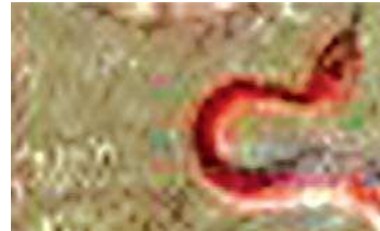
تصویر ۳. مار در نگاره مولانا و دیوآب-جزیی از تصویر ۱