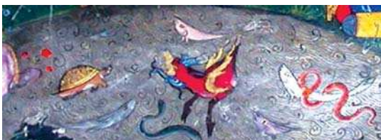
تصویر ۱۰. جزیی از تصویر شماره ۲