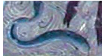
تصویر ۶. مار در نگاره مولانا و دیوآب-جزیی از تصویر شماره ۲