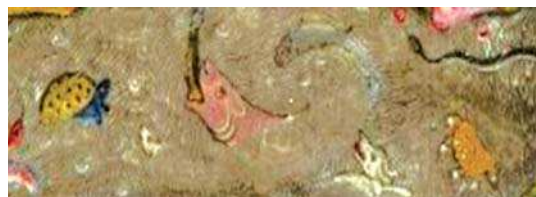
تصویر ۹. جزیی از تصویر شماره ۱

و خداوند جن را در پنج صنف آفریده است: صنفی مانند باد در هوا (ناپیدا هستند) و صنفی بصورت مارها و صنفی بصورت عقرب‌ها و صنفی حشرات زمین‌اند و صنفی از آنها مانند انسان نند که بر آنها حساب و عقاب است" ( مکارم شیرازی، ج ۲۵، ۱۳۷۷، ۱۵۷).