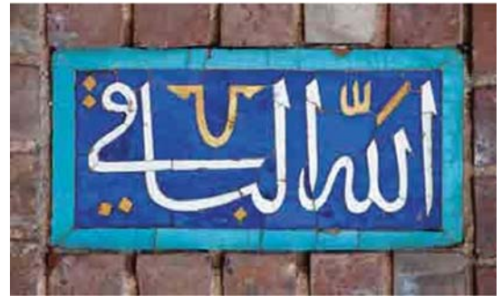
تصویر ۴. عبارت اعظم «الله الباقی» پرتعدادترین کتیبه مسجد گوه‌رشاد، مأخذ: همان.

اسماء الحسنی نگارش یافته بر این کتیبه‌های ترنجی شکل عبارت‌اند از: «یا حیان، یا مقرب، یا عالی، یا جبار، یا مرضی، یا مخفی، یا محی، یا سامع، یا منصور، یا منان، یا رضوان، یا باقی، یا حکیم، یا رحمان، یا قوی، یا علیم، یا رادع، یا رشید، یا دود، یا دیان، یا رحیم، یا وهاب، یا هادی، یا سبحان، یا جنان، یا برهان، یا مبین، یا علی، یا ماجد، یا نور، یا هو، یا محمد، یا جواد» (همان). مجموع این اسامی الهی در دعایی به‌نام جوشن کبیر وجود دارد و شیعیان قرائت آن را در شبهای قدر از افضل اعمال می‌دانند. در عقب‌نشینی دهانه ایوان مقصوره، دو قاب کتیبه‌ای در دو طرف ایوان قرار دارند که به لحاظ ترکیب خط و متن احتمالاً از کارهای بایسنغر بن شاهرخ به شمار می‌روند (صحراگرد، ۱۳۹۲: ۱۶۹). بر پایه غربی ایوان به خط ثلث: «سبحان ربی العظیم و بجمده» و به خط کوفی «لا حول و لا قوه الا بالله العلی العظیم» و بر پایه شرقی: «سبحان ربی الاعلی و بجمده» و به خط کوفی: «سبحان الله و الحمد لله و الله اکبر» آمده