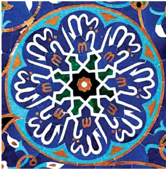
تصویر ۷. تکرار ذکر یالله بر کتیبه‌های طرح شمس‌های. مأخذ: همان.