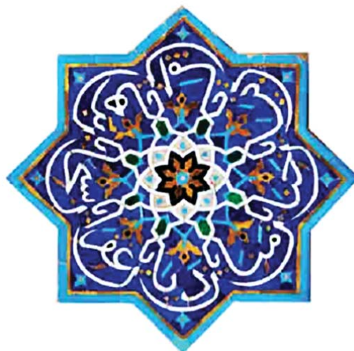
تصویر ۶. تکرار اسماء الهی با ختم به حرف «ن»، مأخذ: همان.

«سبحان الله و الحمد لله» را در لبه دهانه ایوان‌های شرقی و غربی به نمایش گذاشته‌اند (اعتماد السلطنه، ۱۳۶۲: ج ۲، ۱۴۶). در کتیبه‌های زیر طاق این دو ایوان نیز هشت نام از اسماء الهی با مضمون «یا حنان، یا منان، یا دیان، یا غفران، یا سبحان، یا برهان، یا امان، یا بیان» در شمشه‌های هشت پر به خط ثلث تزیینی نگارش یافته‌اند که بر اساس اصالت طرح از آثار دوره تیموری به شمار می‌روند و به نظر می‌رسد در دوره‌های بعد مورد بازسازی قرار گرفته‌اند. متن این کتیبه‌ها متشکل از اسمائی است که به حرف «ن» ختم می‌شوند و چرخش دایره‌وار آنها حرکتی از سماع صوفیان را در نزدیکی معنوی با خالق یکتا به نمایش می‌گذارند (تصویر ۶). از سوی دیگر کاربرد ۸ نام از اسماء الهی را می‌توان با تبرک این عدد به نام امام رضا (ع) به عنوان هشتمین امام شیعیان در حرم مقدس ایشان در ارتباط دانست.