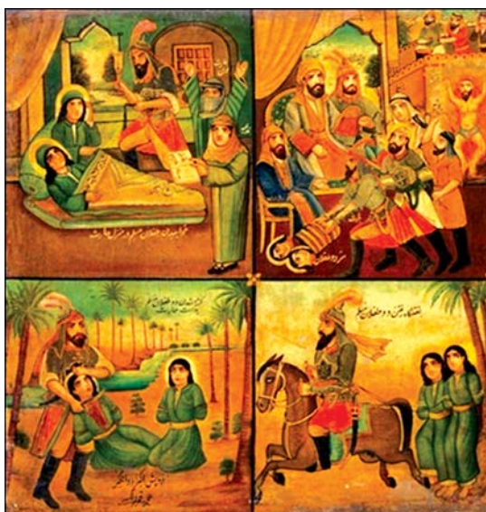
تصویر ۵. بخشی از تصویر ۳، اثر قوللر آقاسی

چرخه‌ای از داستان‌گویی به همراه نقل می‌شود. این همان چیزی است که قوللر آقاسی را وادار می‌کند در «غلط‌سازی» هنگام کشیدن تابلوهایش اصرار بورزد و با سماجت از طبیعت‌سازی پرهیز کند. به نظر می‌رسد این موضوع باعث باورپذیری بیشتر در مخاطب می‌گردد و امر قدسی را در فاصله معینی با مخاطب و متن قرار می‌دهد، همان اعتقادی که در باور دینی برای حفظ جایگاه امر مقدس و دینی وجود دارد. در هنر اسلامی هیچ‌گاه موجودیت اشیا را به اعتبار خودشان طرح نمی‌کنند و هرگز نمایشگر عالم مجرد صرف هم نیست. اساسا هنرهای دینی در یک امر مشترک هستند و آن جنبه سمبلیک آنهاست، زیرا در همه آنها جهان سایه حقیقتی متعالی از آن است. از اینجا در هنرها هرگز قید به طبیعت که در مرتبه سایه است وجود ندارد (مددیور، ۱۳۸۴: ۱۰). این امر باعث ایجاد ادراکی شهودی در مخاطب و به همان نسبت در دید هنرمند می‌شود و در نتیجه منجر به کشف حقیقت می‌گردد. اهمیت دادن به کل فضا نیز از دیگر خصوصیات این نوع نقاشی است.