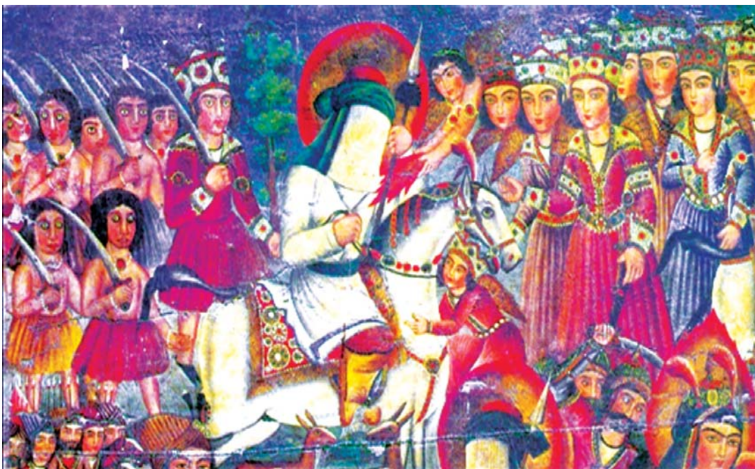
تصویر ۲. پرده درویشی، وقایع کربلا، بخشی از اثر ۱۲۸ در ۱۹۸ سانتی‌متر. ۱۲۸۸. موزه رضا عباسی.

قزوینی، ۱۳۸۹: ۶۳). اما در زیباشناسی غربی مراحل نگرشی و جهان بینی هنری متفاوت است. اساس زیبایی تطبیق با واقعیت‌های ملموس است و چون هنرمند از قلمرو واقعیت‌ها فرارود، به استحاله شکل‌های طبیعی و واقعی می‌پردازد تا جایی که اشکالی بیافریند که از مظاهر طبیعت گرفته شده است (آیت‌اللهی، ۱۳۸۴: ۳۰).