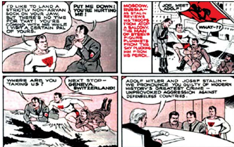
تصویر ۸، بخشی از اولین قسمت‌های سوپرمن. در این تصویر سوپرمن هیتلر را دستگیر کرده است، مأخذ: www.superman.wikia.com

ممکن میان تصاویر و دنیای واقعی؛ در گونهٔ دوم بنیان کار «شکل‌شکنی» است و تصاویر استوارند به کاریکاتور و گاه قاعده‌های «ضحک‌قلمی» را رعایت می‌کنند که در تحلیل آخر به کاریکاتور وابسته است. در مواردی معدود هر دو شیوه به کار می‌رود؛ یعنی شماری شخصیت‌ها و اشیا «واقعی» یا ناتورالیستی-رئالیستی ترسیم می‌شوند و شماری دیگر غیرواقعی (احمدی، ۱۳۸۹: ۸۷). در داستان مصور دنباله‌دار، داستان به تکه‌ها و قطعاتی تصویری، که سریعاً قابل فهم هستند، تقسیم شده و با قراردادهایی پذیرفته‌شده از جهت نمایش گرافیکی، نظیر حباب‌ها یا بالون‌های گفتگو و خطوط سرعت ارائه می‌شوند (تصویر ۸).