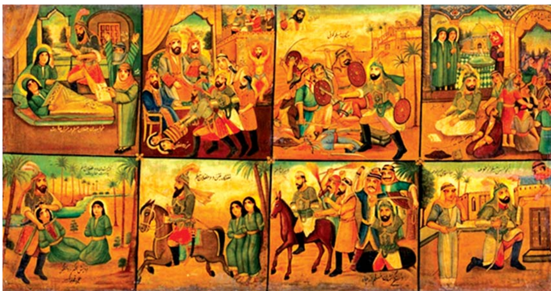
تصویر ۴. روایت عزیمت مسلم بن عقیل به کوفه، محمد مدبر، ۲۵۳ تا ۲۰۴ سانتی‌متر. رنگ و روغن، ماخذ: موزه رضا عباسی