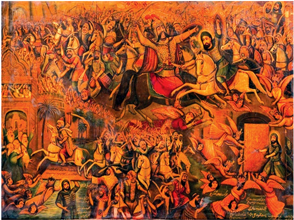
تصویر ۱. جنگ خیبر. اثر عباس بلوکی فر. رنگ روغن. ۱۳۵ در ۲۰۰ سانتی متر، مأخذ: مجموعه هنرهای دینی امام علی (ع).