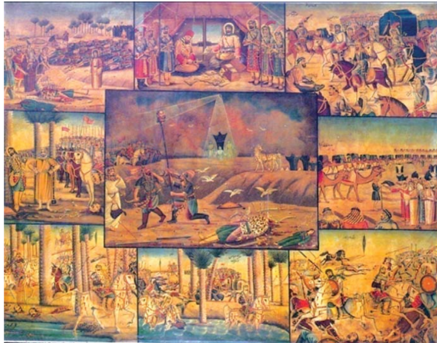
تصویر ۶. مصیبت کربلا. گودال قتلگاه. اثر محمد مدبر. ۱۹۸۰ در ۲۱۵ سانتی متر. رنگ روغن. موزه رضا عباسی، ماخذ: همان

در تصاویر ۱ و ۲ مضامین هر دو نقاشی مذهبی است. ساختار به هم پیوسته هر دو اثر و قرارگیری پیکره‌ها هیچ‌گونه جدایی تصویری را نمایان نمی‌کنند. تمام عناصر در یک پرده واحد و یکجا به نمایش درآمده‌اند. بالا و پایین تصویر از سوی نقاش به عنوان معیار چیدمان عناصر مطرح نیست و همه چیز در یک پیکره واحد تصویری عرضه می‌شوند. نقاش بر اساس نیاز خود و با توجه به اهمیت هر پیکره آنها را در جایی از تصویر نقش کرده است. تصاویر اصلی عموماً دارای یک مرکزیت دیداری قرار دارند که با جهت‌دهی حرکت پیکره‌ها یا نگاهشان در تصویر به بیننده القا می‌شود. از سویی، این حرکت با تزئین لباس‌ها و هاله‌های نورانی ائمه معصومین و بزرگ کشیدن پیکره‌ها تشدید می‌شود. بیننده عام با دیدن این تصاویر به آسانی قادر است تا با دانستن اصل داستان روایت مورد نظر را پی‌جویی کند. نقل نیز هنگام نقل به آسانی و به سرعت جای هر روایت و صحنه و افراد نقش اول داستان خود را پیدا می‌کند.