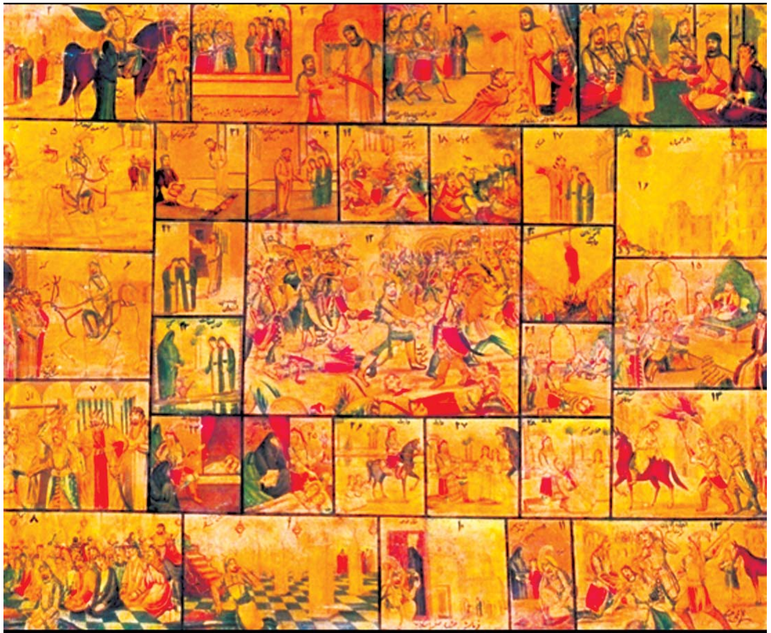
تصویر ۳. داستان مسلم بن عقیل و فرزندانش، حسین قوللر آقاسی، رنگ روغن، ۱۰۶ در ۲۱۵ سانتی متر

جذب نیروهای مستعد هنری و اقبال و توجه مردم به بیان تصویری مضامین حماسی و مذهبی که همواره مورد علاقه مردم بوده، دانسته شده است (همان: ۹۷).