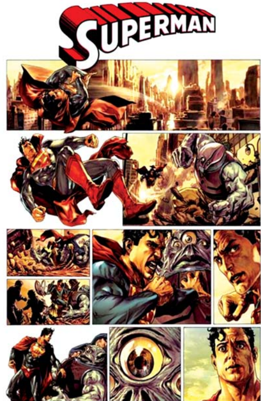
تصویر ۱۰. بخشی از داستان مصور سوپرمن، ترکیب و شکستن کادر برای القا هیجان و تحرک بیشتر در قاب، مأخذ: www.fantasy-illustration.com

از مرزهای باریک اختلاف در هر دو حوزه نقاشی خیالی‌نگاری و داستان‌های تصویری دنباله‌دار درمی‌یابیم که نقاشان خیالی‌نگار همواره ذهن و آگاهی بیننده نسبت به موضوع و ماجرای روایی را مدنظر داشته‌اند. به بیان دیگر، همواره نقش مخاطب در کامل نمودن روایت کلیدی بوده است. از سوی دیگر، این امر باعث حفظ فاصله خیالی‌نگار