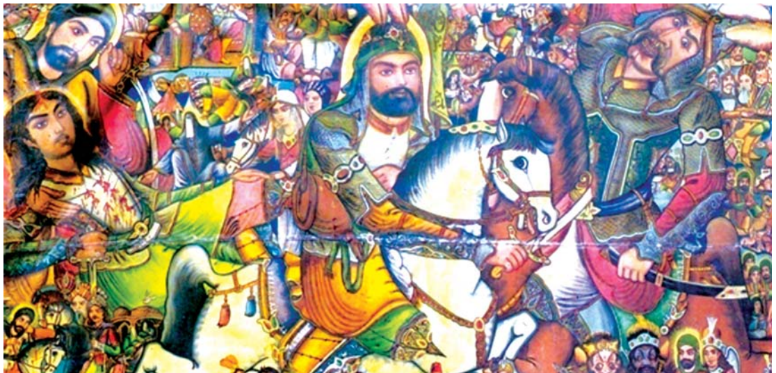
تصویر ۱۱. واقعه کربلا. اثر حسین همدانی. ۱۸۰×۲۳۶ سانتی‌متر. رنگ و روغن روی بوم. ۱۳۳۸. موزه رضا عباسی.

خیالی‌نگاری با موضوع جنگ خیبر (تصویر ۱) فضای تعریف‌شده متفاوت از فضای کوفه در داستان «عزیمت مسلم بن عقیل به کوفه» می‌گردد، اما در فضای به‌کاررفته