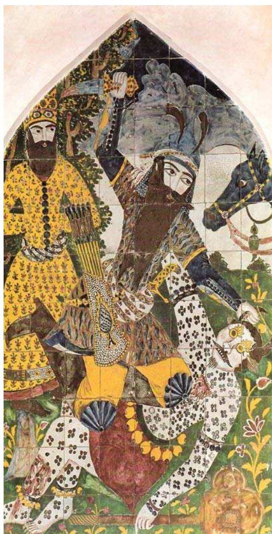
تصویر ۶. جنگ رستم و دیوسپید، عمل آقامیرزا عبدالله نقاش، ۱۲۲۰ هـ ق، حمام قدیمی ملایر.

در نسبت دانی خاندان خود با صفویان و تمجید از افتخارات جنگاوری افشاریان و پیش از آن ترکمانان آق قویونلو و نمود تصویری آن در امر به اجرای دیوارنگاری جنگ چالدران و نبرد کرنال نادر و ستایش جنگاوری‌های آنان پدیدار می‌شود. بدین سبب فتحعلی شاه را باید میراث‌دار سنتی دانست که با اندیشه‌های سیاسی حکومتی پیوسته از دوران پیشین آشنا بوده و بر آن تأکید داشته است. همراهی او در یکپارچگی سیاسی کشور با آغامحمدخان لزوم حفظ وحدت ملی همراه با اتحاد مذهبی و سیاسی را در اندیشه او پروراند و نظر به تثبیت خود در امتداد خط سیر پادشاهی ایران به ثبت شناسنامه تصویری از خود و خاندان قاجار با توسل به الگوهای تصویری و عناصر قهرمانی و ملی پرداخت.