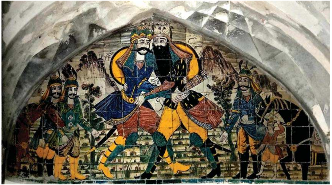
تصویر ۱۴. نبرد رستم و سهراب، عمل استاد حیدر، بدون تاریخ، منسوب به نیمه اول قرن ۱۳ ه ق، اندازه: ۲۰۰×۲۲۰، مکان: حمام قدیمی وزیر، کرمان.