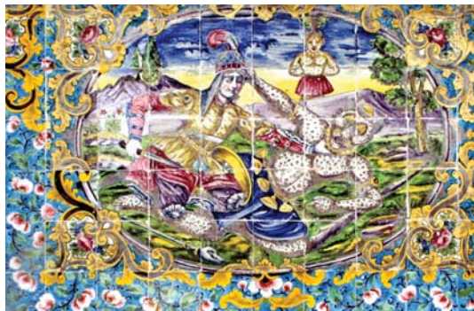
تصویر ۱۱. نبرد رستم و اشکبوس، منسوب به علیرضا قولر آقاسی، نیمه دوم قرن ۱۳، نمای عمارت شمس‌العمار. مؤلف، ۱۳۹۷.