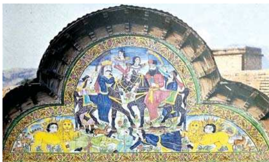
تصویر ۸. نقش سربازان به تقلید از حجاری‌های تخت جمشید، بدون رقم، منسوب به نیمه دوم قرن ۱۳ ه.ق، اندازه: ۸۰×۶۰، مکان: سراسرای ورودی کاخ گلستان، تهران.

که این شبیه را به وجود می‌آورد. دلیل این شبیه دقت در جزئیات این تصاویر، در تقابل با ساده‌سازی‌های تصویری برخی دیوارنگاره‌های عامه است که به نظر محصول عوامل اقتصادی و سیاسی است؛ اما آنچه این تصاویر مکان‌های عمومی را به‌عنوان بازتابی از اندیشه‌های ملی و ایران‌شهری قرار می‌دهد، نه صرف شیوه‌های پردازش اجرا، بل تکرار شاه آرمانی با بازنمایی خیالین رستم، با شمشیری مرصع و در حال کشتن دیو سپید است. (مقایسه تصویر ۳، ۴ و ۵ با تصویر ۶ و ۷) این‌گونه گزینش برداری عامه از تصاویر قدرت دو علت را یادآور می‌شود؛ یکی اندیشه فره‌مندی شخصی چون شاه جهت رویارویی با دیوها در نقوش اسطوره‌ای و مقاوم در برابر هر نیروی دیو انگار در معنا و دیگری الگو برداری از تصویر ثبت‌شده در خاطر هنرمند نقاش و بازآفرینی مجدد آن در مکانی عمومی.