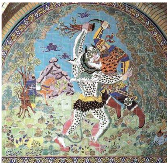
تصویر ۱۳. جنگ رستم و دیو سپید، عمل موسوی زاده کاشی نگار اصفهان، منسوب به نیمه دوم قرن ۱۴، حمام باغ عفیف آباد شیراز.