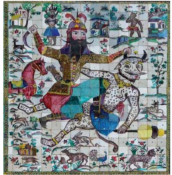
تصویر ۳. جنگ رستم و دیوسپید، شیراز، سردر ارگ کریمخان. مؤلف ۱۳۹۵.

مناسبت‌های تشریفاتی گرفته تا تشکیل انجمن خاقان و تقلید از سبک خراسانی و مدیحه‌سرایی با این سبک و تألیف شاهنامه به نام خود، همه نشان از آغاز دوره‌ای دارد که پادشاه به‌عنوان مظهر وحدت ملی، جایگاه حکومت خود را در امتداد فرهنگ ایران باستان ترسیم می‌کند. اندیشه ایرانشهری دوره قاجار و بالأخص شخص فتحعلی شاه را می‌توان در علت و علل گسترده‌ای جستجو نمود. از اقامت آغامحمدخان و فتحعلی شاه در دربار زندیه، همراهی فتحعلی شاه همراه با عموی خود آغامحمدخان در آرام‌سازی و اتحاد سیاسی کشور، توجه او به وحدت سیاسی و حضور شاه به‌عنوان عامل این وحدت، اقامت در شیراز و آشنایی با آثار باستانی، علاقه به تاریخ و ادبیات و شاهنامه‌گرایی، توجه سیاحان و سفرای دولت‌های اروپایی به آثار باستانی که از دوره صفویه آغاز شده بود تا حضور فرستادگان اروپایی در دربار و هم‌زمانی دوران حکومت او با تحولات اروپای سده نوزده و گرایش‌های نئوکلاسیسم و ناسیونالیسم و توجه به مفهوم ملیت و وطن‌دوستی نزد اروپائیان، همه از عواملی است که در جهت‌گیری شاه تاج و تخت یافته قاجار کم‌وبیش مؤثر واقع شدند.