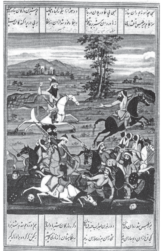
تصویر ۱. جنگ میان زندیان و قاجاریان، شاهنشاهنامه صبا، تهران، ۱۲۲۵ هجری، کتابخانه ایندیافیس، لندن. آژند، مأخذ: یعقوب، ۱۳۹۲.

بنابر تحقیقات سید جواد طباطبایی، حاتم قادری و تقی رستم وندی تداوم فرهنگی این گفتمان محصول متون مذهبی، حماسی و اسطوره‌ای، از جمله در یشت‌ها و شاهنامه فردوسی است که مثال‌های متعددی از رابطه فره ایزدی و شاه آرمانی ذکر شده است. طباطبایی معتقد است: «شاهنشاهی به‌عنوان نهادی عمل می‌کرد که وظیفه آن ایجاد وحدتی پایدار میان اقوام گوناگون بود...» ۳ پادشاه در اندیشه ایرانی‌شهری، رمزی از وحدت در تنوع همه اقوام ملت به شمار می‌آمد. ۴ حاتم قادری و تقی رستم وندی هندسه اندیشه ایرانی‌شهری را برگرفته از سه جزء نظام اعتقادی، اخلاقی و سیاسی می‌دانند و نظام اعتقادی و اخلاقی