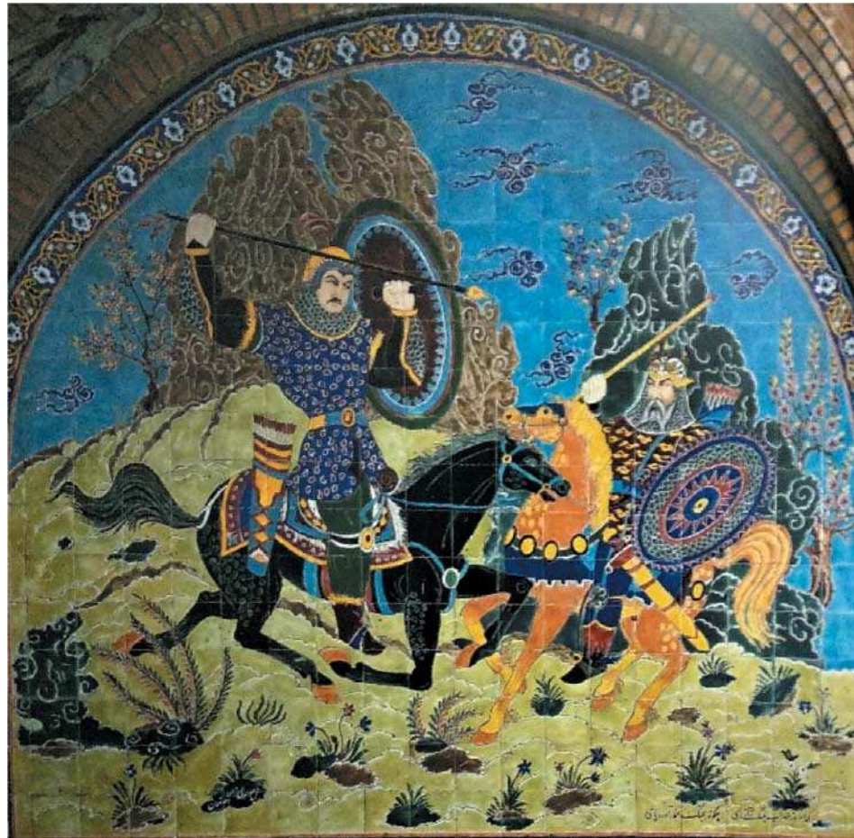
تصویر ۱۵. نبرد رستم و سهراب، بدون رقم، منسوب به موسوی زاده کاشی نگار اصفهانی، بدون تاریخ، منسوب به نیمه دوم قرن ۱۴ ه ق، اندازه: ۲۸۰×۴۲۰، مکان: حمام قدیمی در باغ عقیف آباد، شیراز. مأخذ: همان.